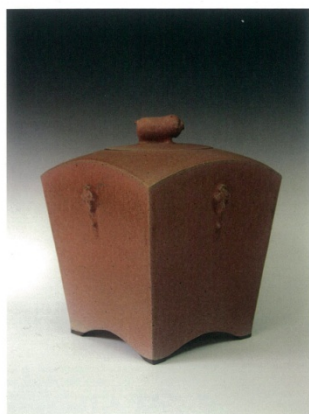
作品名称：《华夏器韵》 作品类别：工艺美术——陶艺 规格：30*30*35(cm) 材质：陶土 创作年代：2015年 作品编号：16G14MS25-03-052