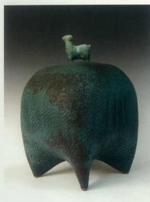
作品名称：《华夏器韵》 作品类别：工艺美术——陶艺 规格：35*35*45(cm) 材质：陶土 创作年代：2015年 作品编号：16G14MS25-05-054