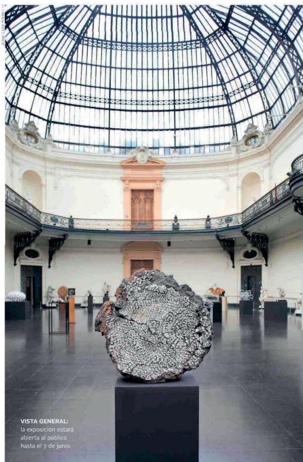
VISTA GENERAL: la exposición estará abierta al público hasta el 7 de junio.

ACABA DE INAUGURARSE EN EL MUSEO NACIONAL DE BELLAS ARTES UNA MUESTRA ORGANIZADA POR LA SOCIEDAD DE ESCULTORES DE CHILE COMO HOMENAJE A LA FALLECIDA ARTISTA LILY GARAFULIC. LAS 30 OBRAS SELECCIONADAS SON UN REFLEJO DEL OFICIO DE LOS AUTORES NACIONALES Y LA VARIEDAD DE MATERIALES CON LAS QUE SE ESTÁ TRABAJANDO.