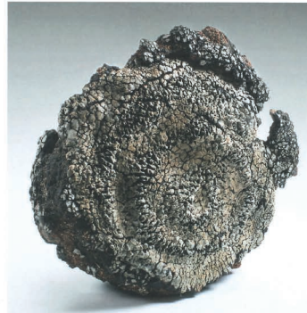
1º PREMIO "TERRITORIO 7" de PASCALE LEHMANN, 2015, Gres de reducción, 75 x 25 x 75 cm de alto.