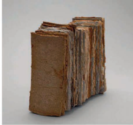
Above left: Teresita Martín. Untitled. 2009. Stoneware, porcelain, slip and oxides. 25 cm. Photo by Fernando Maldonado. Above right: Carola García. Untitled. 2009. Reduction firing, stoneware and slips. 25 cm. Photo by Verdeverde Producciones. Below left: Juan Carlos Chavarría. Untitled. 2009. Wheel thrown stoneware and glazes. 25 cm. Photo by Verdeverde Producciones. Below right: Pascale Lehmann. Untitled. 2009. Stoneware, slip and glaze. 25 cm. Photo by Fernando Maldonado.