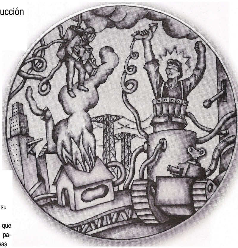
Arriba: "Conexiones Correctas", 2007. Plato de loza a torno, colorante negro bajo cubiet1a. 1000 oC. Diámetro, 35 cm.