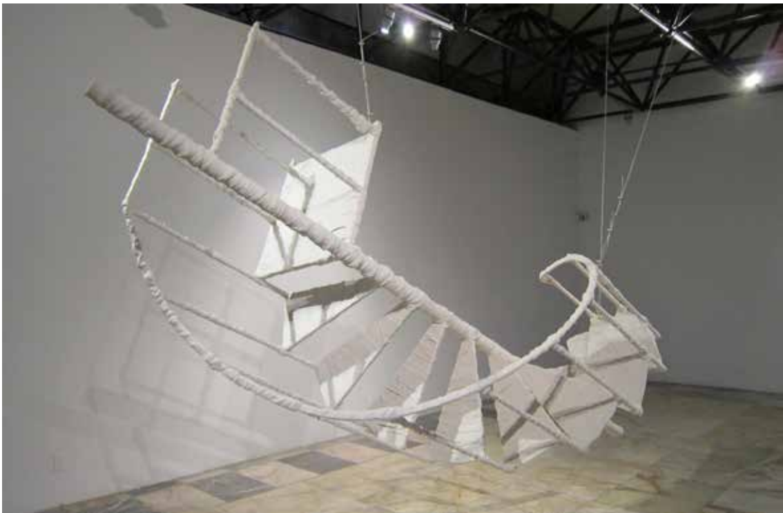
Javier del Cueto, La flecha del aire , 2012. Metal, manta de cielo, barropapel y engobe blanco, 132 x 372 x 138 cm.