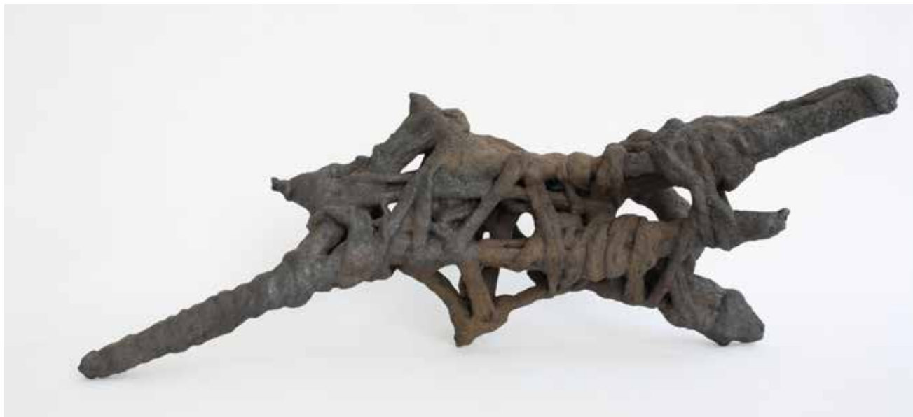
Javier del Cueto, Anudar el aliento 2 , 2010. Cerámica de baja temperatura, cono 5, barropapel y engobe, 18 x 34 x 22 cm.

Las formas de Javier del Cueto, elaboradas con un gran rigor constructivo y al mismo tiempo con un goce en el proceso mismo para obtener superficies tersas, delicadas, proponen una sobriedad radical y una claridad absoluta, que liberan a la escultura de todo lo que no es ella misma. Sus esculturas en pequeño formato son en sí mismas maquetas para esculturas públicas,