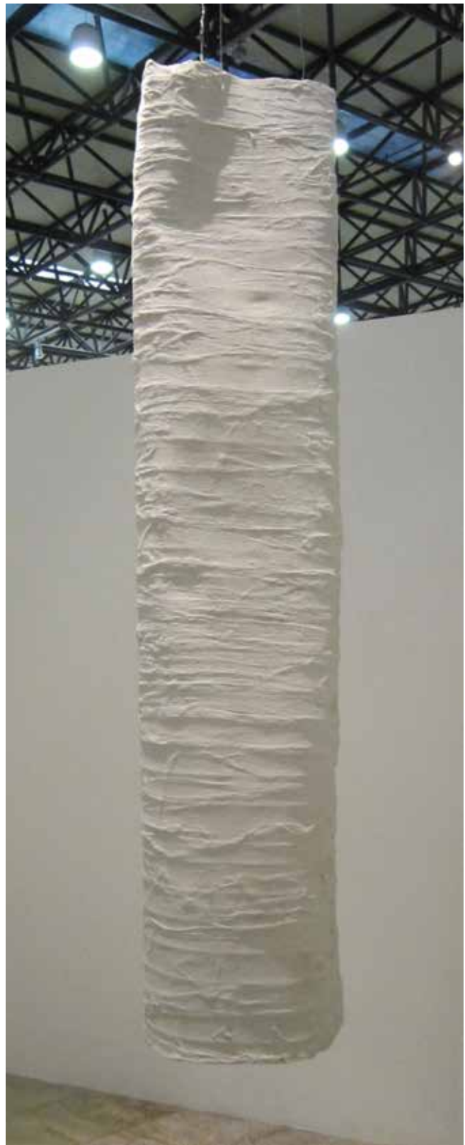
Javier del Cueto, El hueco de una montaña , 2012. Metal, manta de cielo, barropapel y engobe blanco, 230 x 48 x 38 cm.

Ante el peligro que significaba la revisión del documento de ley contra los transgénicos, varios artistas se unieron a una asociación de científicos en defensa