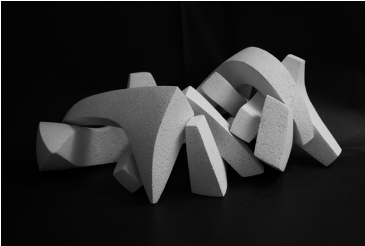
Javier del Cueto, Ecuación , 2014. Siete módulos, cerámica de alta temperatura, cono 6, medidas variables (en la foto: 27 x 42 x 24 cm).