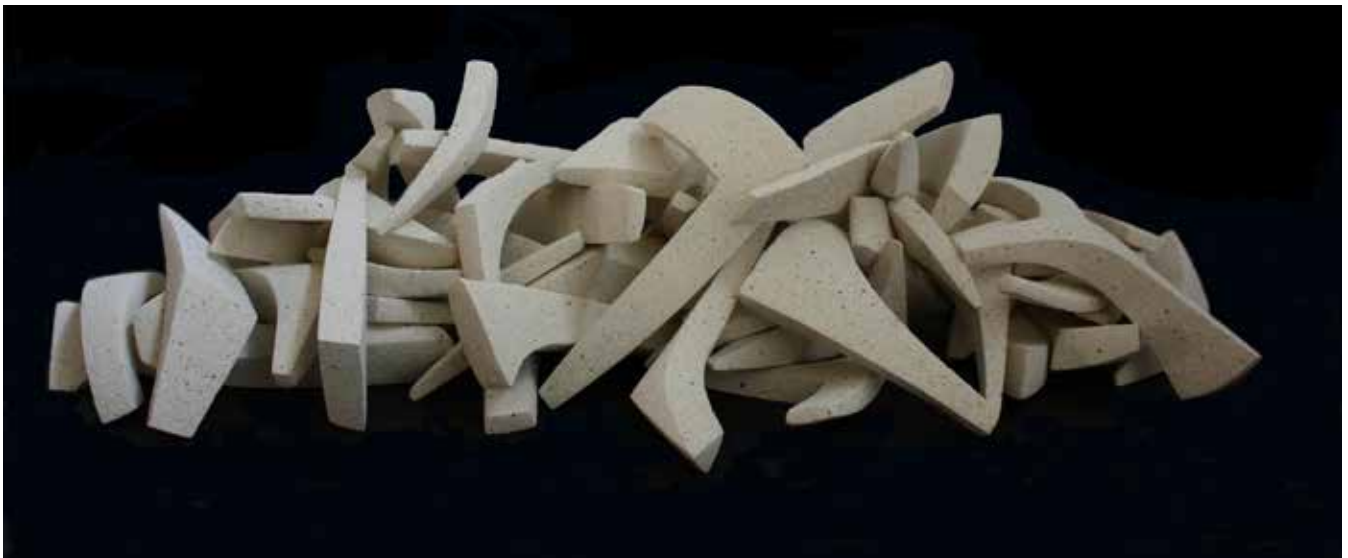
Javier del Cueto, Ecuación no resuelta , 2011. 53 módulos, cerámica de alta temperatura, cono 6, medidas variables (en la foto: 18 x 62 x 23 cm).