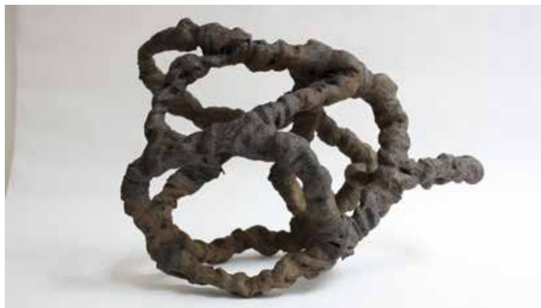
Javier del Cueto, Anudar el aliento 8 , 2010. Cerámica de baja temperatura, cono 5, barropapel y engobe, 18 x 34 x 22 cm.

Las esculturas que presentó podrían considerarse una muestra retrospectiva, que representa una travesía por los estilos por los que fueron marcando las diferentes etapas de su proceso creativo, como él mismo señala, y que van desde la transición del torno a la escultura, la influencia de la Escuela Vasca, el paso paulatino de las formas en bloque a las esculturas modulares, hasta el descubrimiento en 1996 del barropapel, que para muchos creadores significó una nueva manera de abordar la cerámica. 6