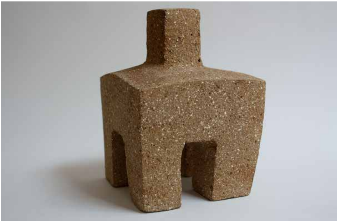
Javier del Cueto, Antes del meridiano 1 , 2009. Cerámica de alta temperatura, cono 6, barro refractario con óxidos metálicos, 16 x 12 x 11 cm.

luego irlo modelando hasta obtener una cierta forma, ésta se deja secar a dureza de cuero, a dureza de hueso y después comienza a tallarla.