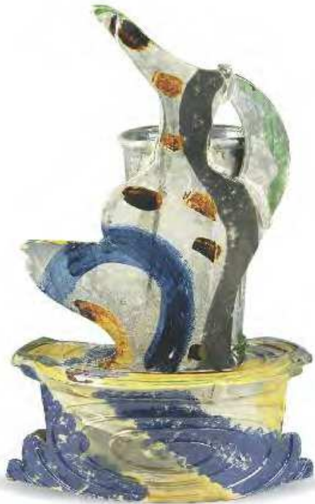
Betty Woodman (1930) Teiera, 1900-1995 ca. terracotta con ingobbi e vetrina inv. n. 29932-29933