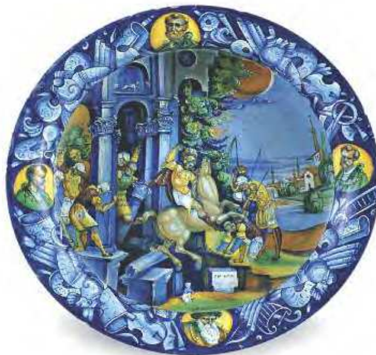
Coppa Faenza, Bottega di Pietro Bergantini 1529 maiolica inv. n. 22019