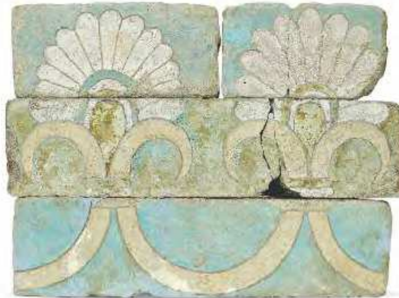
Mattoni Iran, periodo achemenide, 521-358 a.C. faenza silicea smaltata inv. nn. 5480-5483