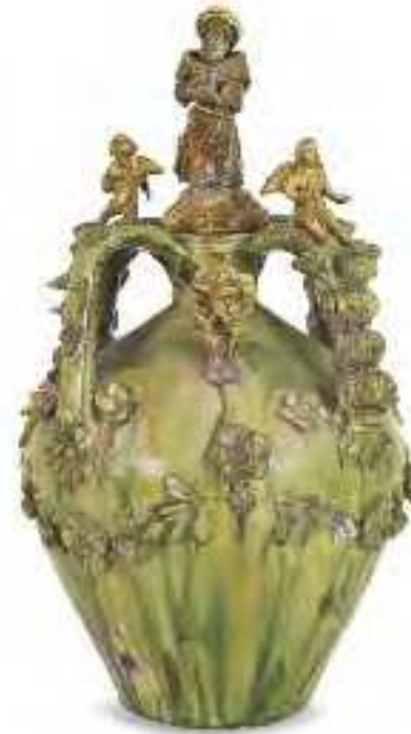
Brocca Oristano Seconda metà sec. XX terracotta ingobbiata e invetriata inv. n. 1765