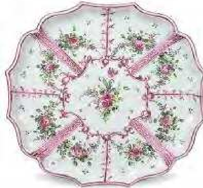
Alzata Pesaro, Fabbrica Casali Callegari terzo quarto sec. XVIII maiolica inv. n. 21835