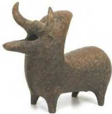
Vaso zoomorfo Iran, Età del ferro, 1100-1000 a.C. terracotta inv. n. 20542