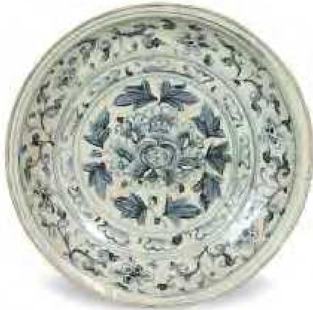
Piatto da esportazione con ornato floreale

Vietnam, fornaci di Chu Dau , 1450-1550 ca. grès dipinto inv. n. 5933