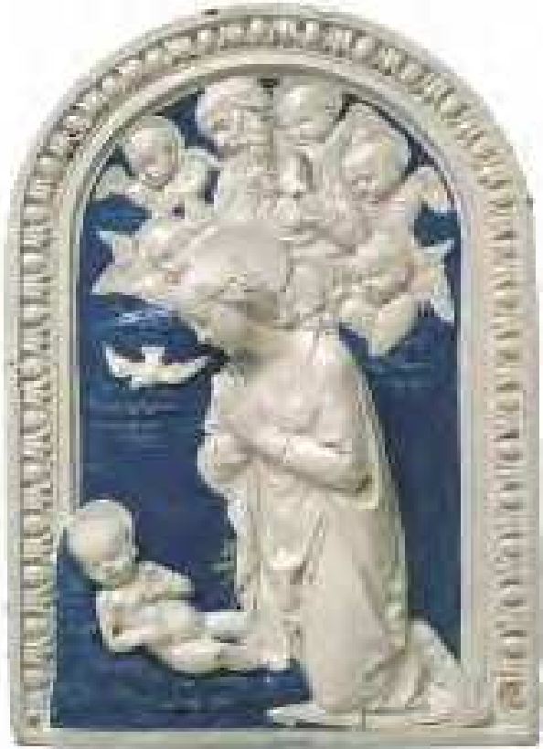
Bassorilievo con L'adorazione della Vergine (L'Incarnazione) Firenze, bottega di Andrea Della Robbia, 1490 ca. maiolica inv. n. 1297