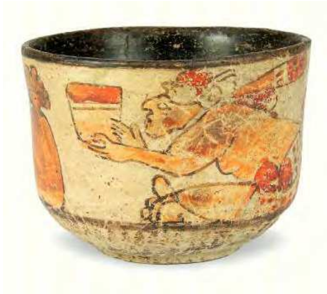
Tazza Guatemala, cult. Maya, secc. VI-X terracotta ingobbiata inv. n. 25729