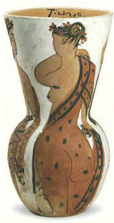
Pablo Picasso (1881-1973) Le quattro stagioni , 1950 terracotta ingobbata, dipinta e invetriata inv. n. 4382