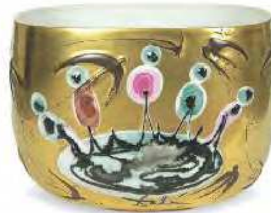
Timo Sarpaneva (design, 1926-2006) e Salvador Dali (decoro, 1904-1989) Servizio "Suomi", insalatiera