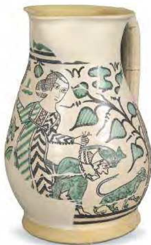
Boccale Faenza fine sec. XIV maiolica inv. n. 19132