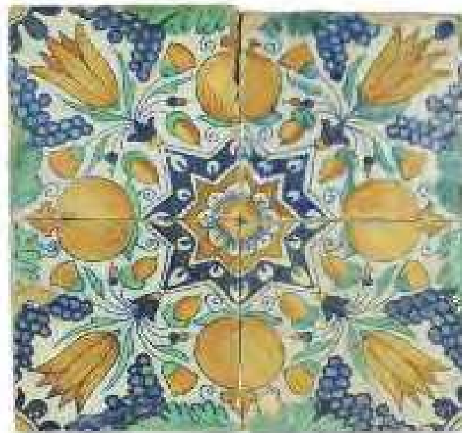
Mattonelle Paesi Bassi, Primo quarto sec. XVII maiolica inv. nn. 2480-2483