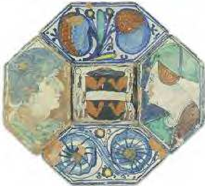
Mattonelle dalla Cappella Brancaccio in Sant'Angelo a Nilo a Napoli Napoli, seconda metà sec. XV maiolica inv. nn. 7033, 18859, 18860, 18862, 18863