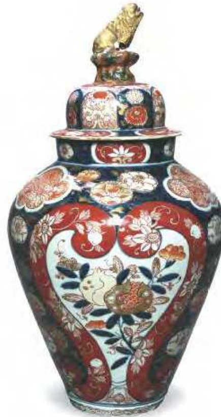
Vaso ornamentale Imari Giappone, Arita, 1710-1759 ca. porcellana dipinta, inv. n. 1216