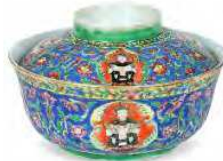
Ciotola da riso e coperchio con Thèpanon e "fiori della foresta Himmapaan"

Vietnam, fornaci di Chu Dau , 1450-1550 ca. grès dipinto inv. n. 5933