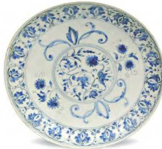
Coppa Firenze, 1580 ca. porcellana "medicea" inv. n. AB 4622