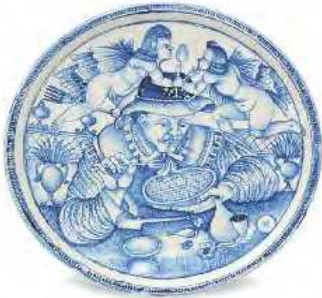
Alzata Laterza fine sec. XVII maiolica inv. n. 10229