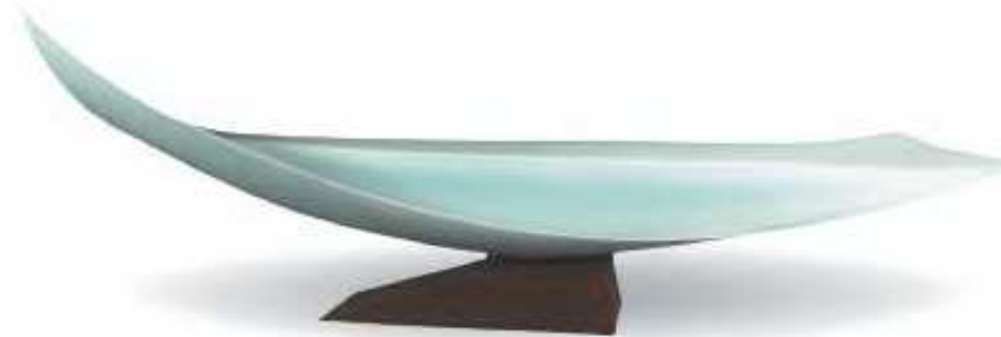
Sueharu Fukami (1947) Shun II (Attimo II), 1998 porcellana inv. n. 23183