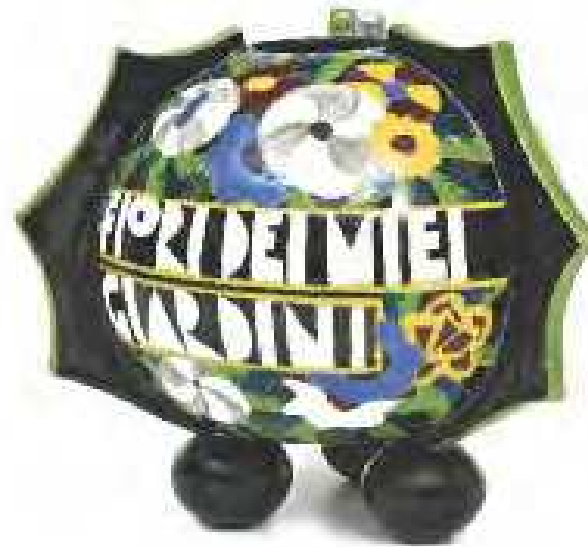
Tullio Mazzotti (Tullio d'Albisola), Fiori dei miei giardini 1929 terracotta dipinta sotto vetrina Albisola, Manifattura Mazzotti inv. n. 2020,2