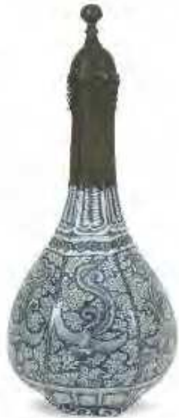
Bttiglia "a fenici e nuvole" Cina, Jingdezhen, sec. XVI, porcellana dipinta sottocoperta ("bianco e blu") inv. n. 5920