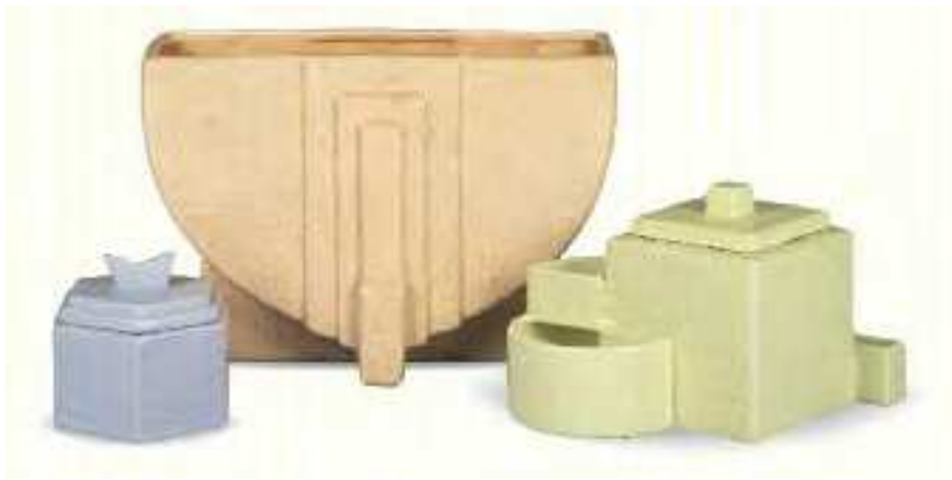
Fabrique Imperiale ET Royale de Nimy Bomboniera, servizio per fumatori, vaso 1928 ca.