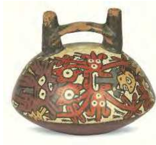
Piccola bottiglia con due beccucci e manico a ponte Perù, cult. Nasca, secc. VI-VII terracotta ingobbiata inv. n. 20483