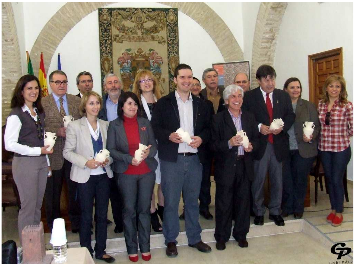
Imagen de grupo de la Asamblea General celebrada en La Rambla (Córdoba), el 2 de Abril de 2011