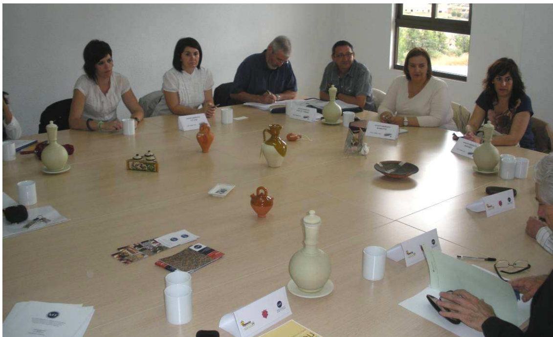
Vista parcial de los asistentes al Comité Ejecutivo celebrado en Agost