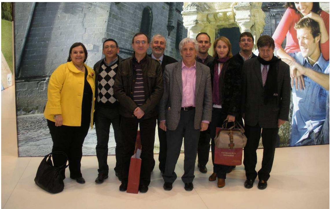
Dos imágenes de la reunión del Comité Ejecutivo en Fitur Madrid, el 21 de Enero de 2011.