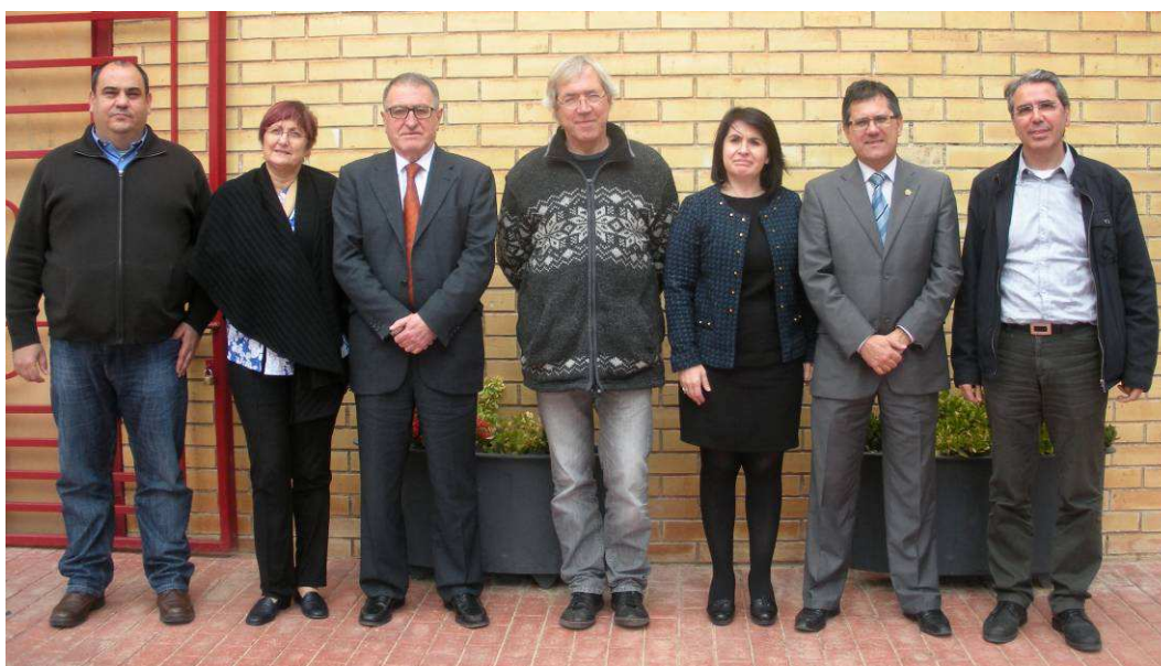
Los miembros del Comité Ejecutivo reunidos en Agost el día 5 de abril de 2013

12 de Diciembre de 2013 - 18.30 h. Ministerio de Economía (Sala F). Madrid