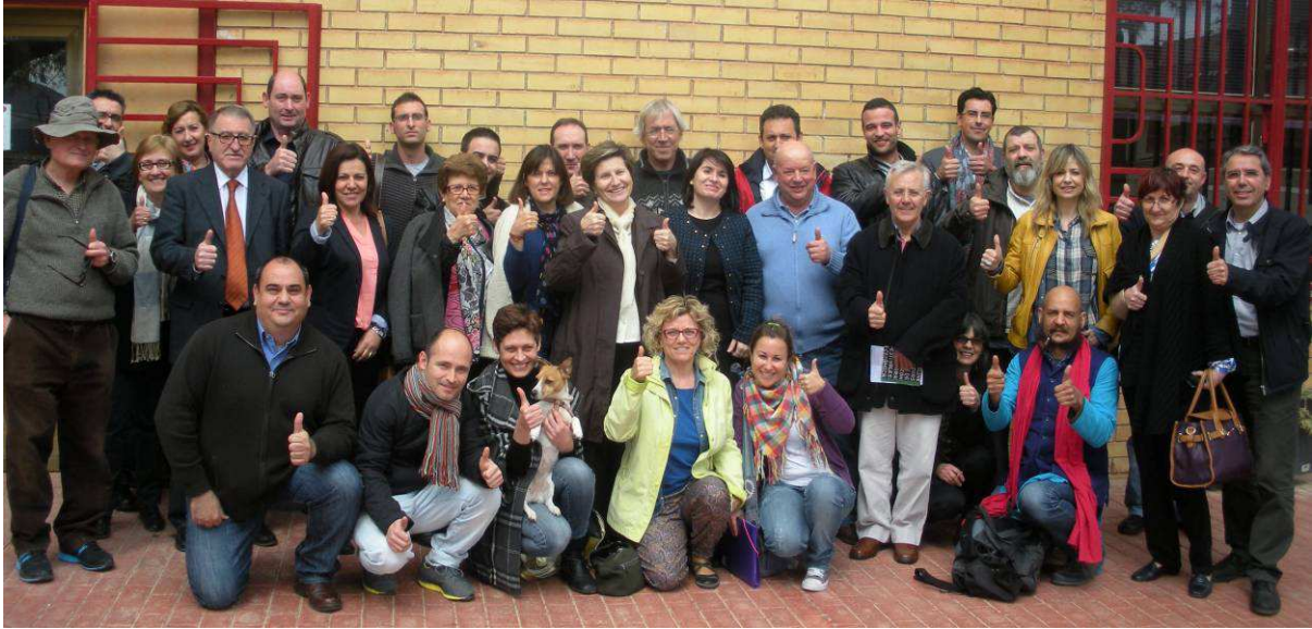
Asistentes a la Jornada Técnica de venta on-line en Agost, el 5 de Abril de 2013