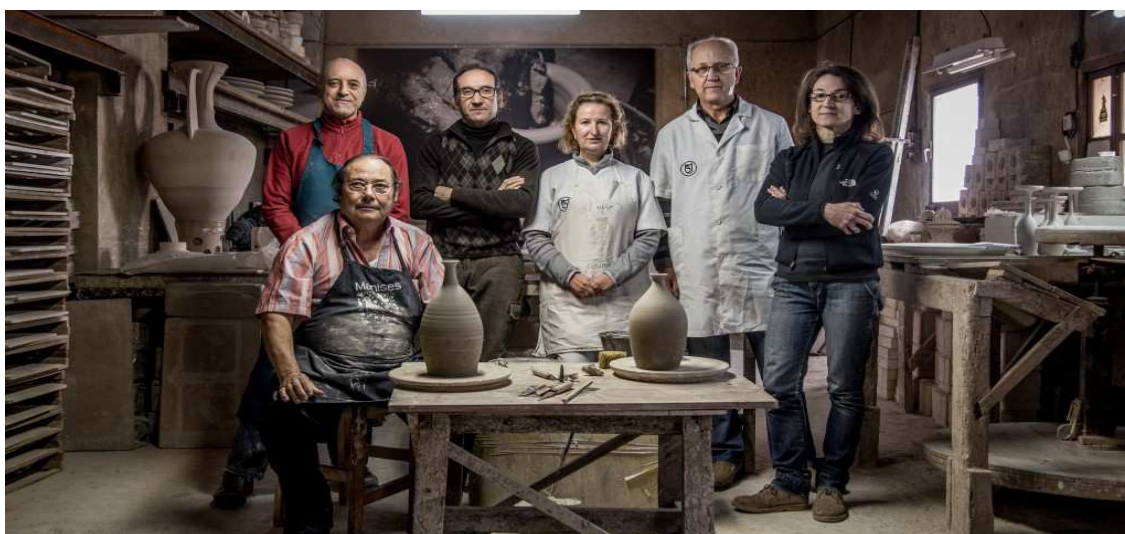
Equipo de trabajo de "La Cerámica Valenciana", de Manises

Después de una rápida consulta a los miembros del Comité Ejecutivo, se optó por aceptar la propuesta de un socio para que los ganadores de los Premios Nacionales de Cerámica que encuadren con los Premios Nacionales de Artesanía sean presentados a este último certamen. Así pues, se presentó a "La Cerámica Valenciana" al Premio Nacional de Artesanía 2013. La propuesta fue seleccionada como finalista, pero no obtuvo el premio, que se falló en la primavera de 2014.