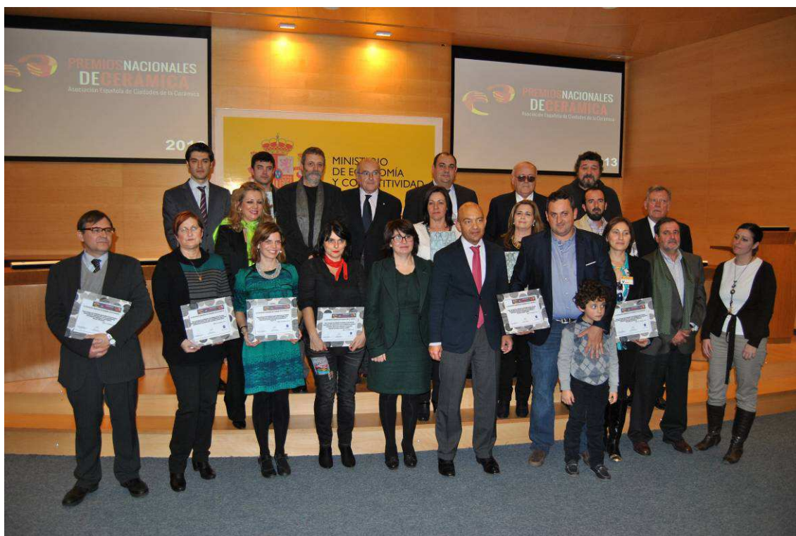
Ganadores y finalistas con la presidenta de la AeCC y demás autoridades en la entrega de los IV Premios Nacionales de Cerámica, entregados en Madrid el 13 de Diciembre de 2013