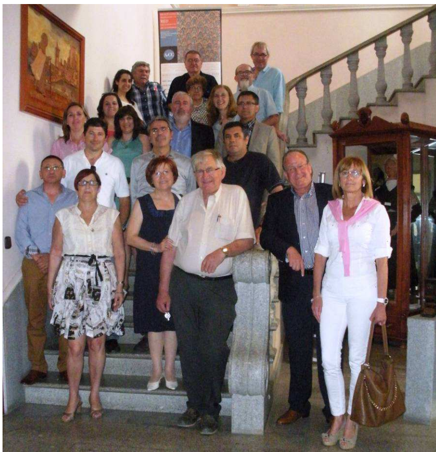
Grupo de asistentes a la Asamblea General Y Comité Ejecutivo de Alba de Tormes el 15 de junio de 2013

La segunda asamblea anual se llevó a cabo en Madrid coincidiendo con los actos de entrega de los Premios Nacionales de Cerámica 2013.