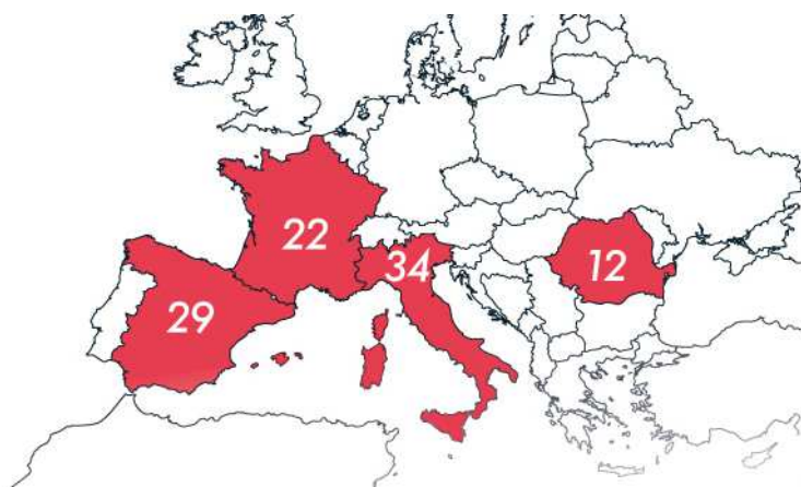
Países integrantes de la AECT Ciudades de la Cerámica, con el número de ciudades afiliadas

Ambos documentos, Convenio y Estatutos, fueron presentados a los respectivos gobiernos nacionales. En nuestro caso ante el Ministerio de Administraciones Públicas, a fin de obtener las autorizaciones previas para la firma de la Escritura pública de Constitución. Firma que deberá realizarse en España, al haberse fijado el domicilio social de la Agrupación en España.