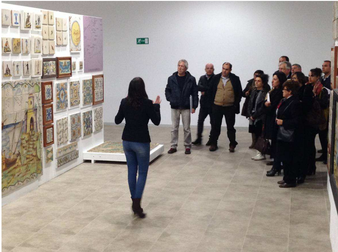
Visita guiada en el Museo del Azulejo M. Safont de Onda después de la Asamblea