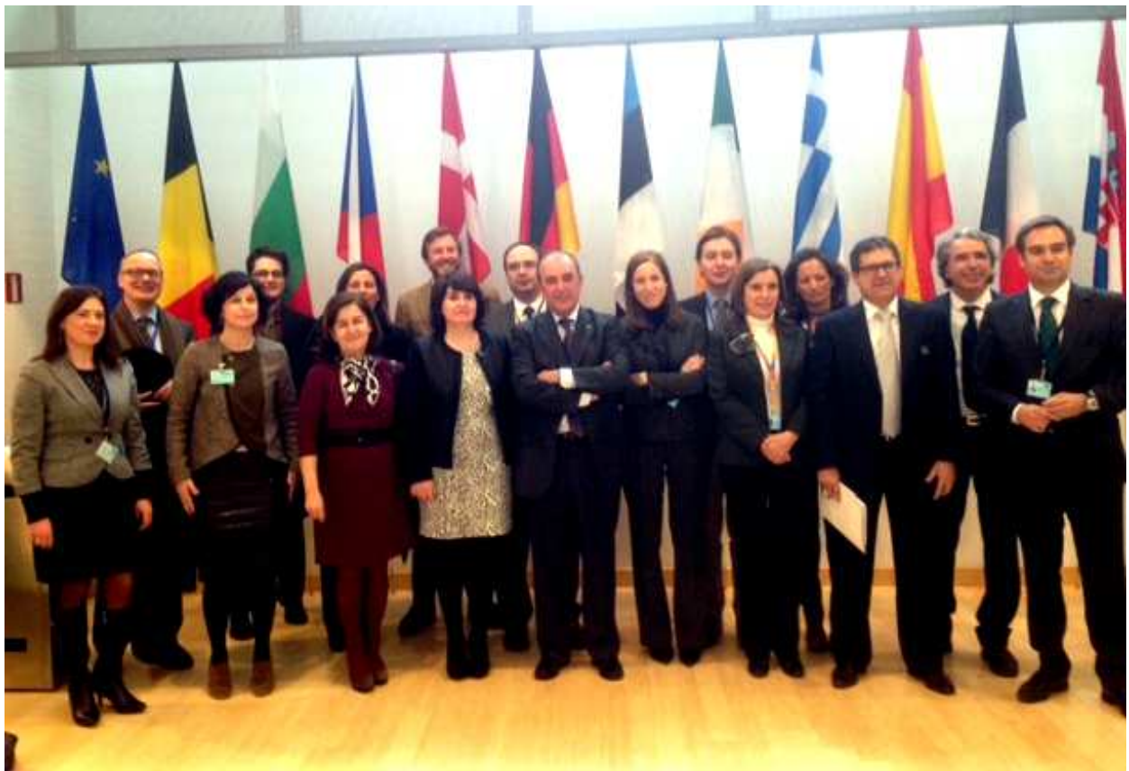
Delegación española recibidos en el Comité de las Regiones el 30 de Enero en Bruselas

- Reunión de la delegación española y el Director de Proyectos con representantes de la Dir. Gral. De Empresa de la Unión Europea. Nos dieron indicaciones de cómo conseguir el apoyo de la UE para nuestra Agrupación y posibles proyectos de interés para el sector cerámico artesanal de nuestras ciudades.