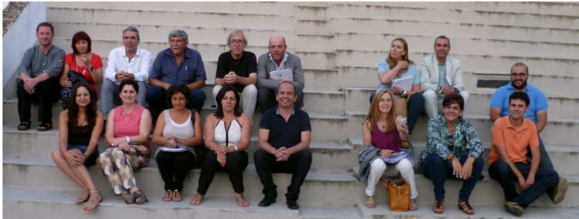
Grupo de asistentes a la Asamblea General de Arroyo de la Luz