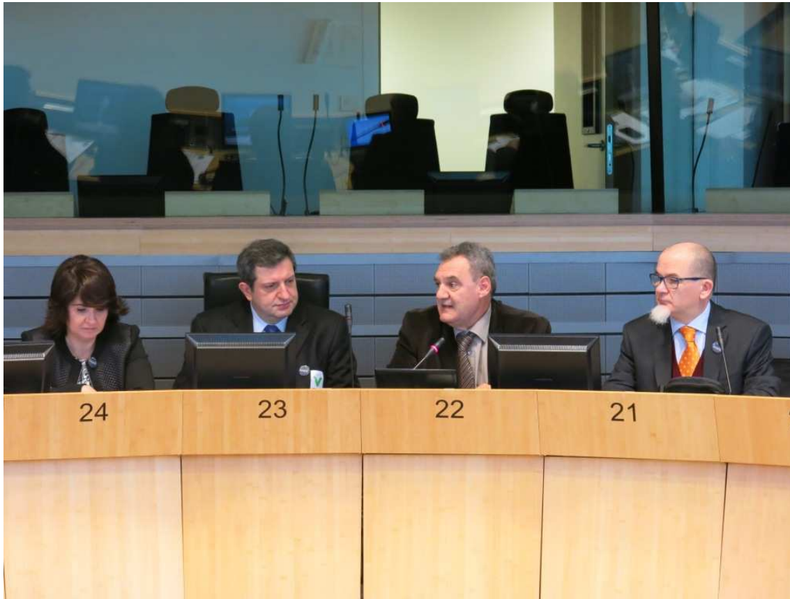
Imagen de la presidencia de la asamblea, con los presidentes de las asociaciones de España, Italia y Francia y el director de proyectos.