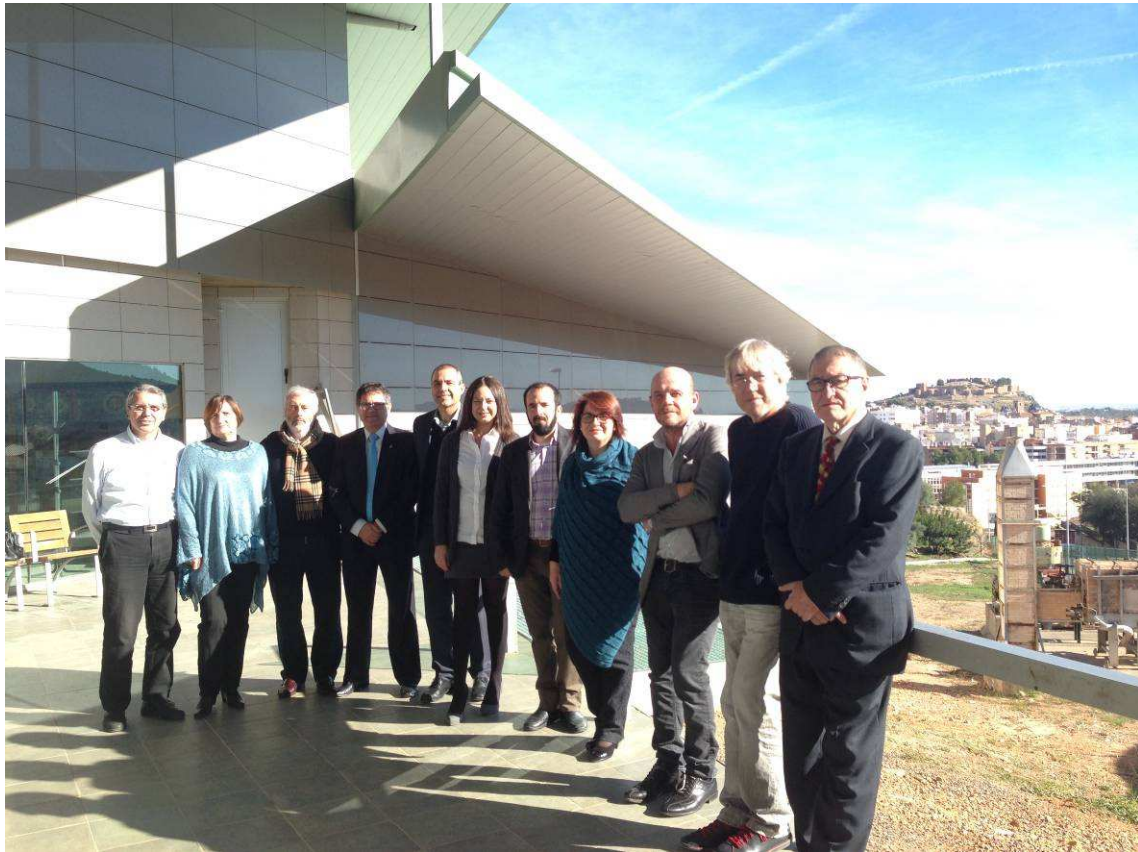
Los miembros del Comité Ejecutivo después de la reunión en Onda, la mañana del 11 de diciembre