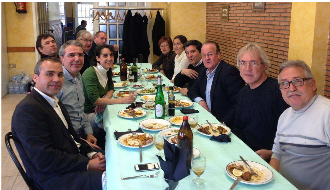
Los últimos de todo el grupo de la AeCC, comiendo en Ribesalbes