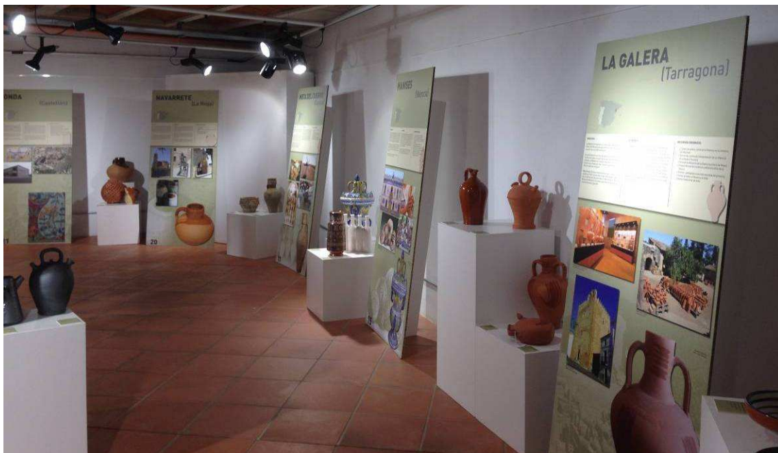
Dos vistas de la presentación de la exposición en el Museo de Quart