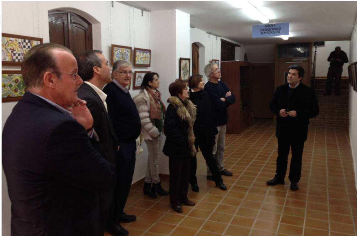
Visita guiada al Museo de Ribesalbes