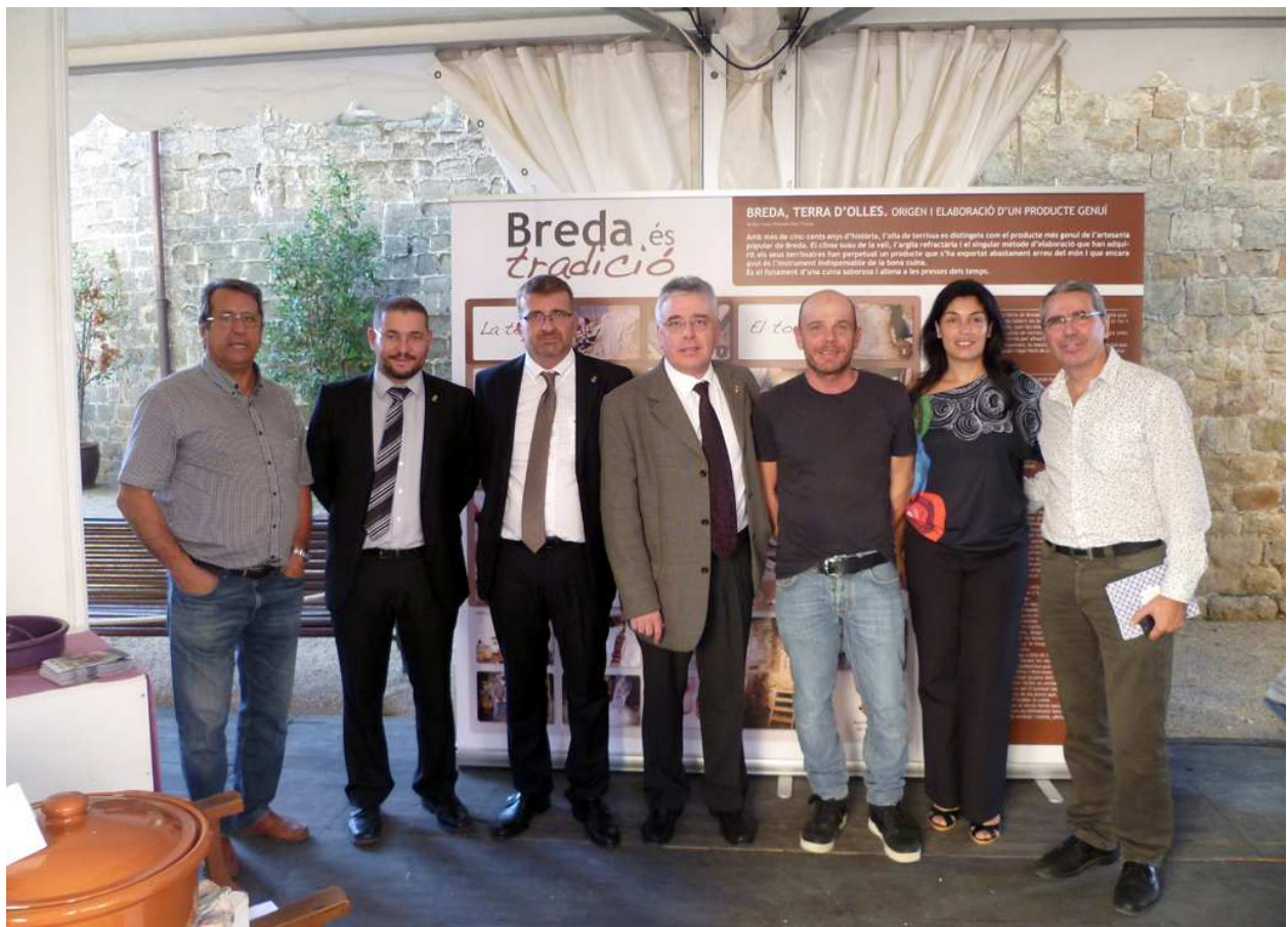
Foto de las autoridades que asistieron en el acto inaugural de la feria de Breda

Se ha presentado en Breda (Girona) la exposición itinerante de la AeCC, coincidiendo con su feria de cerámica el día 12 de octubre. Se ha aprovechado para completar la muestra con los plafones y piezas de los municipios que en su día no facilitaron dicha información. Quart se ocupa de obtener la documentación que falta.