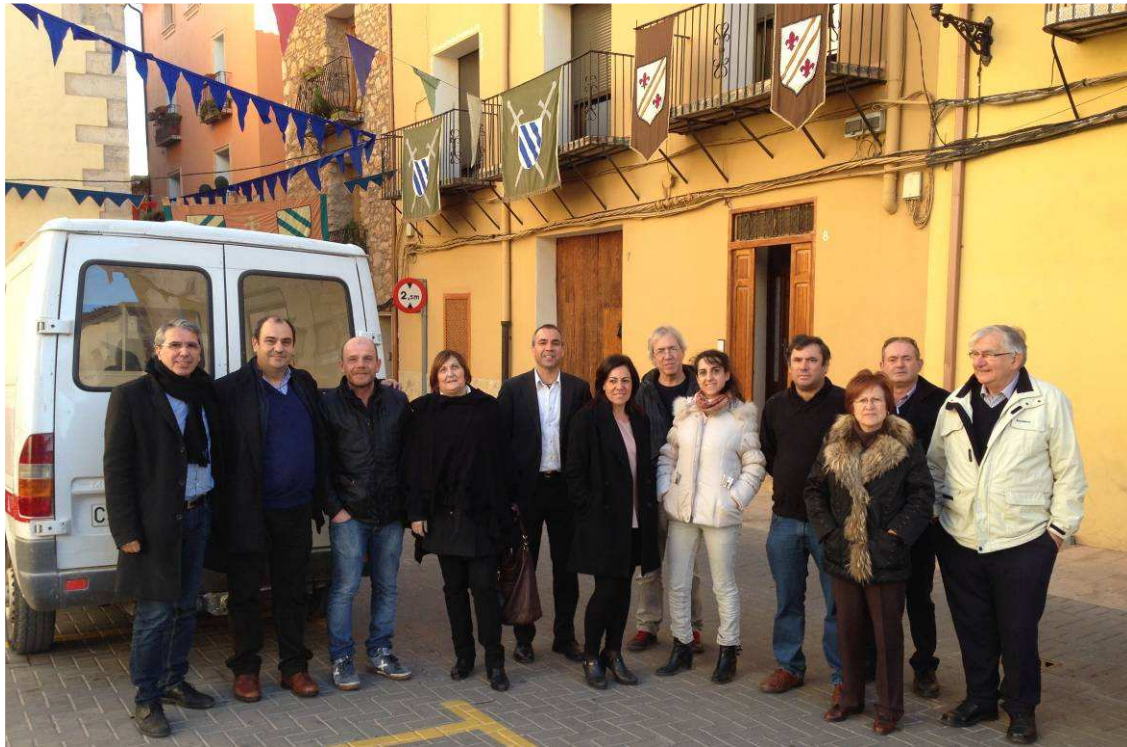
El grupo de la AeCC en L'Alcora el 12 de diciembre