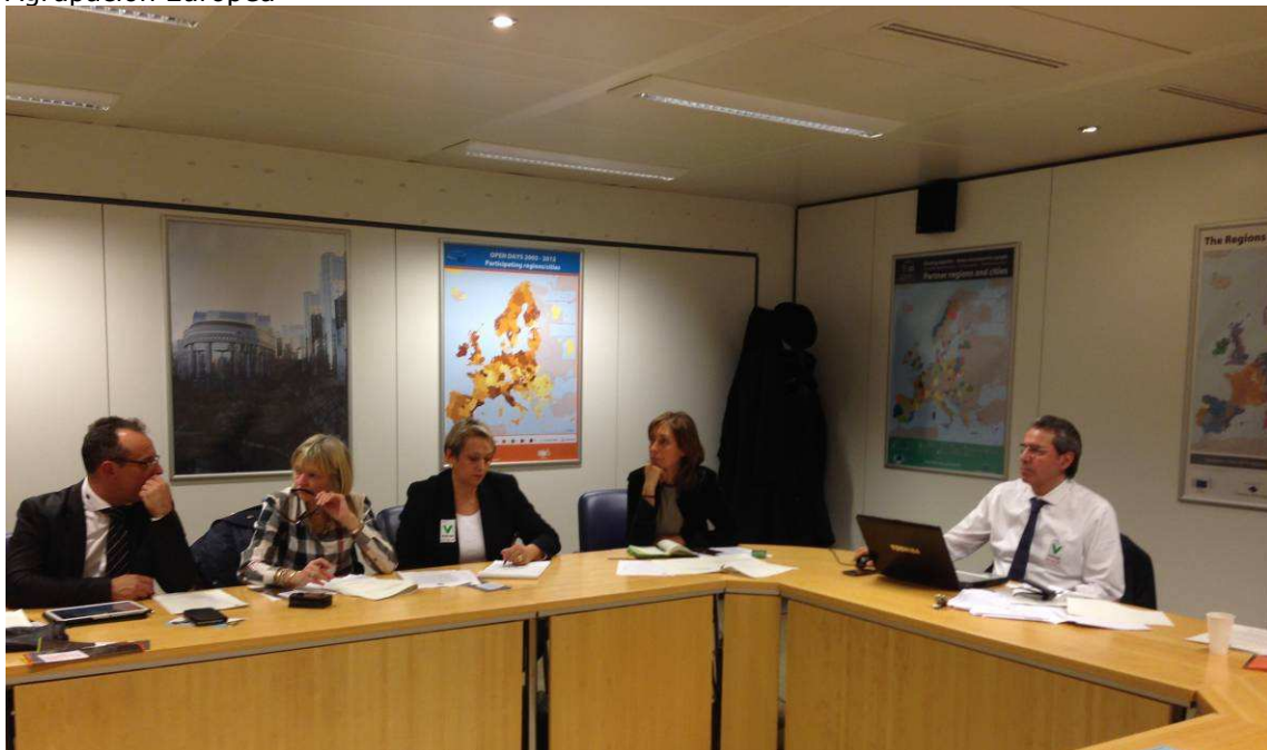
Vista de la Asamblea General de la AEuCC