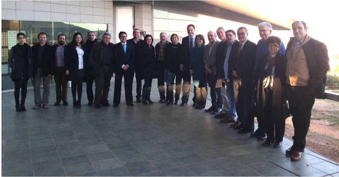
Asistentes a la Asamblea General de Onda, el 11 de diciembre de 2014