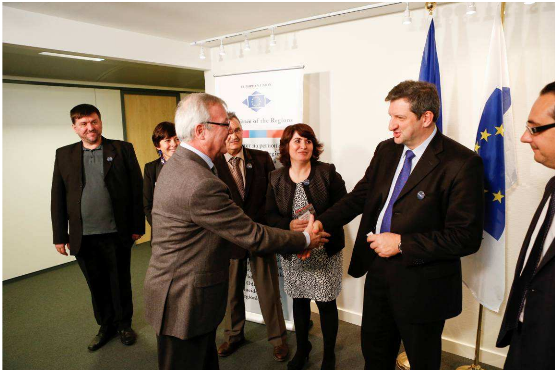
Recepción del Presidente del Comité de las Regiones, Sr. Ramón Luíz Valcárcel a los directivos de la AEuCC