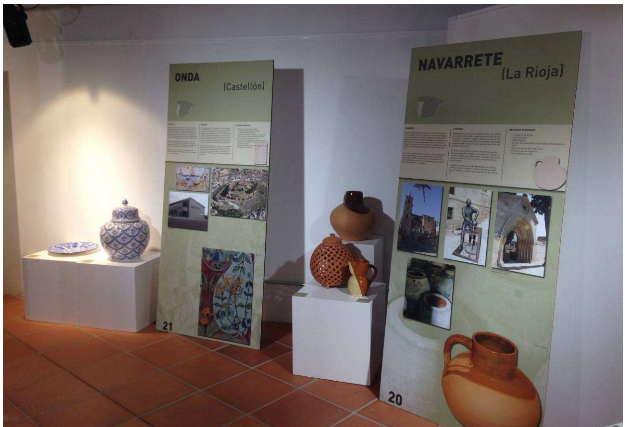
Dos vistas de la presentación de la exposición en el Museo de Quart