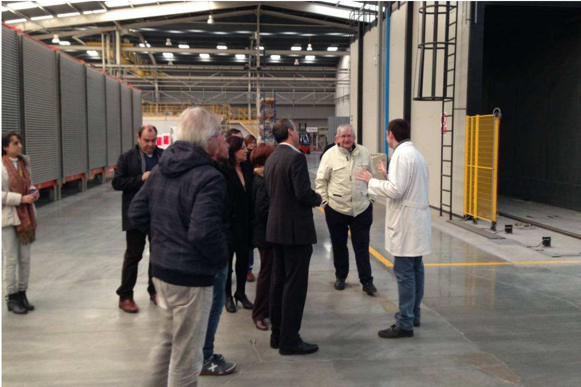
Visita a la fábrica de azulejos Peronda de Onda, con una avanzada tecnología reproducción