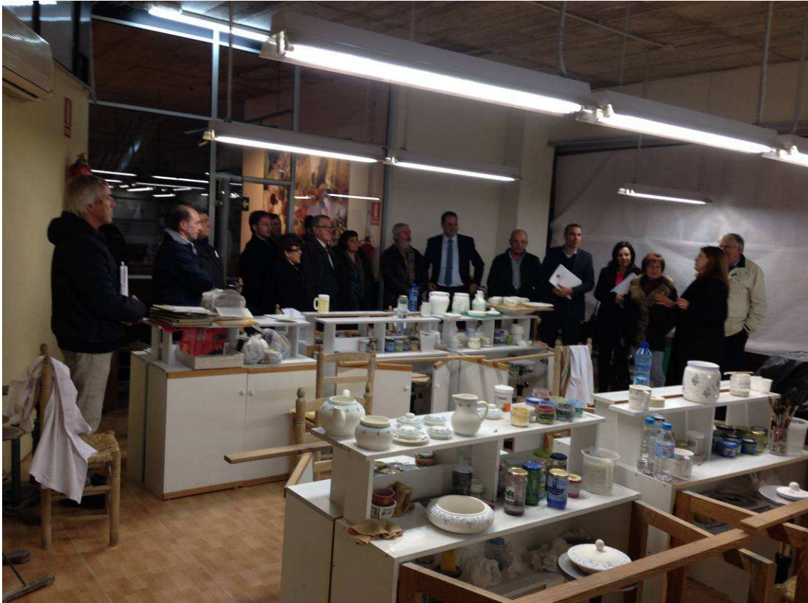
Visita al taller didáctico del museo