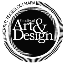
Fakulti Seni Lukis & Seni Reka