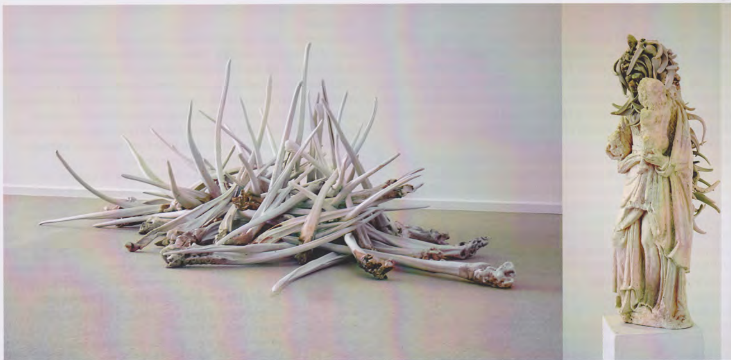
'RELIKWIEËN', PORSELEIN EN 'APOLLONIA', PORSELEIN EN PLAASTER / DETAILS UIT 'WESTERWALD'