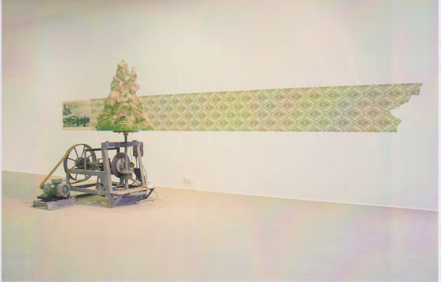
'PARNASSUS' © MARIEKE PAUWELS

Toch krijg ik vaak de commentaar dat ik hard werk maak voor een vrouw. Zelf heb ik daar nooit zo bij stilgestaan. Ik maak inderdaad geen zoete postuurkes , dus misschien klopt dat wel.'