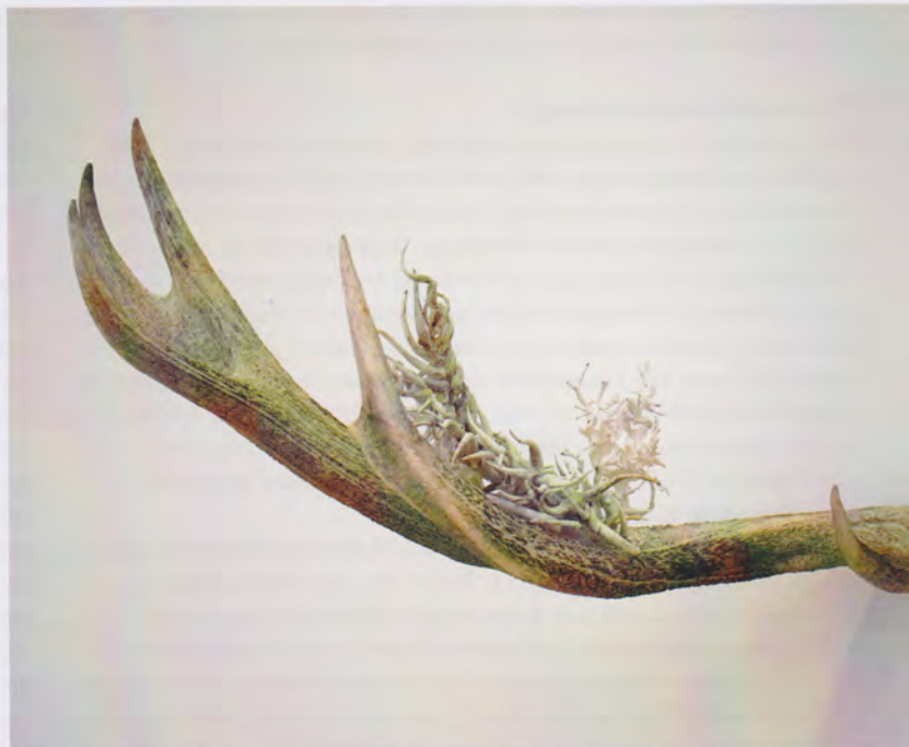
'GEWIJD' PORSELEIN, PLAASTER EN GEWEI © MARIEKE PAUWELS

'Je me suis déshabituée d'attendre quelque chose du public. Maintenant je trouve important de me poser la question si quelque chose est bonne ou non. Cela me rend plus heureuse. Il vaut mieux appliquer cela à d'autres aspects de ma vie', dit-elle en riant. 'Cela a partiellement à faire avec mon art en soi. Je rentre toujours plus dans mon propre monde, si bien que je fais des choses qui ne répondent pas toujours à une opinion moyenne. Je quitte les routes principales et je prends des chemins de traverse que d'autres gens ne fréquentent pas. C'est là-bas que je trouve les choses les plus riches. Mais pas tout le monde a pris ce chemin, donc il y a des gens qui ne peuvent pas le comprendre. Reste la question si on les attend ou non. J'ai décidé de ne pas le faire et de continuer simplement.'