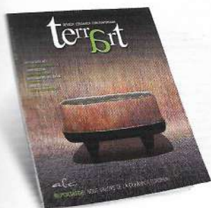
Portada: Peça de Rosa Cortiella.