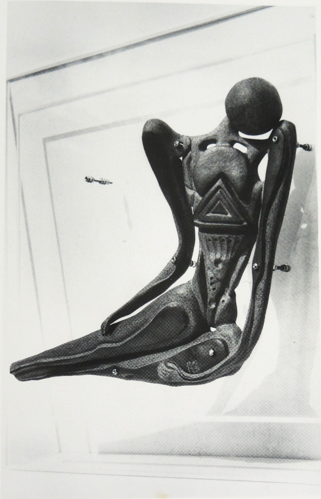
11. コスタス・カラキツォス 《Spiritual Contact》 Kostas KARAKITSOS "Spiritual Contact"