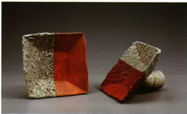
梁家豪 「空·渡」系列2013-1 (左), 2013-4 (右) 2013 雕塑土、壓模及手塑成形、化妝泥漿、1200°C氧化燒成 每件23×23×20cm 2014年於Style+風格設計藝廊、台北國際藝術博覽會展出

糙的對比關係。如並置的八組黑色方形盤作品，配合盤內淺淺的空間變化，梁家豪運用巧思在其上各安排了不一樣的幾何裝飾圖騰，搭配陶瓷特有的裂紋或斑駁質感，觀者可以簡潔地回到物件本身，從其外形、色彩、線條、質地等多層次的關係中，享受單純的審美感受。