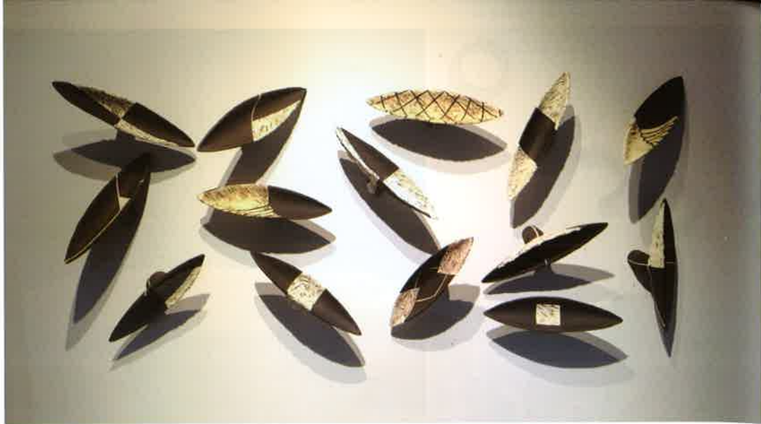
梁家豪 「空·渡」系列LB 2014 雕塑土、壓模及手塑成形、化妝泥漿、1180°C氧化燒成，空間裝置 每件42×15×15cm 2014新北市藝文中心梁家豪陶塑展

的感受力之不同而有所不同。或許，回歸到觀賞造形本身的點線面布局與色彩規畫，回到最簡單的造形美學的感動，將會獲得更直接、更有力量的感受力。或許也可以這樣說，這時期是梁家豪個人生命與創作歷程的過渡時期，是延續到下一階段的過渡狀態。