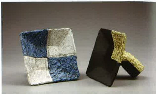
梁家豪 「空·渡」系列2013-2（左），2013-3（右） 2013 雕塑土、壓模及手塑成形、化妝泥漿、1200°C氧化燒成 每件23×23×20cm 2014於Style+風格設計藝廊、台北國際藝術博覽會展出

又2014年「空·渡」系列作品，是以碟盤容器造形為基礎，有方形盤、圓形碗狀、長梭形以及內有螺旋狀的同心圓碗狀。方形盤內有一個小方形的平面，此內方形稍微向左旋轉了10度，與外方形產生微微錯置的關係，而有一點點小小的變化或動態感。圓形碗狀、內有螺旋狀的同心圓碗狀以及長梭