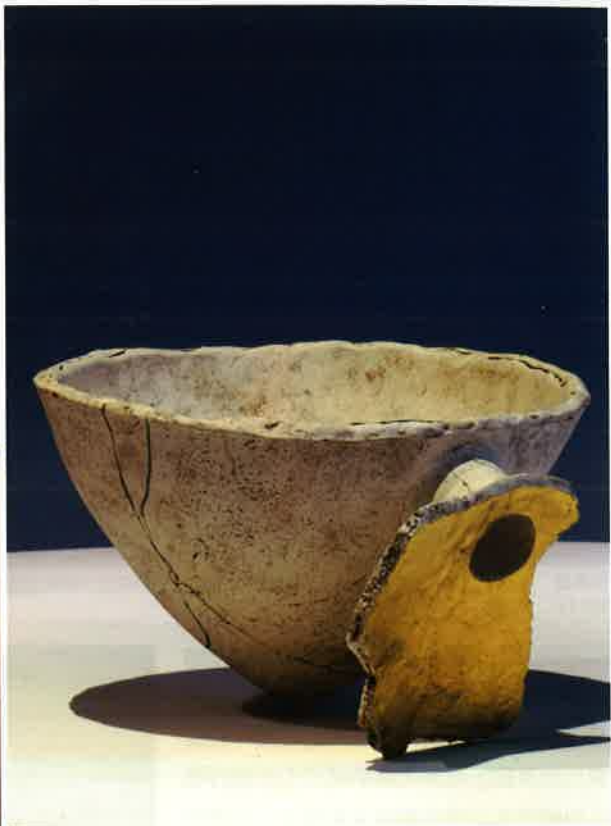
左·梁家豪「過渡空間」系列 2008 雕塑土、壓模及手塑成形、化妝泥漿與乾裂釉、1200°C氧化燒成，空間裝置 2008澳洲雪梨大學藝術學院藝廊個展