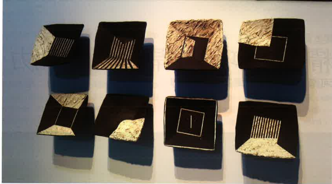
梁家豪 「空·渡」系列BW1~BW8 2014 雕塑土、壓模及手塑成形、化妝泥漿、1180°C氧化燒成 空間裝置 每件22×22×19cm 2014新北市藝文中心梁家豪陶塑展