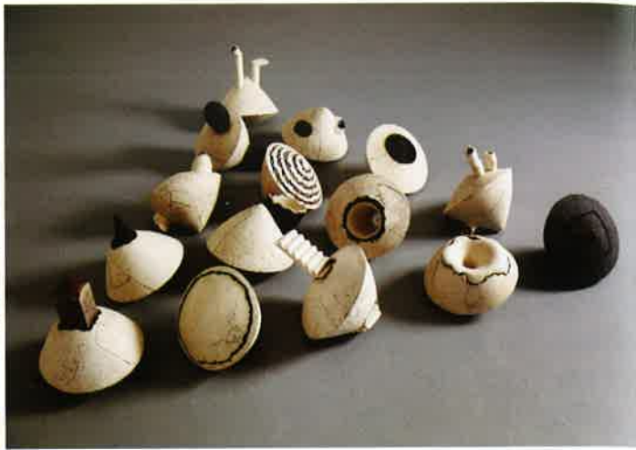
陶藝家梁家豪／右·梁家豪 「過渡空間」系列 2009 雕塑土、壓模及手塑成形、化妝泥漿與乾裂釉、1200°C氧化燒成 空間裝置 每件25×25×25cm 2009韓國世界陶藝雙年展入選；收錄於500 Ceramic Sculpture, Lark Book

這一條路，就像梁家豪自己說的，「嚴肅的事情，簡單看待」、「喜歡做的，便想要一直做下去。」我深信，他是的。