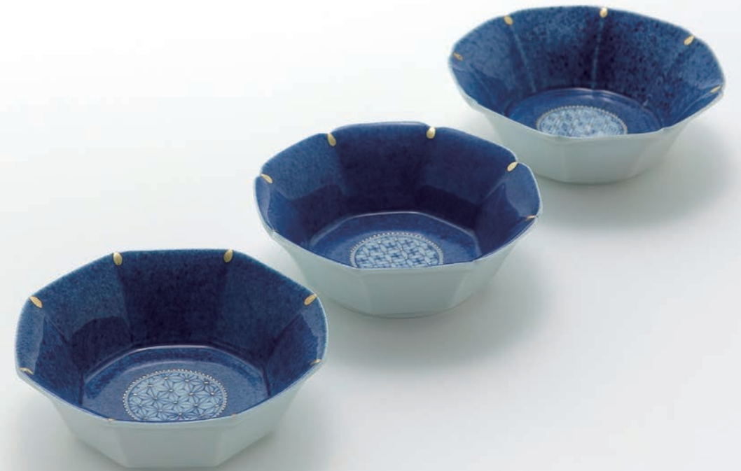
Octagon Bowl | 13.8×13.8×4cm