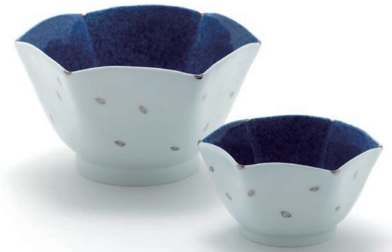
Wave Bowl (s)11.5×11.5×6.5cm/ (m)16.5×16.5×9.2cm