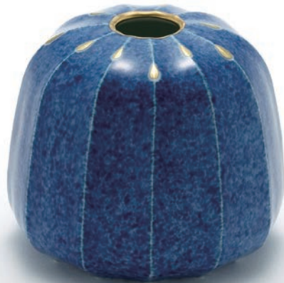
Salon de bleu Kang In Kyung