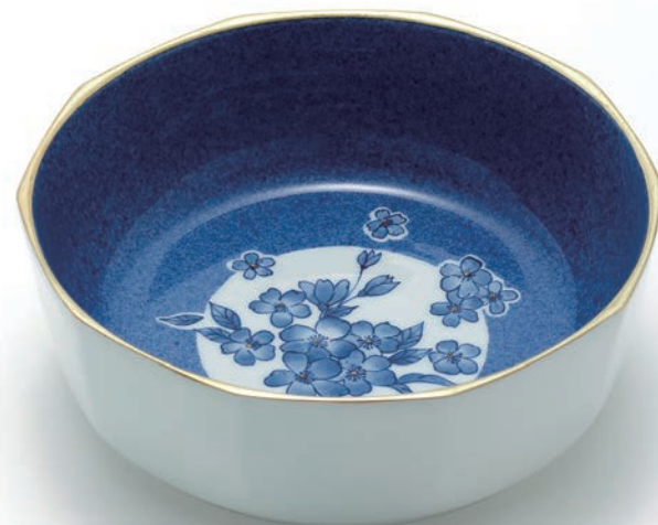
Blue Blossom 20×20×6.9cm