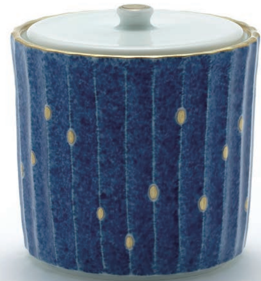
Gold dot Jar 9x9x9.5cm