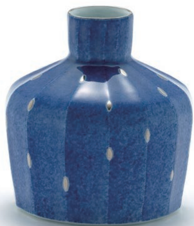
Gold dot vase 10×10×11cm