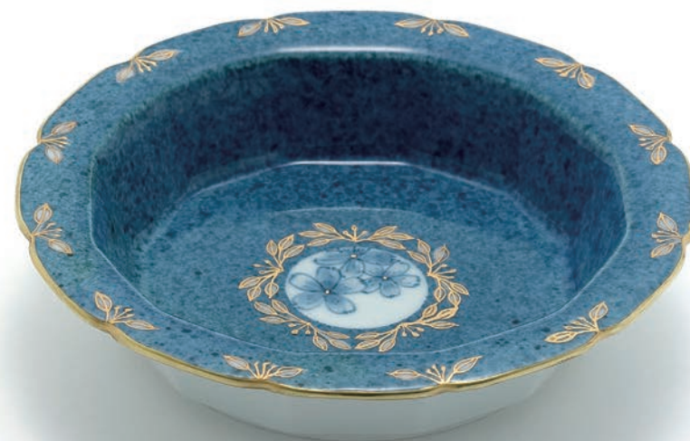
Blooming Plate 12×12×4.5cm