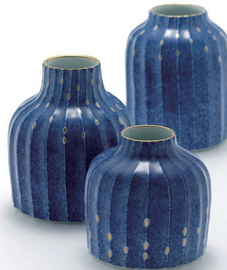
Gold dot Vase 9×9×9.5cm, 9.5×9.5×12.5cm, 10.5×10.5×12.5cm