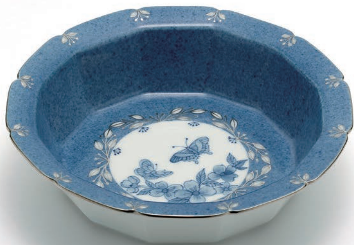
Blooming Plate 20.5×20.5×5.5cm