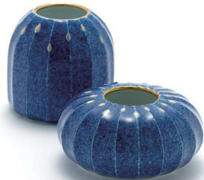
Gold dot vase 8×8cm, 10.5×10.5×5.5cm