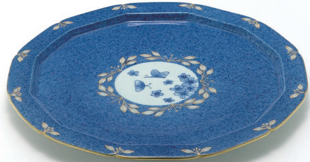
Blooming Plate 28×28×2cm