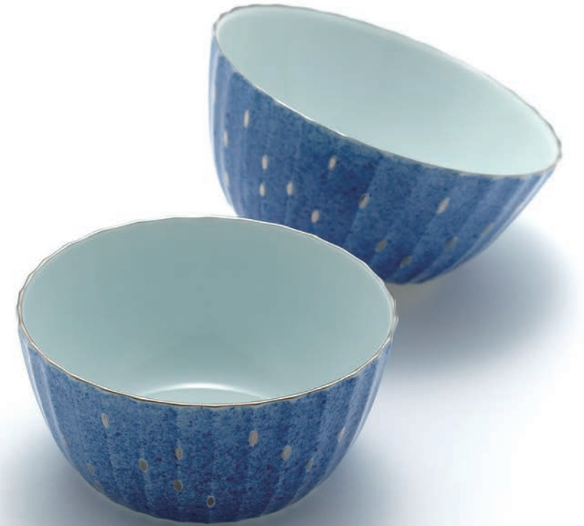
Gold dot Bowl 13.4×13.4×6.3cm