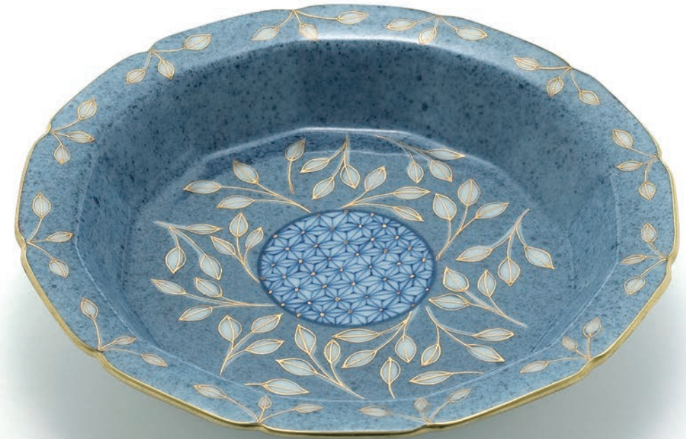
Blooming Plate 17.3×17.3×3.5cm