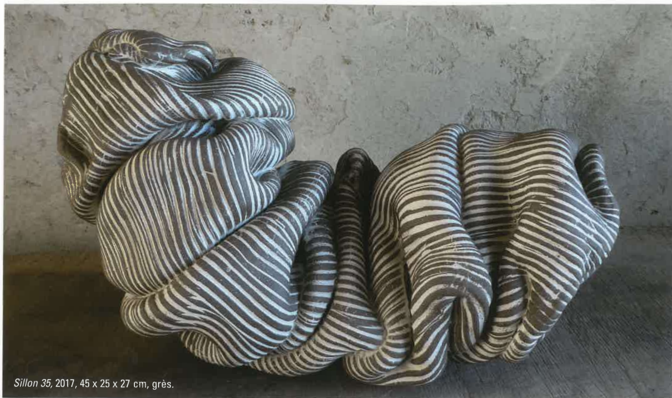
Sillon 35, 2017, 45 x 25 x 27 cm, grès.