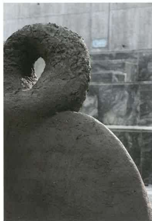
Série « Queule », 2017, terre (engobe blanc), dimensions variables.