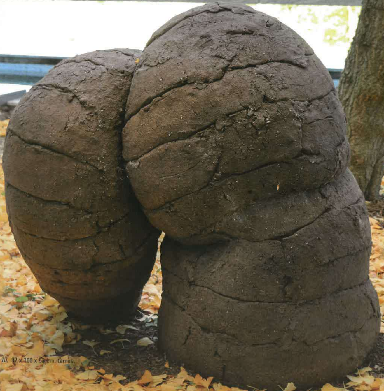
Queble 10, 97 x 100 x 52 cm, terres.