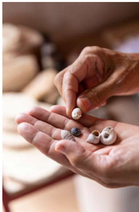
“Deze bij de baai gevonden schelpjes waren het uitgangspunt voor mijn keramische schelpen.”