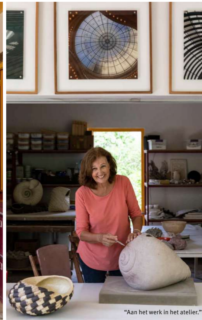
“Aan het werk in het atelier.”