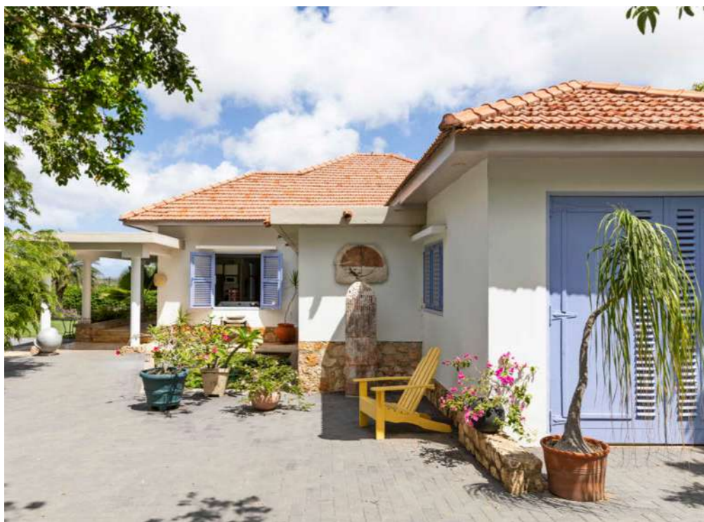
“Tegen de muur staat mijn favoriete kunstwerk, een keramisch sculptuur van Ciro Abath. Linksachter zie je een aluminium bal van Dries Kreijkamp.”