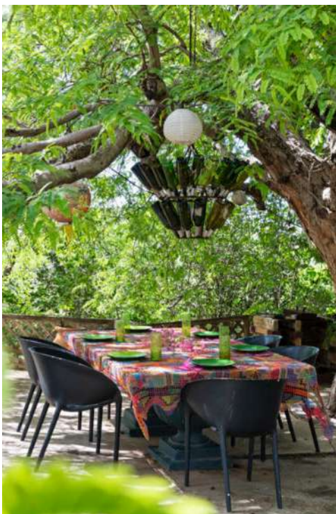
“Mijn favoriete plek: de ‘eetkamer’ onder de tamarinde boom.”