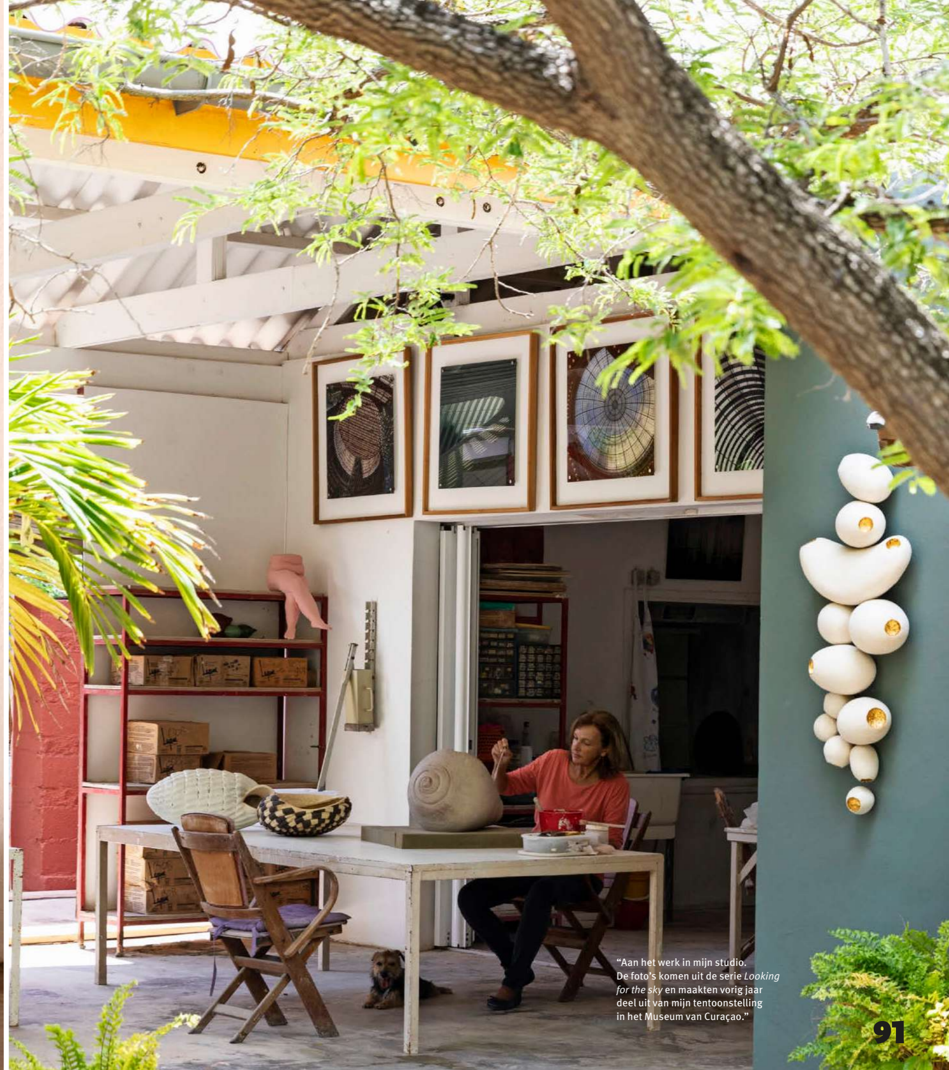
"Aan het werk in mijn studio. De foto's komen uit de serie Looking for the sky en maakten vorig jaar deel uit van mijn tentoonstelling in het Museum van Curaçao."