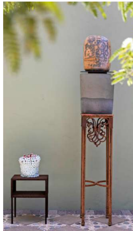
“Het porseleinen stuk links maakte ik tijdens mijn artist residency in China in 2016. Rechts een werk uit 1997.”