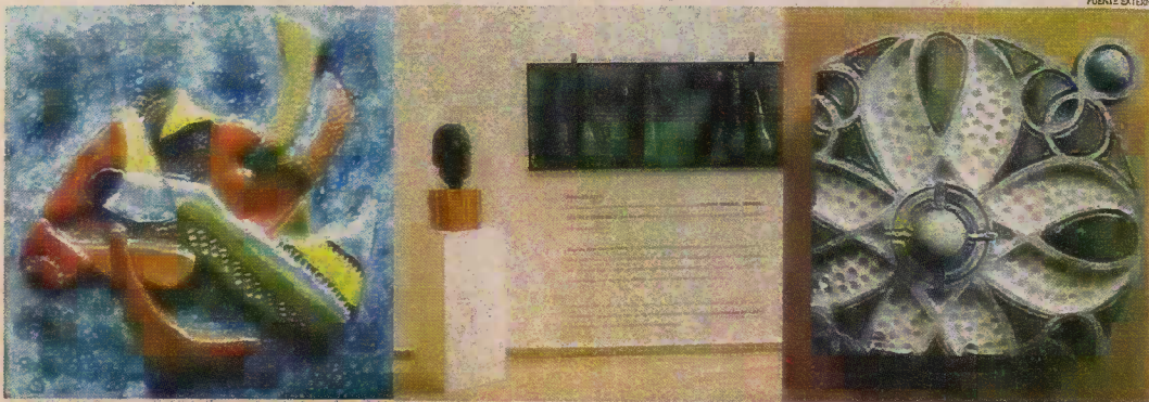
El evento se dedica ahora al maestro dominicano Aquiles Azar, y el artista homenajeadó expone su "tile" (...con las inconfundibles botellas) en la sala cerrada.