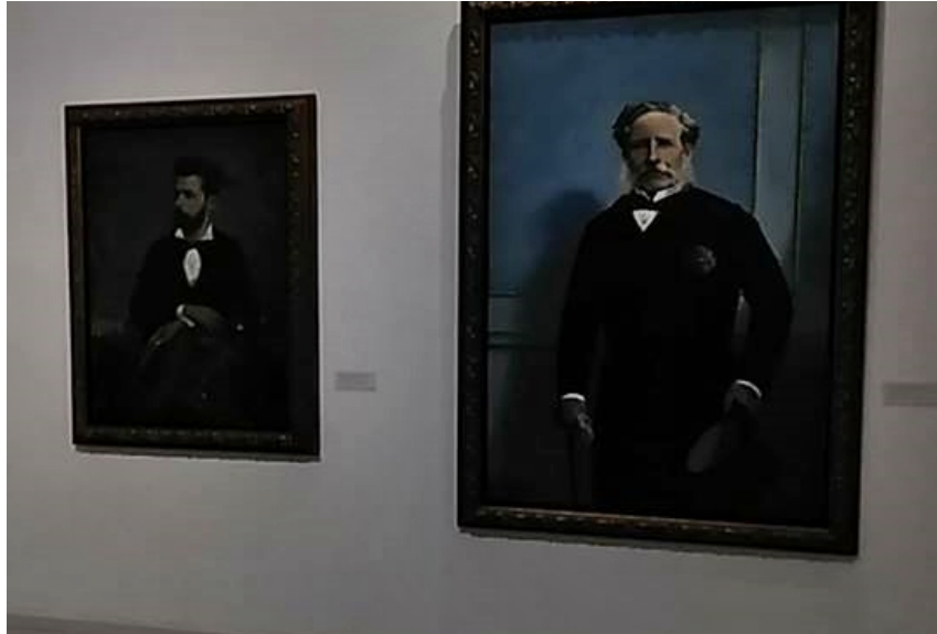
Obras originales de Francisco Oller