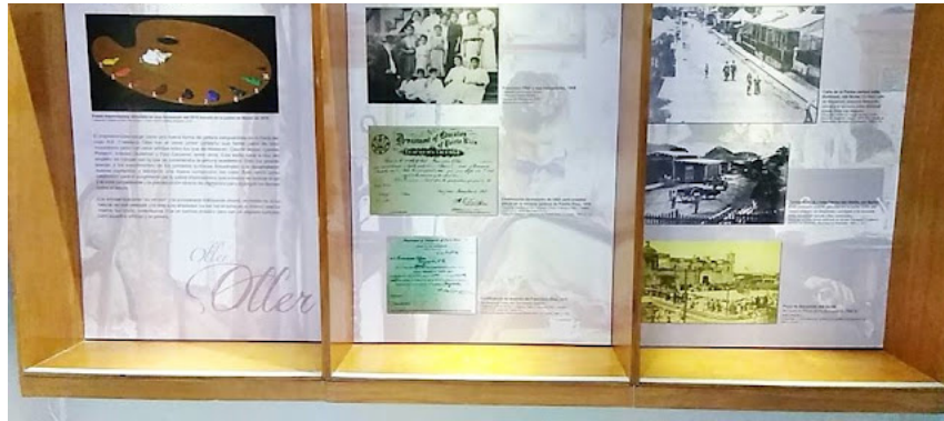
Despliegue educativo sobre la obra de Francisco Oller