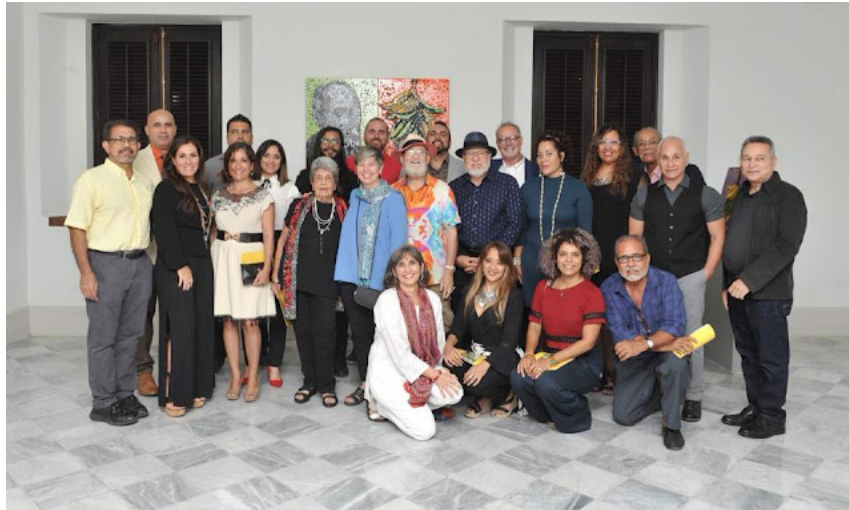
Artistas participantes de la exposición colectiva

Oller en el Oller: una mirada introspectiva del legado de Oller