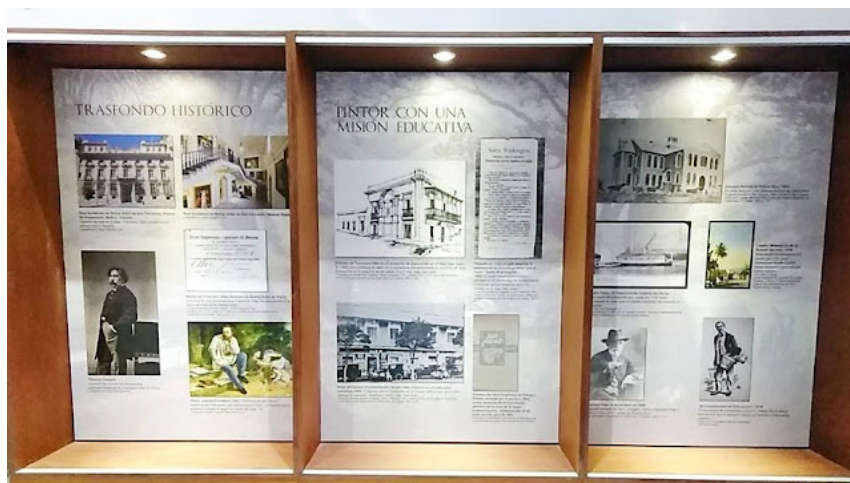
Despliegue educativo sobre la obra de Francisco Oller