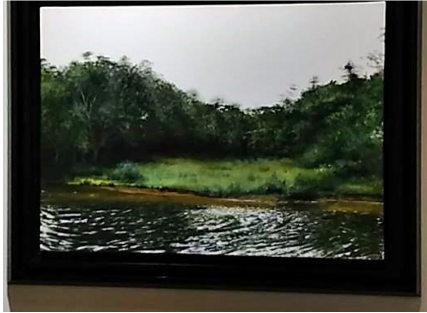
Obra "Treasure Island" de Antonio Cortés

Como es costumbre en este municipio, la actividad contó con música de fondo en vivo y una excelente picadera. La asistencia fue de más de un centenar de personas, número razonable pero más bien pobre si se toma en consideración el elevado número de artistas participantes, incluyendo algunos "grandes nombres". Es una pena que una actividad tan lúcida y culturalmente rica cuente con una pobre promoción y con tan poca valoración popular en comparación con otros eventos que se hacen pasar por "culturales", y realmente aportan poco o nada positivo a nuestra educación y cultura. Con tanta más razón hemos de apoyar iniciativas como ésta.