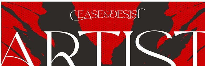
Convocatoria para la exposición colectiva Psiquis 2023