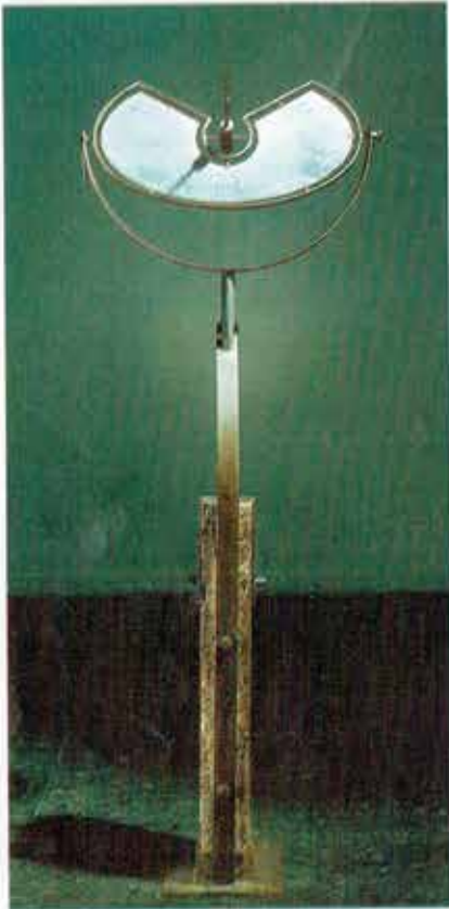
Gnomon relojes de sol (Eduardo Di Mauro)