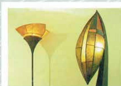
Micaela Perera, papel y metal