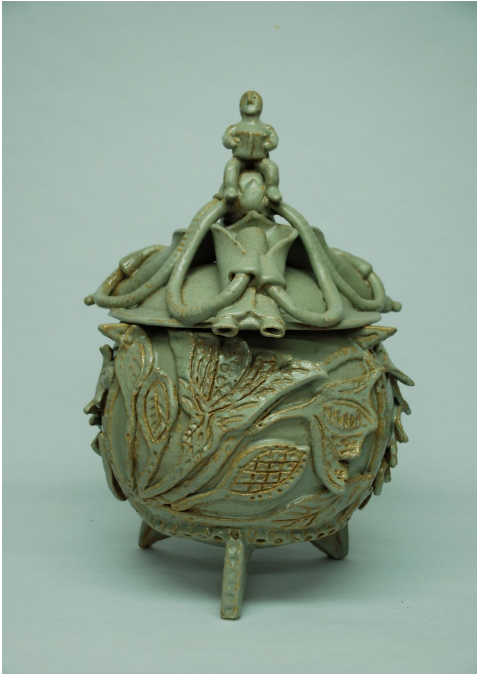
AUTOR: PEPE DEL CAMPO TITULO: CONTENEDOR DE SUEÑOS TECNICA: GRES ESMALTADO