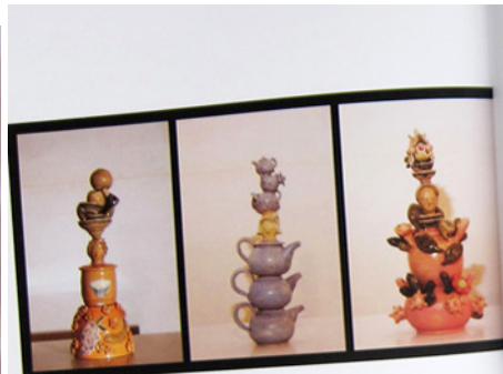
Pride (series) Boromah 3 x 4 x 40 cm 2012