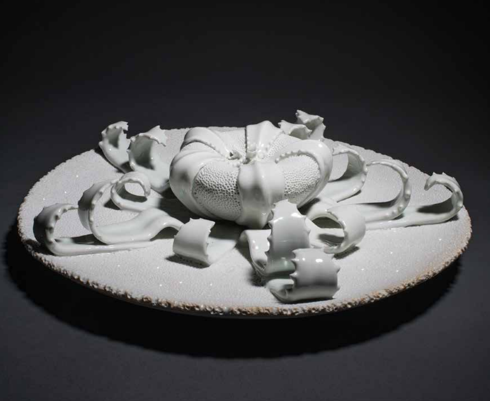
Plato de fondo II Porcelana, quema reductora. 36 x 36 x 7 cms.