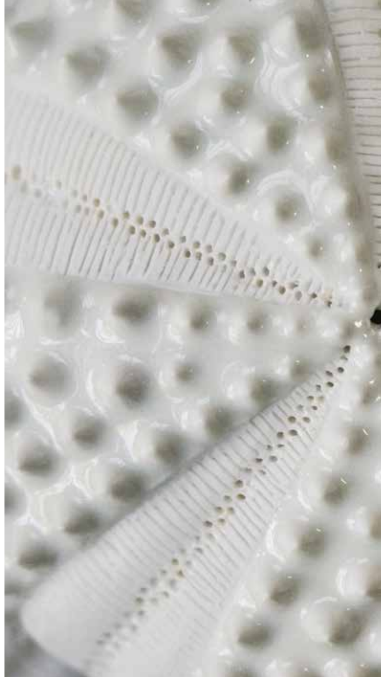
Plato de fondo I Porcelana, quema reductora 40 x 40 x 7 cm.