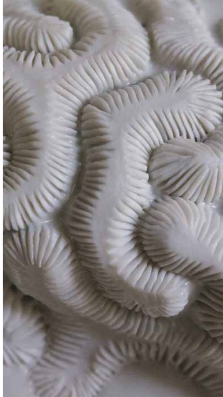
Plato de fondo III Porcelana, quema reductora 37 x 37 x 6 cm.