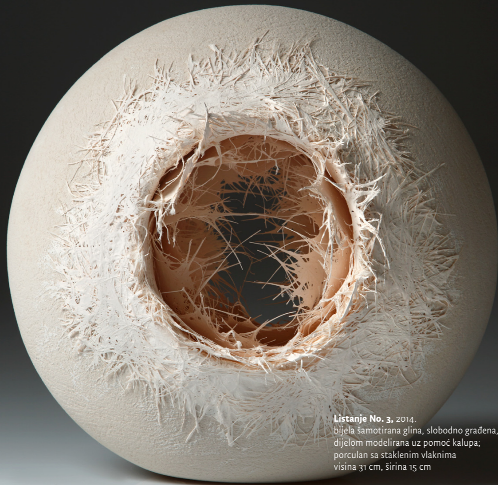
Listanje No. 3 , 2014. bijela šamotirana glina, slobodno građena, djelom modelirana uz pomoć kalupa; porculan sa staklenim vlaknima visina 31 cm, širina 15 cm