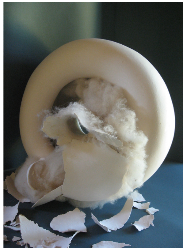
Izlazak iz oklopa, 2011. paperclay, slobodno građena forma, dijelom modelirana uz pomoć kalupa; sirova vuna, češljana visina 45 cm, promjer 45 cm u hrvatskoj privatnoj zbirci