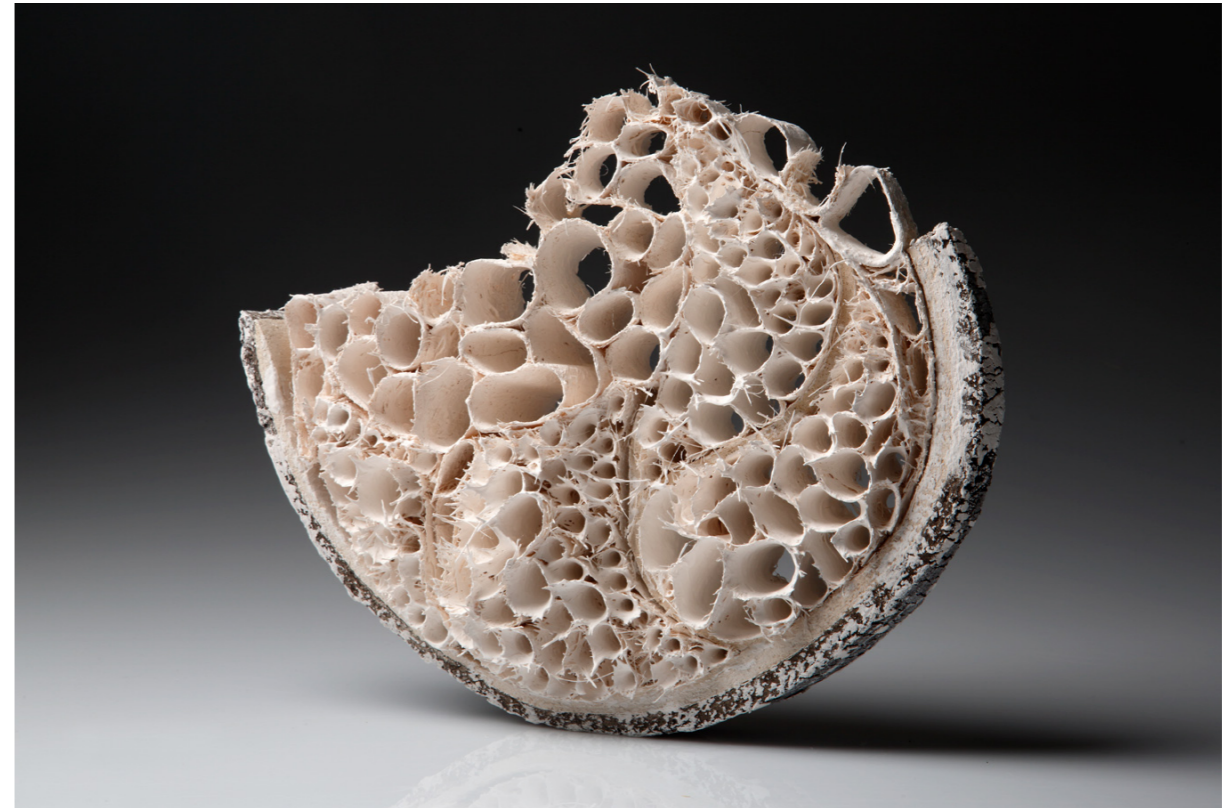
Rastvaranje bjelina – No. 6 , 2012. bijela šamotirana glina, slobodno građena, dijelom modelirana uz pomoć kalupa; sirova vuna, češljana visina 35 cm, širina 30 cm