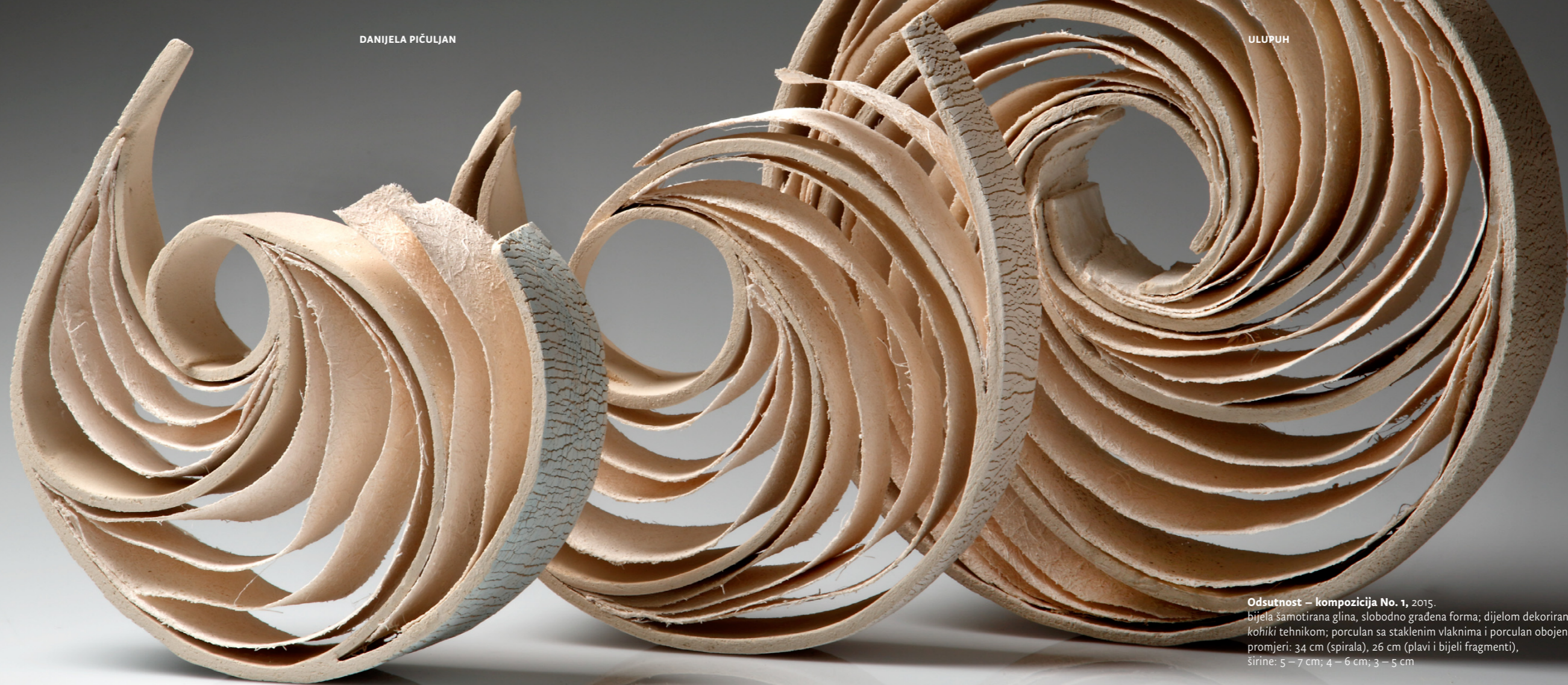
Odsutnost – kompozicija No. 1 , 2015. bijela šamotirana glina, slobodno građena forma; dijelom dekorirano kohiki tehnikom; porculan sa staklenim vlaknima i porculan obojen oksidom promjeri: 34 cm (spirala), 26 cm (plavi i bijeli fragmenti), širine: 5 – 7 cm; 4 – 6 cm; 3 – 5 cm