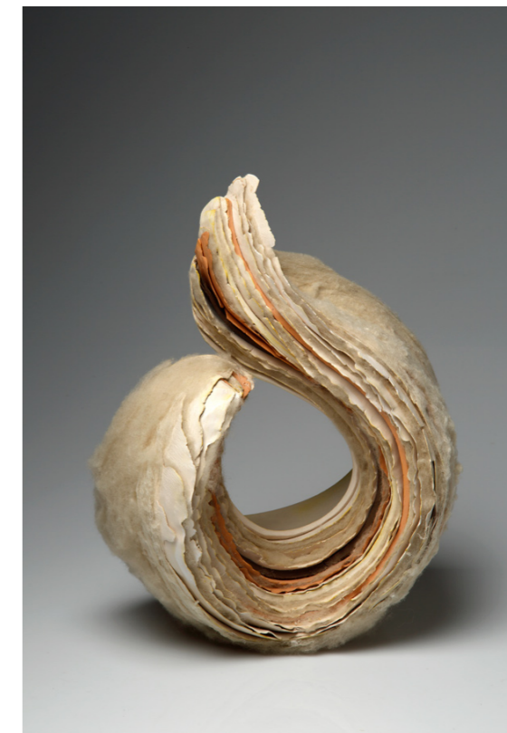
Izlazak iz oklopa, 2011. paperclay, slobodno građena forma, dijelom modelirana uz pomoć kalupa; sirova vuna, češljana visina 45 cm, promjer 45 cm u hrvatskoj privatnoj zbirci