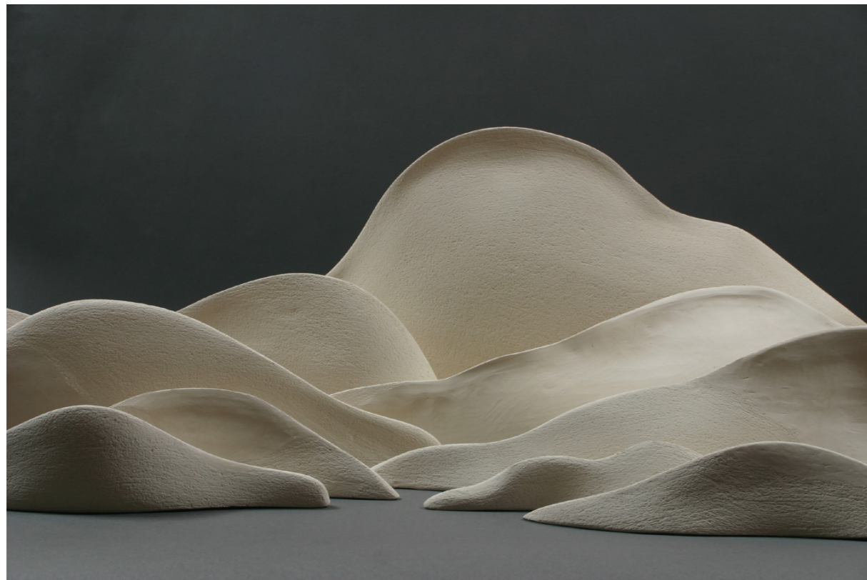
Heimat , 2006. bijela šamotirana glina, slobodno građena – kompozicija od 9 elemenata visina 45 cm, duljina 30 – 70 cm u vlasništvu Gradskoga muzeja u Erfurtu, Njemačka