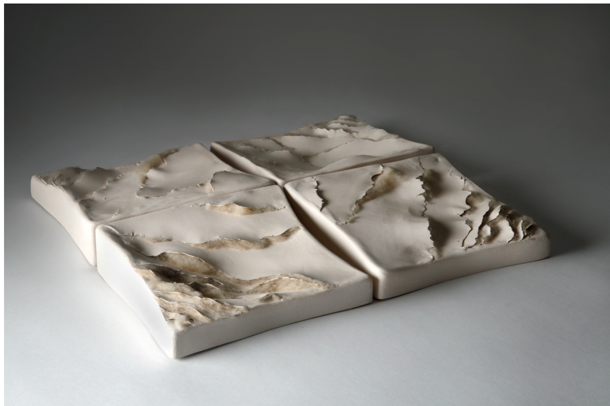
Rastvaranje bjelina – No. 6, 2011. bijela šamotirana glina, slobodno građena, dijelom modelirana uz pomoć kalupa; sirova vuna, češljana visina 35 cm, širina 30 cm