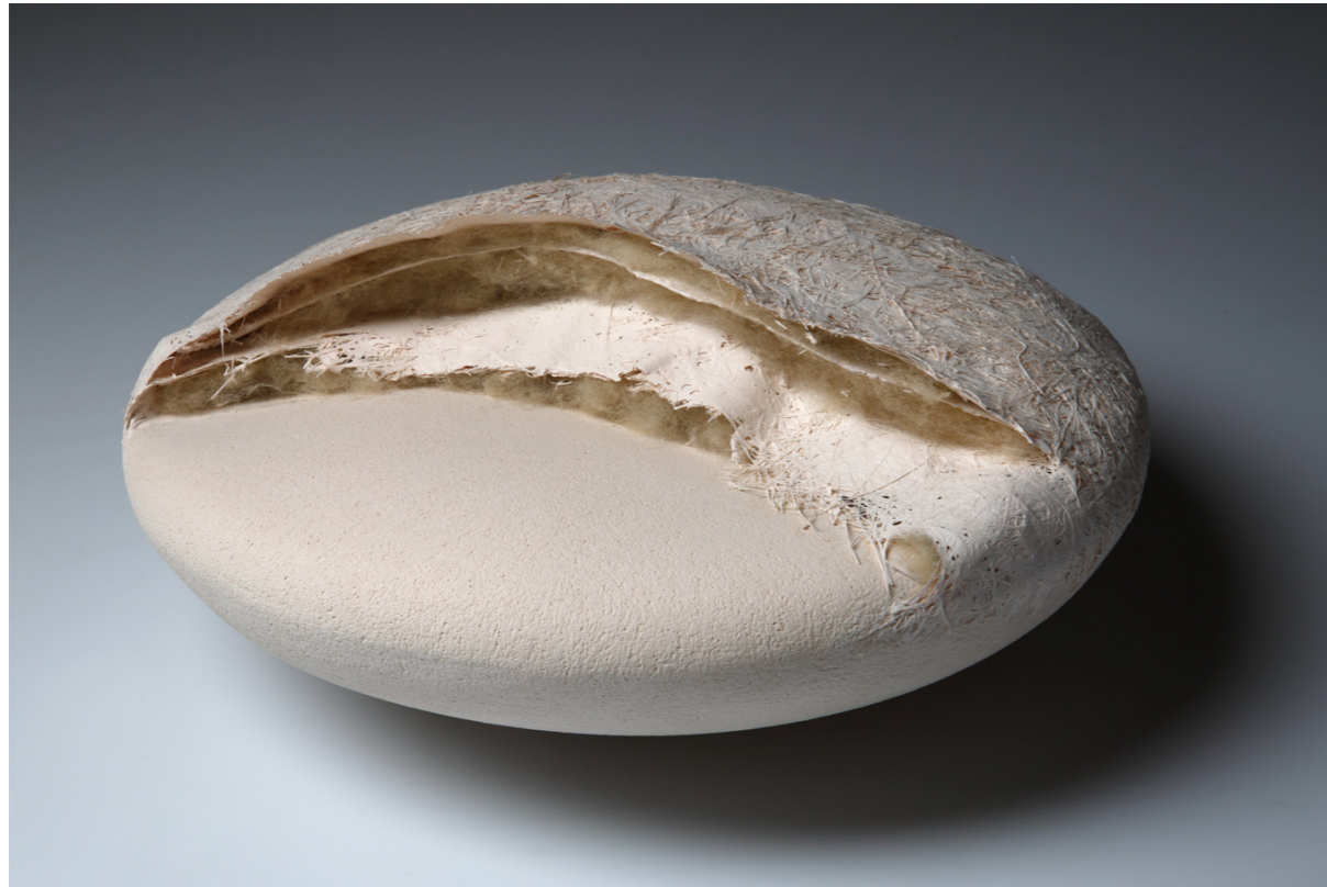
Listanje No. 5 , 2014. bijela šamotirana glina, slobodno građena, dijelom modelirana uz pomoć kalupa; porculan sa staklenim vlaknima visina 17 cm, promjer 35 cm