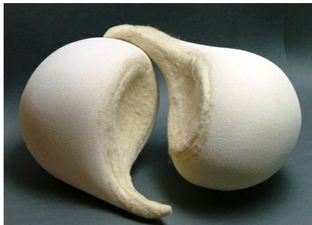
Kukuljice, 2009. bijela šamotirana glina, slobodno građena, dijelom modelirana uz pomoć kalupa; sirova vuna, filcana visina elemenata 30 – 60 cm