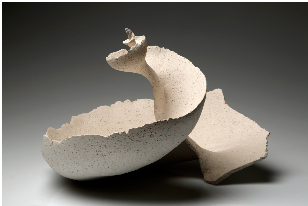
Heimat , 2006. bijela šamotirana glina, slobodno građena – kompozicija od 9 elemenata visina 45 cm, duljina 30 – 70 cm u vlasništvu Gradskoga muzeja u Erfurtu, Njemačka