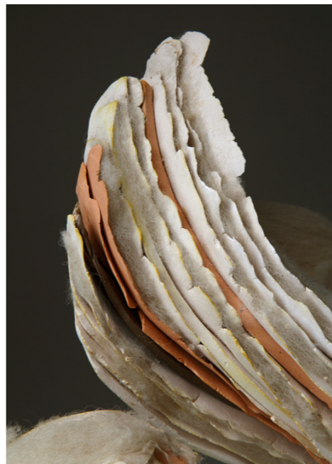
Izlazak iz oklopa, 2011. detalj