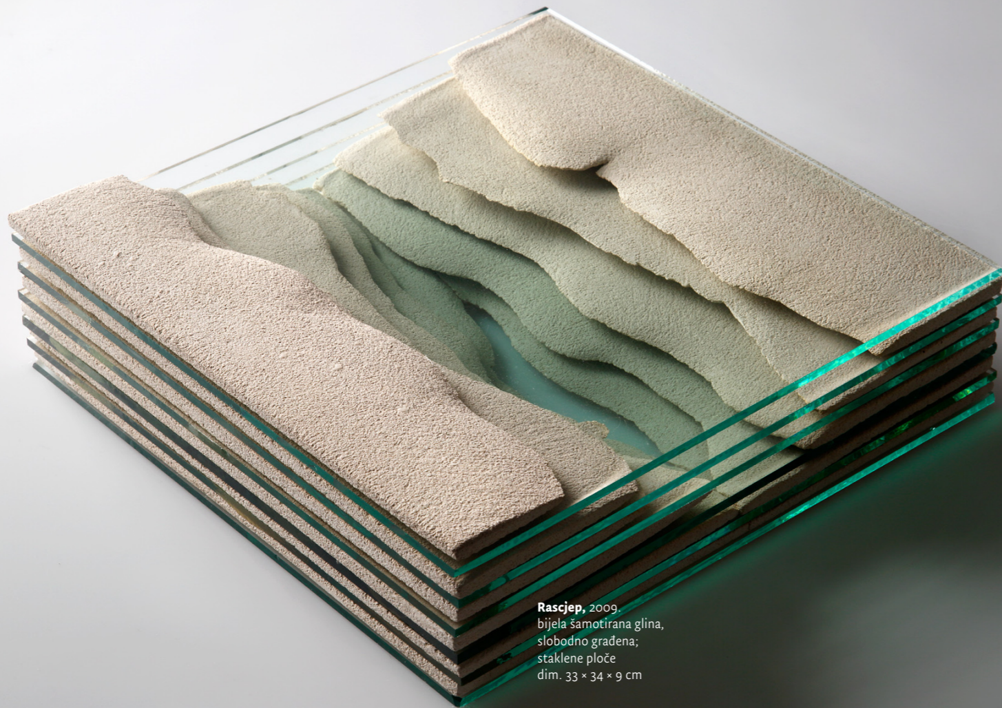
Rascjep , 2009. bijela šamotirana glina, slobodno građena; staklene ploče dim. 33 × 34 × 9 cm