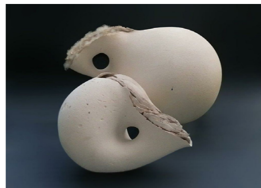
Listanje No. 1 i No. 2, 2014. bijela šamotirana glina, slobodno građena, dijelom modelirana uz pomoć kalupa; sirova vuna, češljana visine 34 i 30 cm, duljine 54 i 40 cm, širine 32 i 25 cm