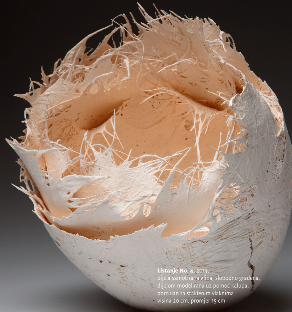
Listanje No. 4 , 2014. bijela šamotirana glina, slobodno građena, djelom modelirana uz pomoć kalupa; porculan sa staklenim vlaknima visina 20 cm, promjer 15 cm