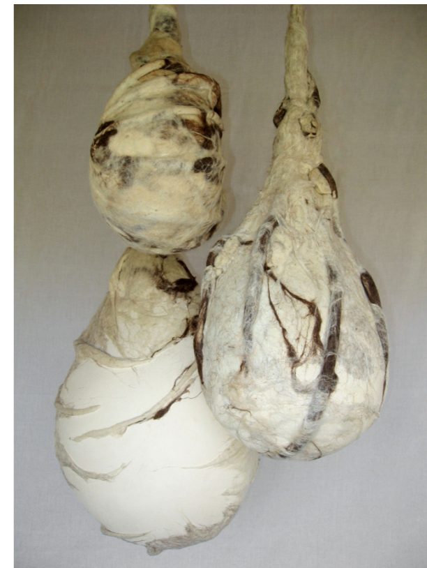
Kukuljice , 2009. bijela šamotirana glina, slobodno građena, djelom modelirana uz pomoć kalupa; sirova vuna, filcana visina elemenata 30 – 60 cm