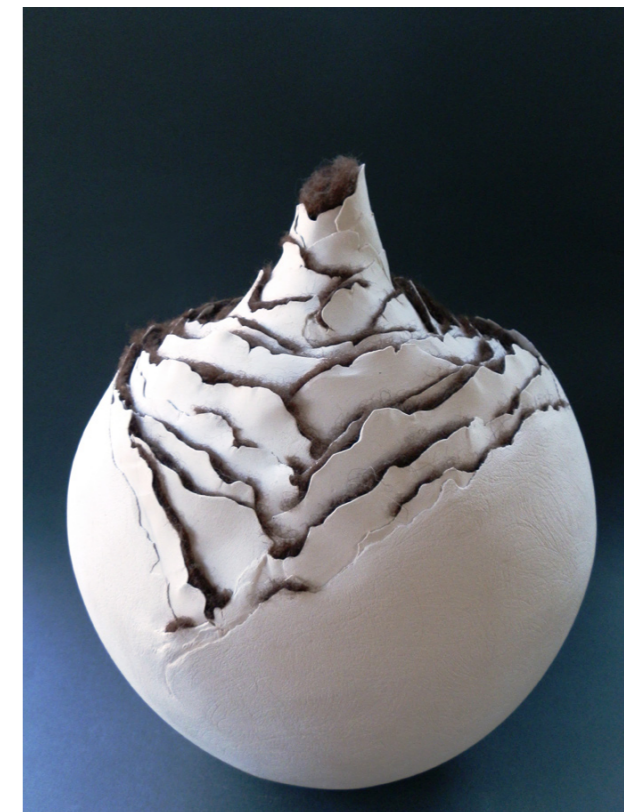
Rastvaranje bjelina – No. 6, 2012. bijela šamotirana glina, slobodno građena, dijelom modelirana uz pomoć kalupa; sirova vuna, češljana visina 35 cm, širina 30 cm