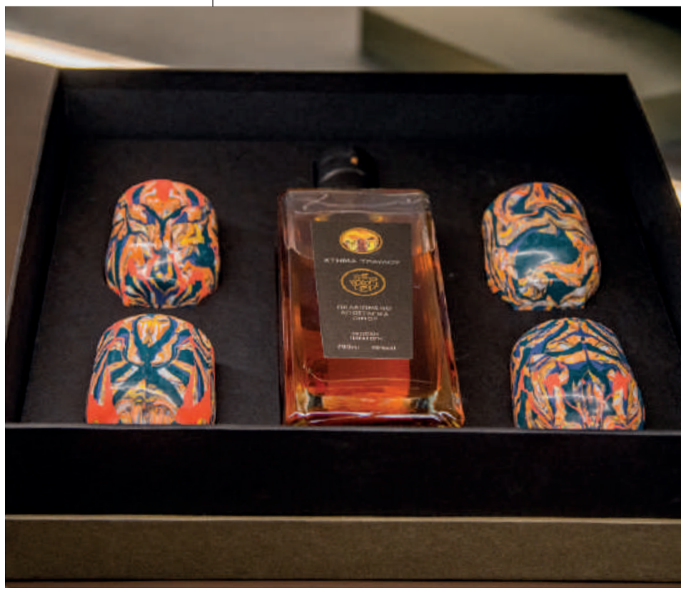
● Σετ δώρου τεσσάρων πορσελάνινων ποτηριών με ένα μπουκάλι ποτού από το κτίσμα της οικογένειας.