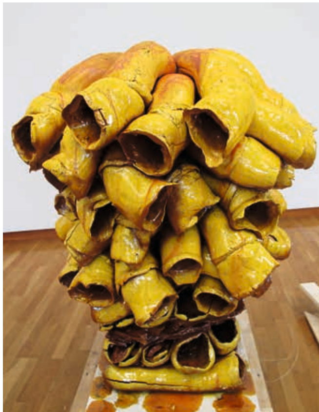
Rørsulptur, gul, 2013. Terracotta leire, ekstruderte rørelementer, modellert sammen til en stakk. Hvit begitning, gul transparent rennende glasur, ovnsplate. Brent i vedfyrt ovn til 800 grader. H 140 x D 100 cm. Denne skulpturen vant «the Grand Prize» ved Gyeonggi International Ceramic Biennale 2017, Korea.