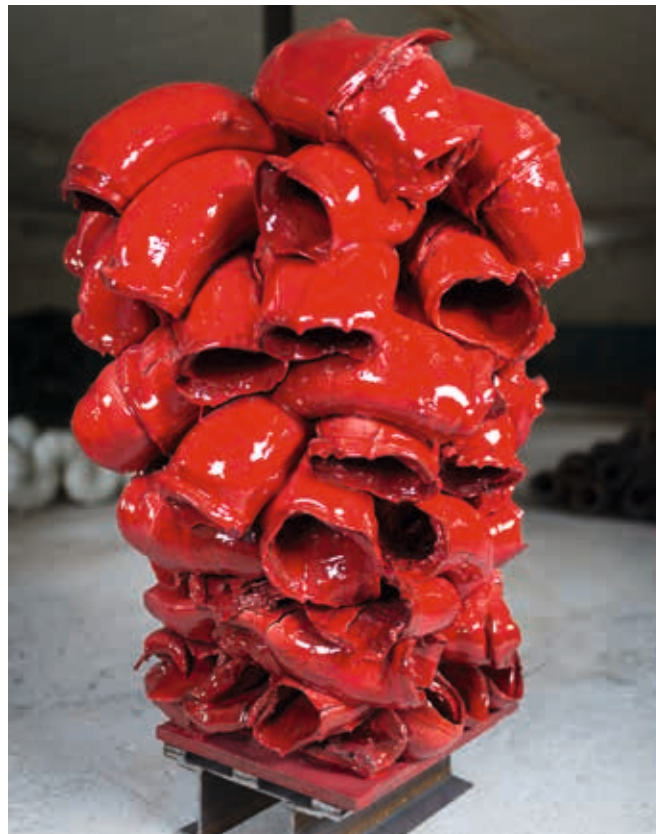
Rørskulptur, rød, 2013. Terracotta leire, ekstruderte rørelementer, modellert sammen til en stakk. Hvit begitning, blybisilikatfritte-basert transparent glasur, med rød stans, ovnsplate, brent i vedfyrt ovn til 1050 grader. H 120 x D 90 cm.

Ceramics Ringeby, 1993. International Workshop. Peter Voulkos, USA, and his working partner Peter Callas, USA.