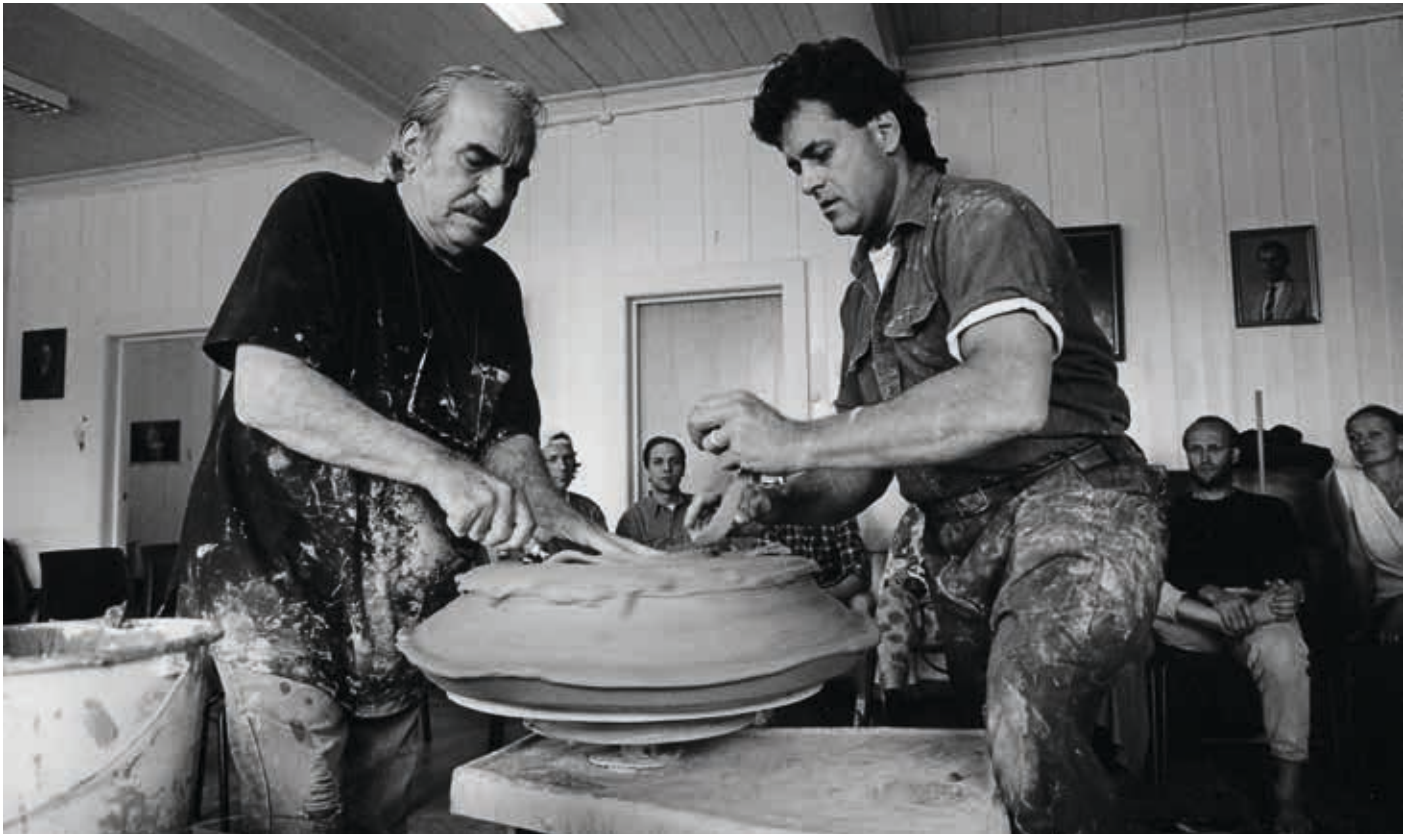
Keramikk Ringeby 1993, Ringeby Folkehøgskule.

Ceramics Ringeby, 1993. International Workshop. Peter Voulkos, USA, and his working partner Peter Callas, USA. Photo: Morten Løberg.