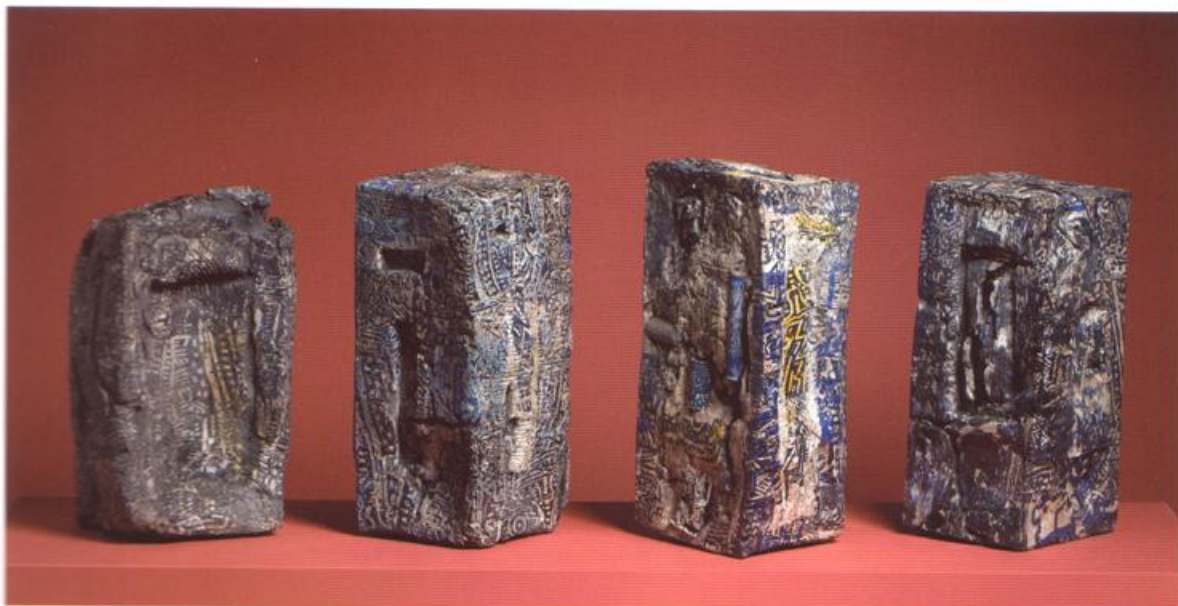
BLOQUES. 2011. 80 x 90 x 90 cm.

Destacan en la muestra la serie "Bloques", donde se incluyen cuatro piezas como seña de identidad en la creación escultórica de este artista. Éste grupo de esculturas de suelo con formas rectangulares autónomas, traducen de igual manera un modelo de concepción característico de toda su obra: Aquello que se basa en la transposición de parcelas modulares de espacios arquitectónicos. Se trata de una evidencia reforzada por las texturas y marcas con incrustaciones de elementos de alúmina y esmaltes vitrificables que se encuentran en la superficie. Además de estos trabajos, presenta las piezas "Salinas" o la instalación "tiempo muerto" que corresponden a una seriación de pared, donde la estructura evoca elementos iberos y añoranzas primitivistas.