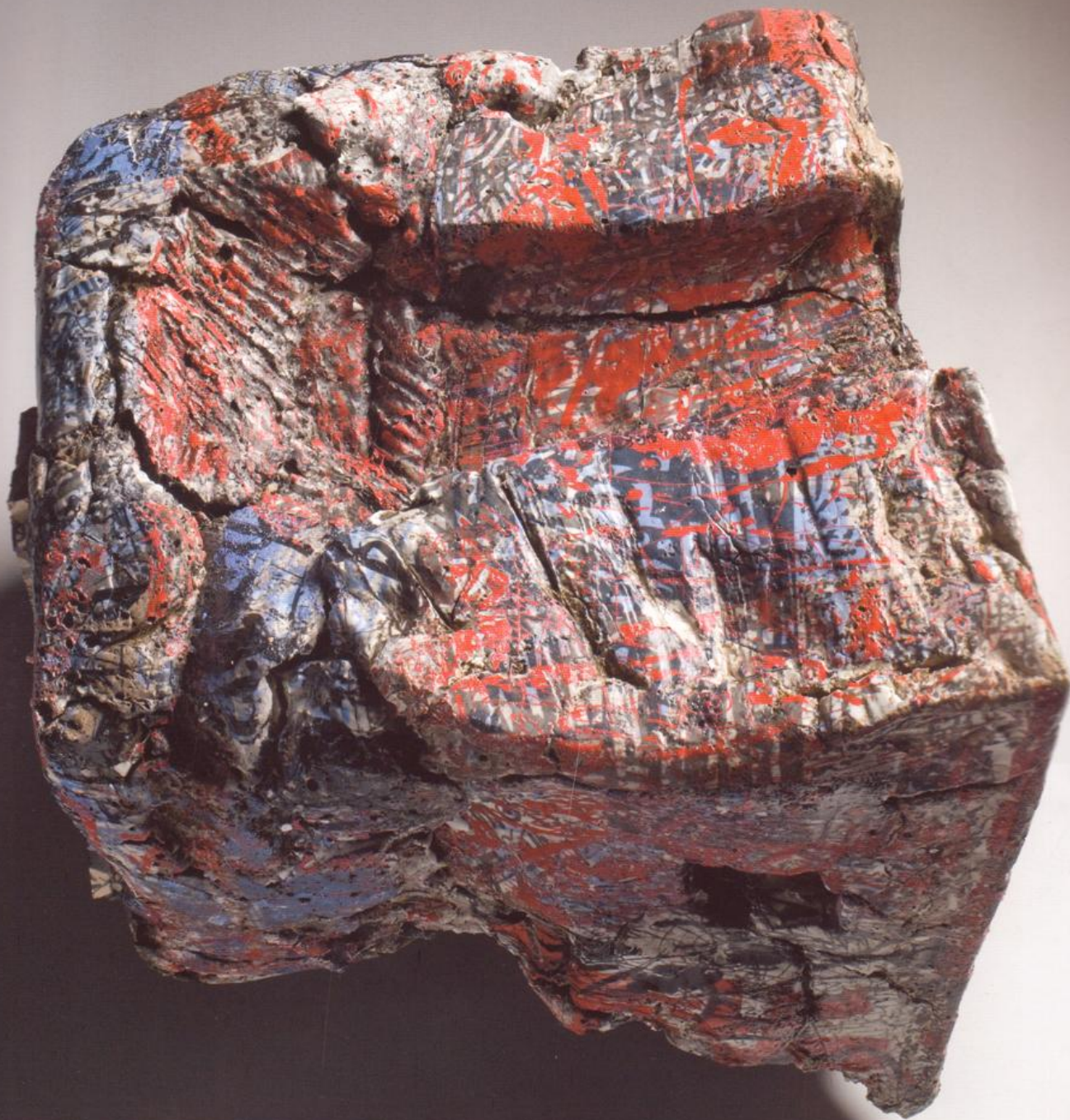
ESCULTURA. N004-12. 2011. 40 x 50 x 40 cm.