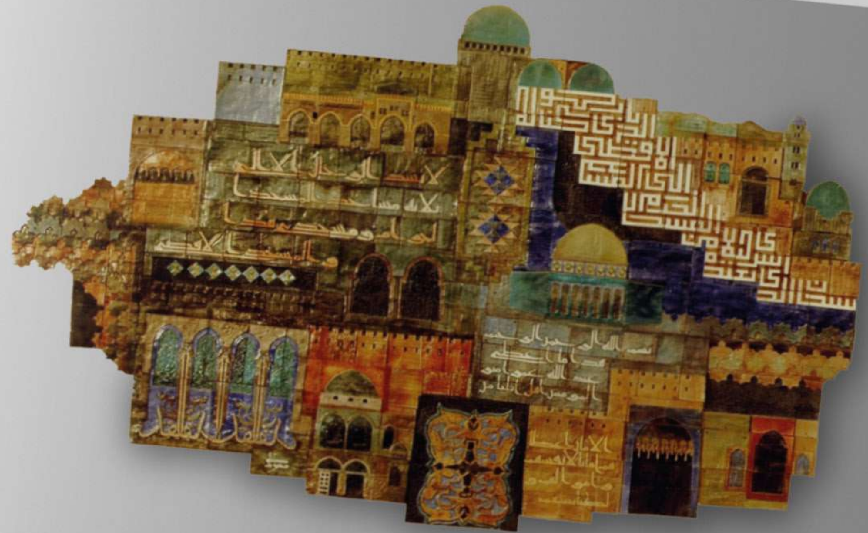
DOCUMENTED BY HIS SON 1995 200 X 250 cm