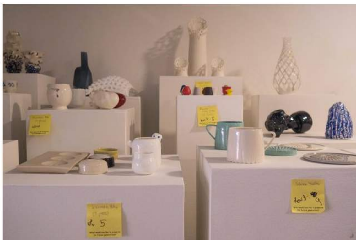
Works being placed before the opening of the exhibition at Millennium Court Arts Centre.

The Ceramics and its Dimensions: Shaping the Future exhibition has travelled to its third venue in Millennium Court Arts Centre in Portadown, Northern Ireland. This time the core of the exhibition is joined by the works of the Future Lights competition winners of years 2015/2016 and 2016/2017.