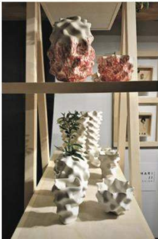
Porcelanowe wazy i misy wystawiane podczas targów WantedDesign