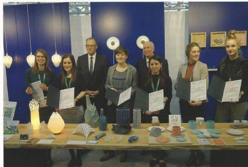
1 Future Lights 2017 at Ambiente Fair

Organiser Porzellanikon – Staatliches Museum für Porzellan, Hohenberg a. d. Eger / Selb Co-Organisers British Ceramics Biennial (BCB) team, Stoke-on-Trent Design & Crafts Council of Ireland, Kilkenny Staffordshire University, Stoke-on-Trent