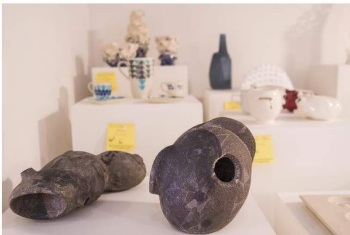
Works being placed before the opening of the exhibition at Millennium Court Arts Centre.