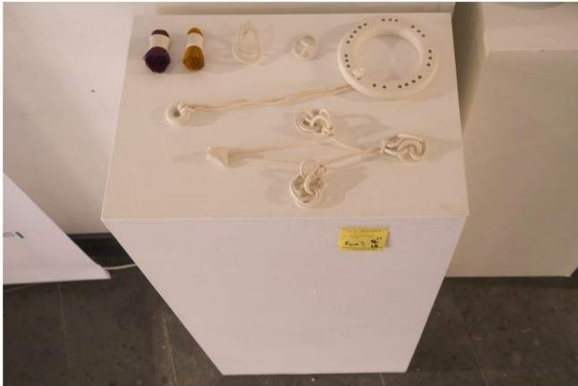
Works being placed before the opening of the exhibition at Millennium Court Arts Centre.