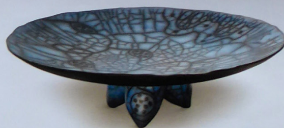
Billabong, de Jean-Marc Plantier. ●●●