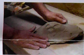
JEAN-MARC PLANTIER

par les céramistes français Yves Gaget et Jean-Marc Plantier Vendredi 6 nov. de 14h30 à 17h