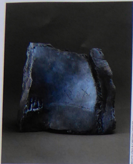
BRIGITTE LONG

Lieu vivant de découverte des métiers d'art, l'Atelier vous invite à de captivantes démonstrations de savoir-faire. Des moments privilégiés à partager avec les artistes, au plus près de la création. Entrée libre sur inscription en envoyant un mail à viaduc@ateliersdart.com