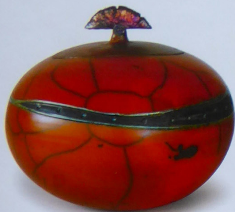
Ci-contre : les pièces de Jane Annois en attente de cuisson. ●●● Ci-dessus, l'une des pièces après la cuisson raku. ●●●