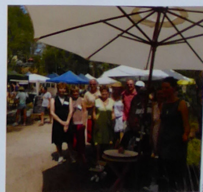
Vue des stands de Pottery Expo à Warrandyte, et portrait de groupe des céramistes français et australiens. ●●●