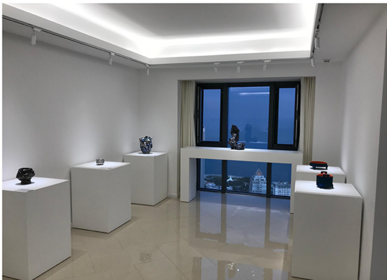
盛画廊 2019 “新器象”陶瓷艺术展 第二回 WARE & WEATHER No,2 2019 in SHENG GALLERY