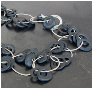
Ulmer + Grau (argent + porcelaine)