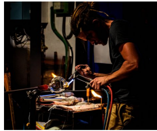
Atelier TiPii (verre)