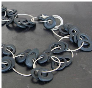
Ulmer + Grau (argent +porcelaine)