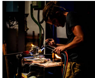
Atelier TiPii (verre)