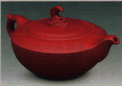
范泽锋作品“明月清风壶”