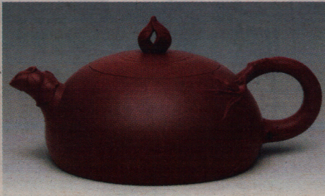
范泽锋作品“荆溪十景之阳羨茶泉”