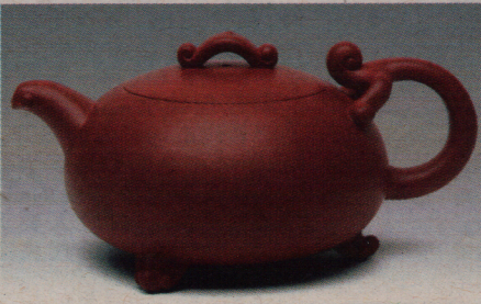
范泽锋作品“荆溪十景之画溪花浪”