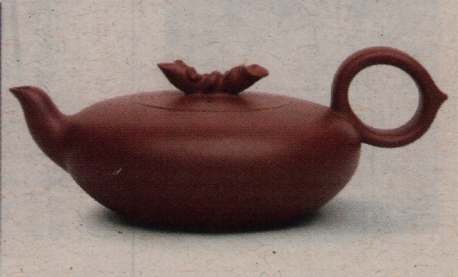
范泽锋作品“团结壶”