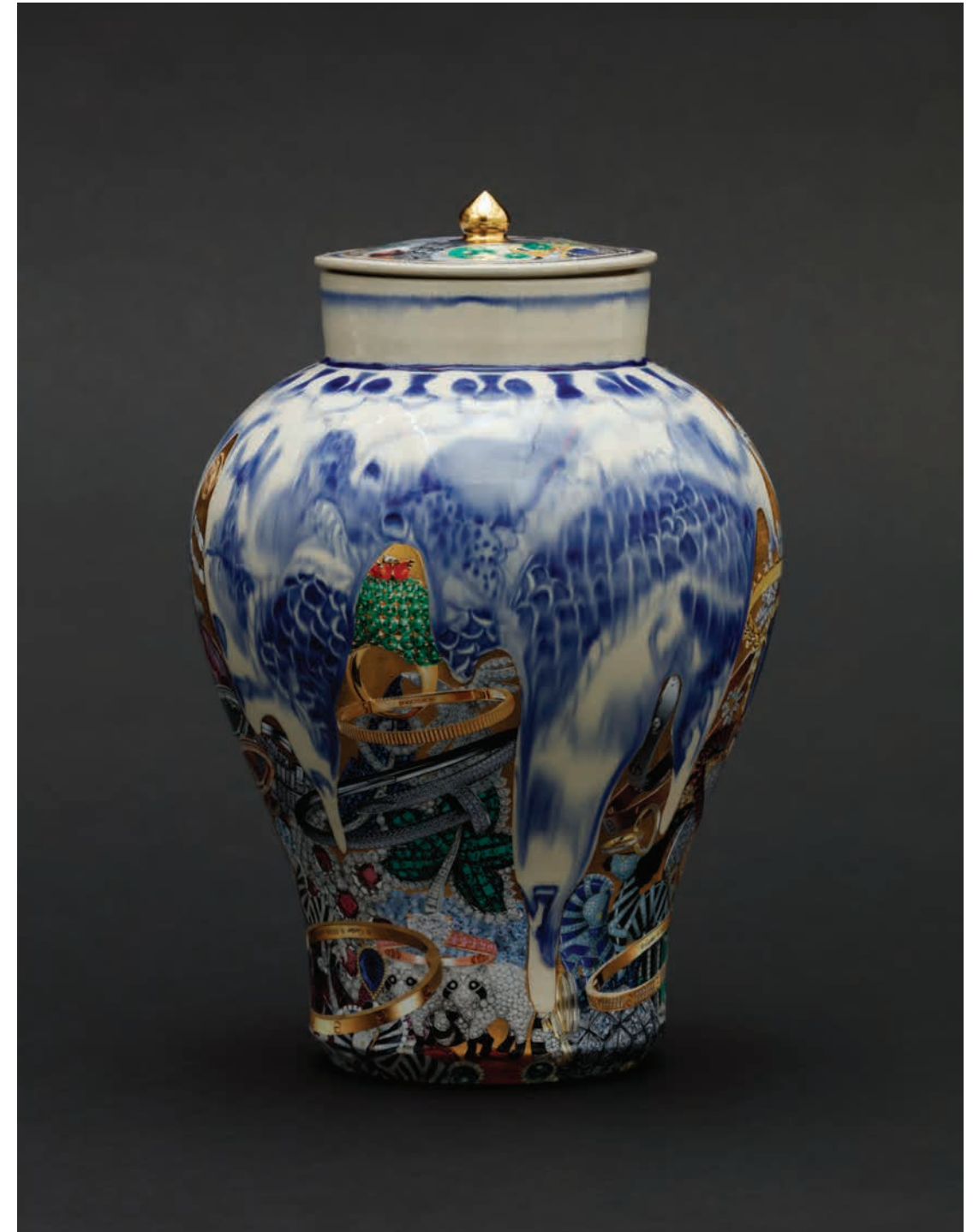
2018 | 백자 위에 금, 유약, 사진콜라주 | Ø23x31(h)cm Gold painting on blue and white porcelain, glaze, photo collage