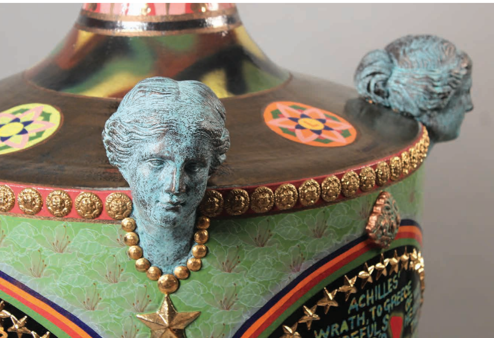
Anachronism | 2012 | Ceramic, decalcomania, gold luster | 79x79x165cm