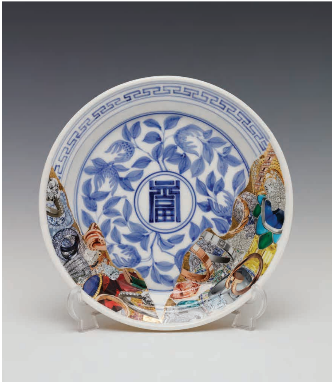
청화 복과 불수문+보석 접시 Blue Bok& Bulsugam+Gem Dishes

2018 | 백자 위에 금, 유약, 사진폴라주 | 21,5x21,5x3,5cm Gold painting on blue and white porcelain, glaze, photo collage