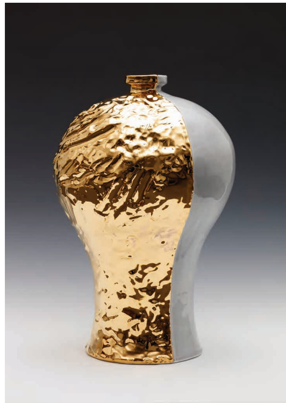
2018 | 백자 위에 금, 유약 | Ø31x48cm | Ianuaris 2018 Gold painting on porcelain, glaze | (Gold Gray)