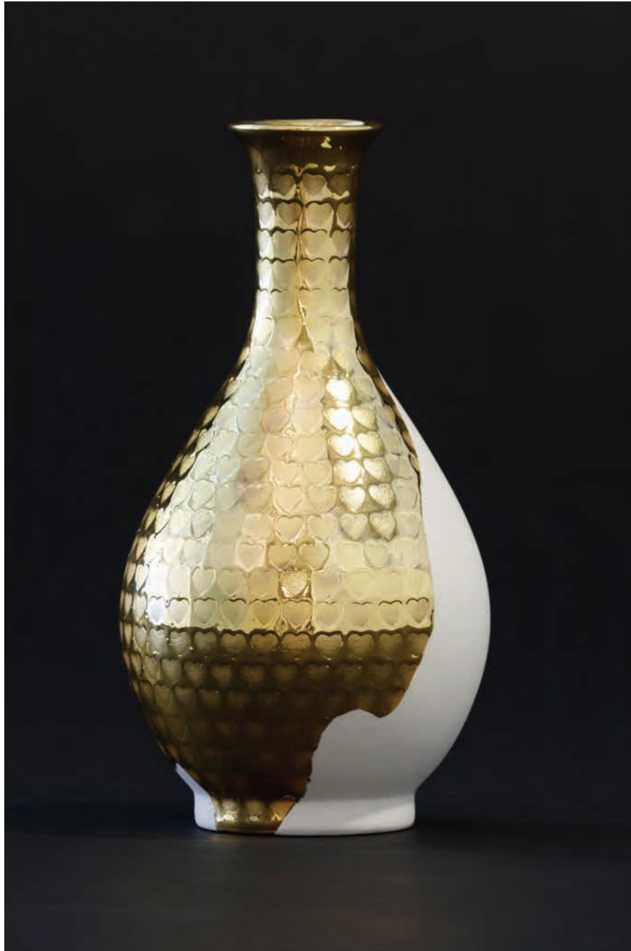
Imagery & Figuration B7 (Heart & Gold) | 2016 | 백자 위에 금, 유약 | Ø11,5x21,5(h)cm Gold painting on porcelain, glaze