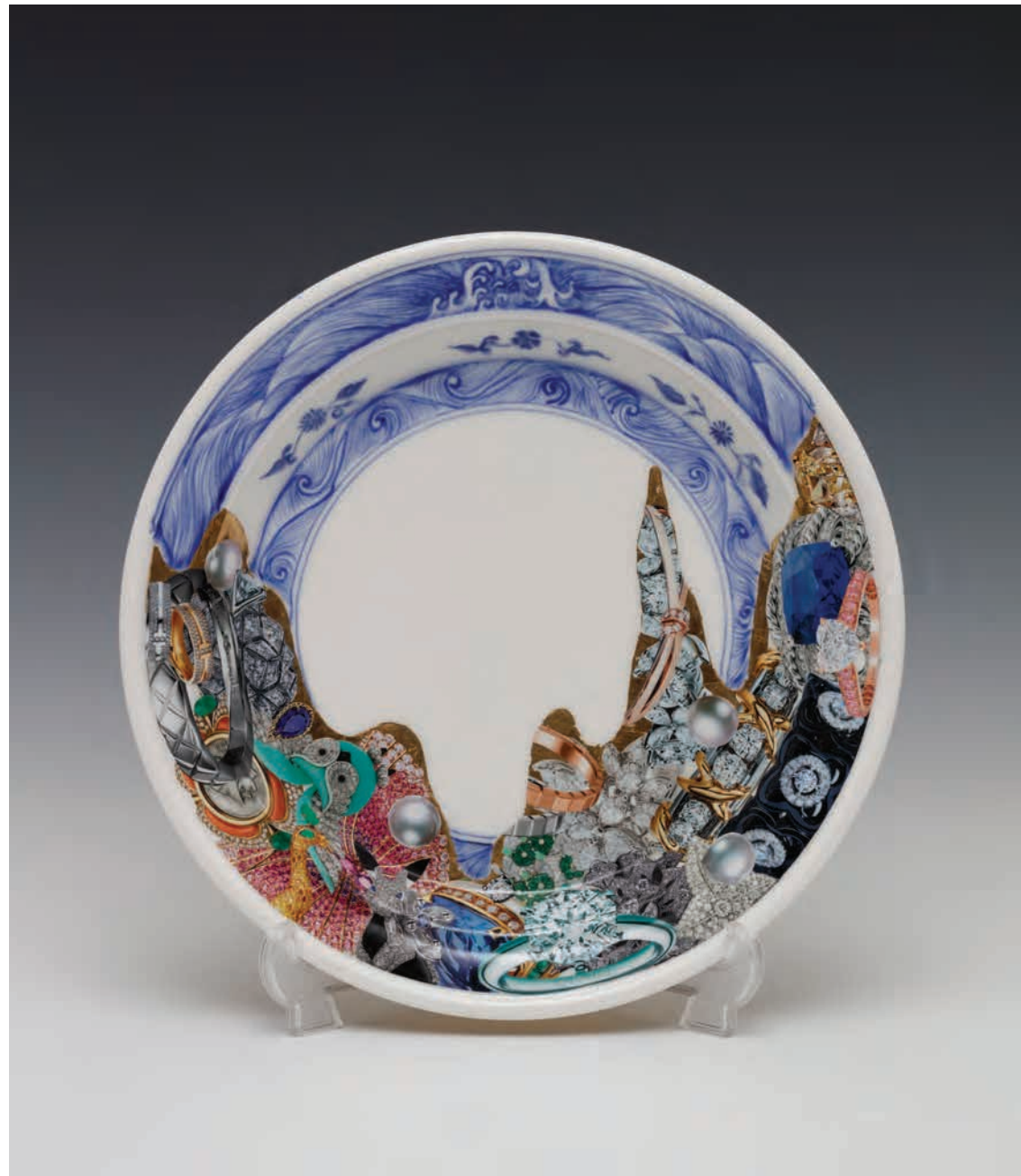
2018 | 백자 위에 금, 유약, 사진폴라주 | 26,5x26,5x3,5cm Gold painting on blue and white porcelain, glaze, photo collage

2018 | 백자 위에 금, 유약, 사진폴라주 | 21,5x21,5x3,5cm Gold painting on blue and white porcelain, glaze, photo collage