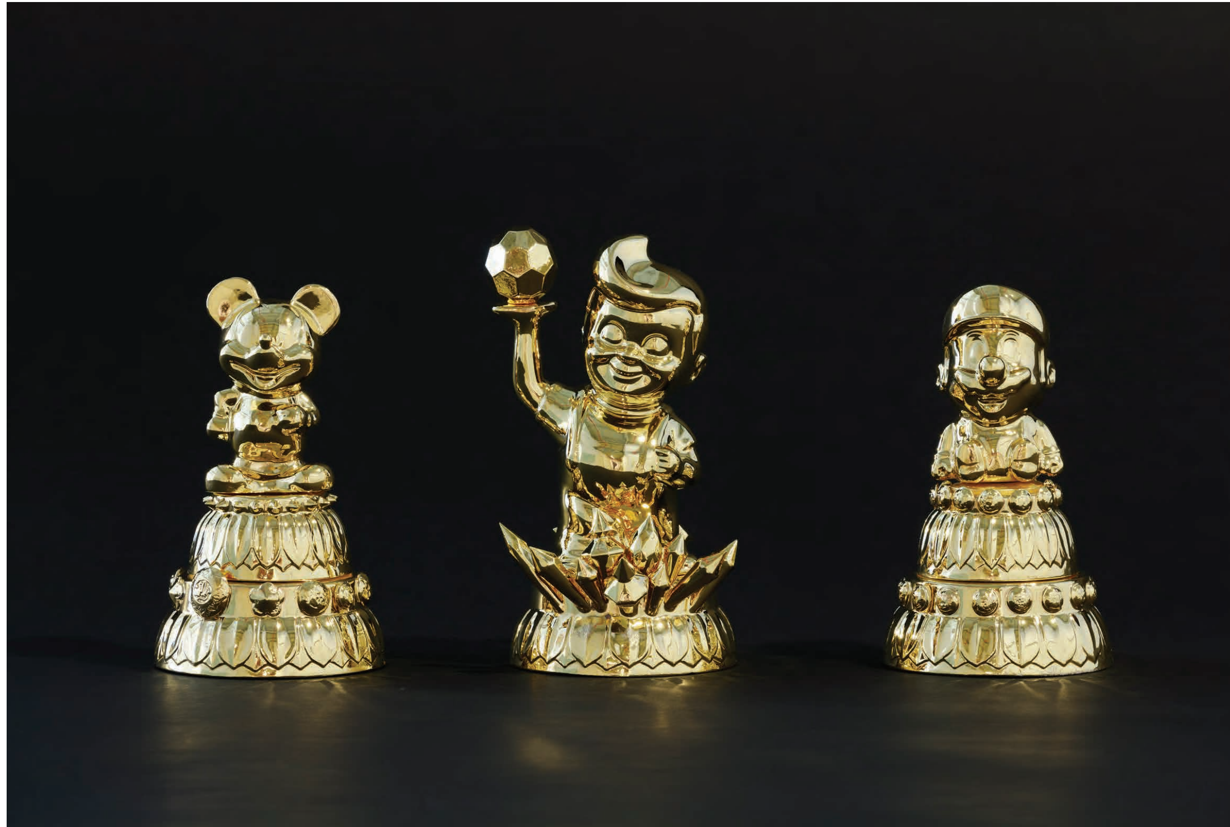
Treasure (Golden Mickey/Boy/Mario)

2018 ' 백자 위에 금, 유약 ' 왼쪽부터 각 Ø17x25(h)cm, Ø17x27(h)cm, Ø17x21(h)cm Gold painting on porcelain, glaze