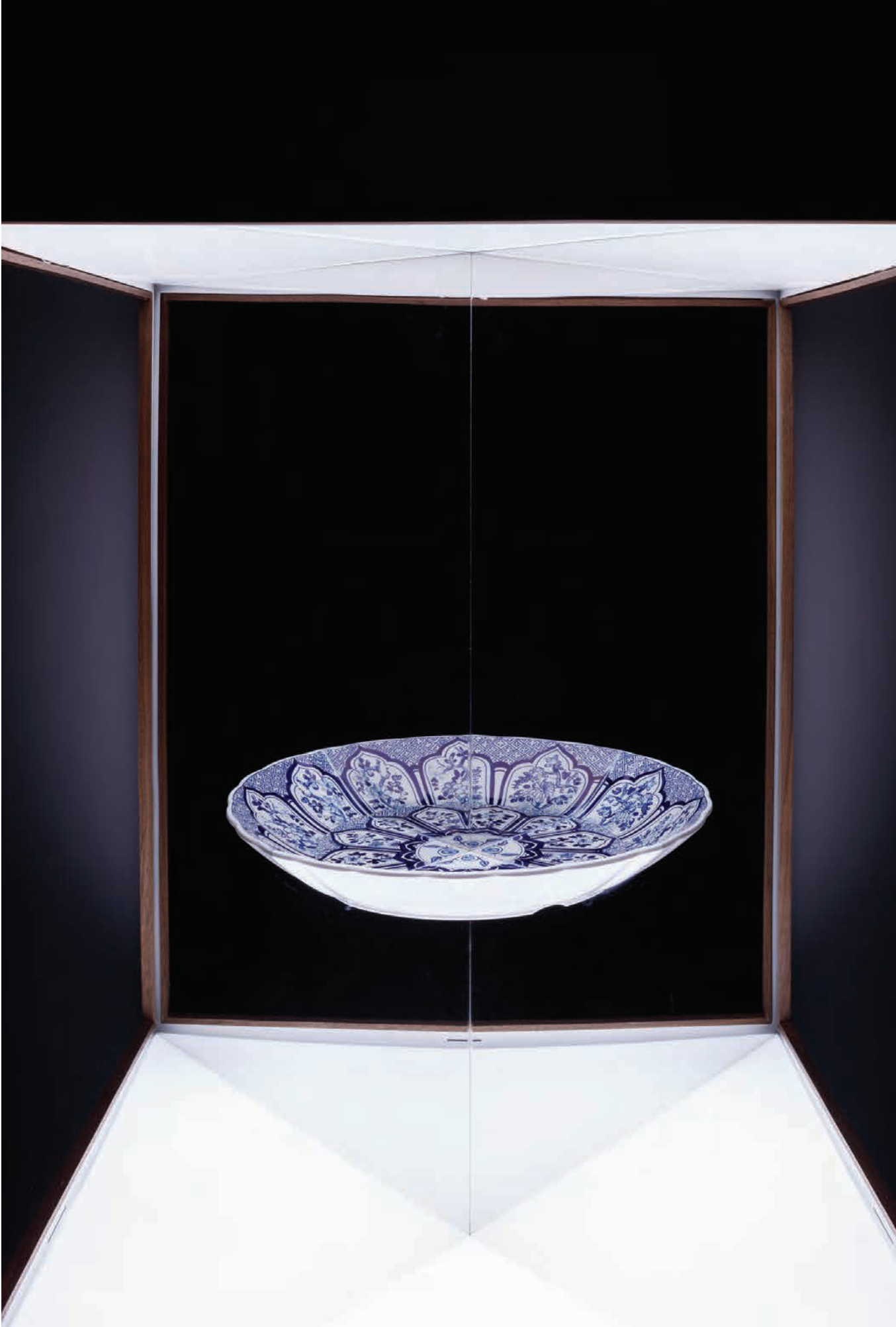
부유하는 풍경 #No.1 Floating Landscape #No.1 | 2018 | 혼합매체 | 80x120x40(d)cm Mixed media