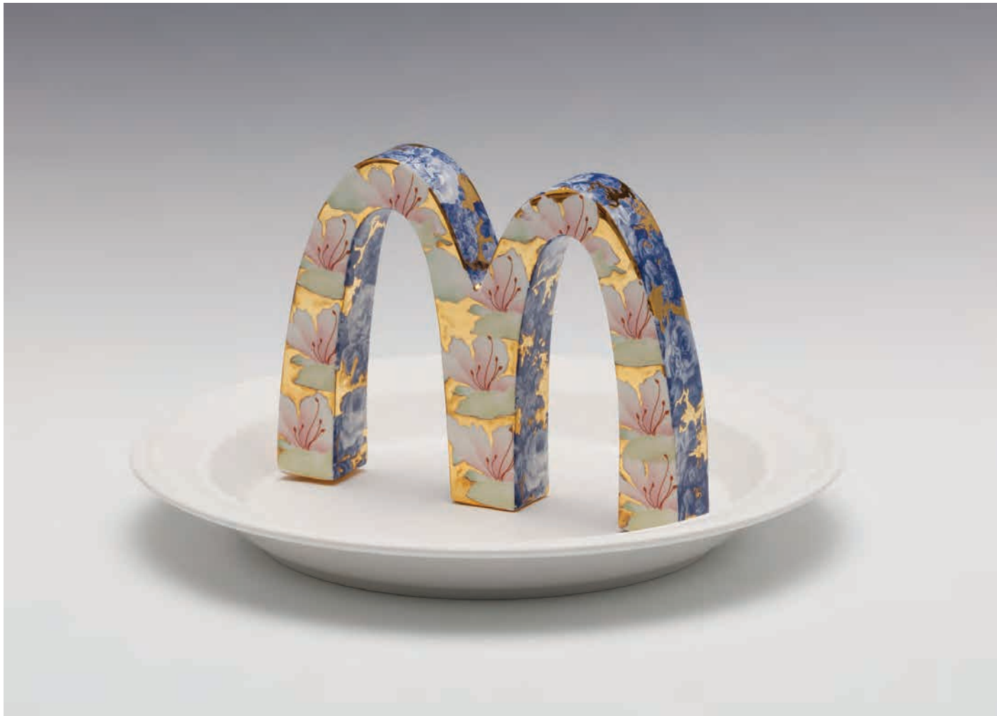
Treasure (Mc Donald) | 2018 | 백자, 금, 전사 | 17x13(h)x2.5(t)cm Porcelain, gold, decal