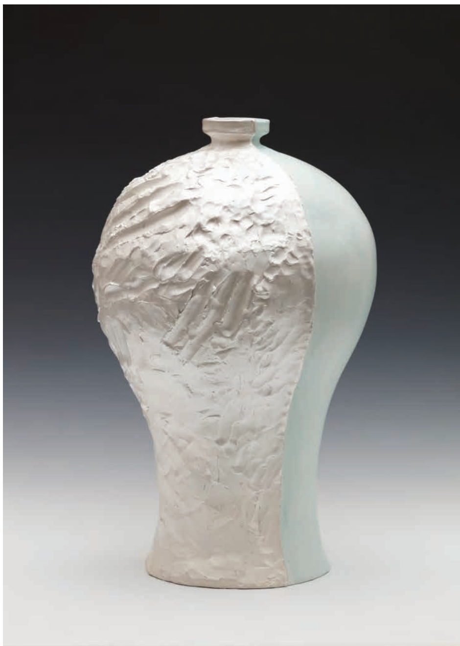
Ianuaris 2018 (Silver Mint) | 2018 | 백자 위에 은, 유 | Ø31x50cm Silver painting on porcelain, glaze