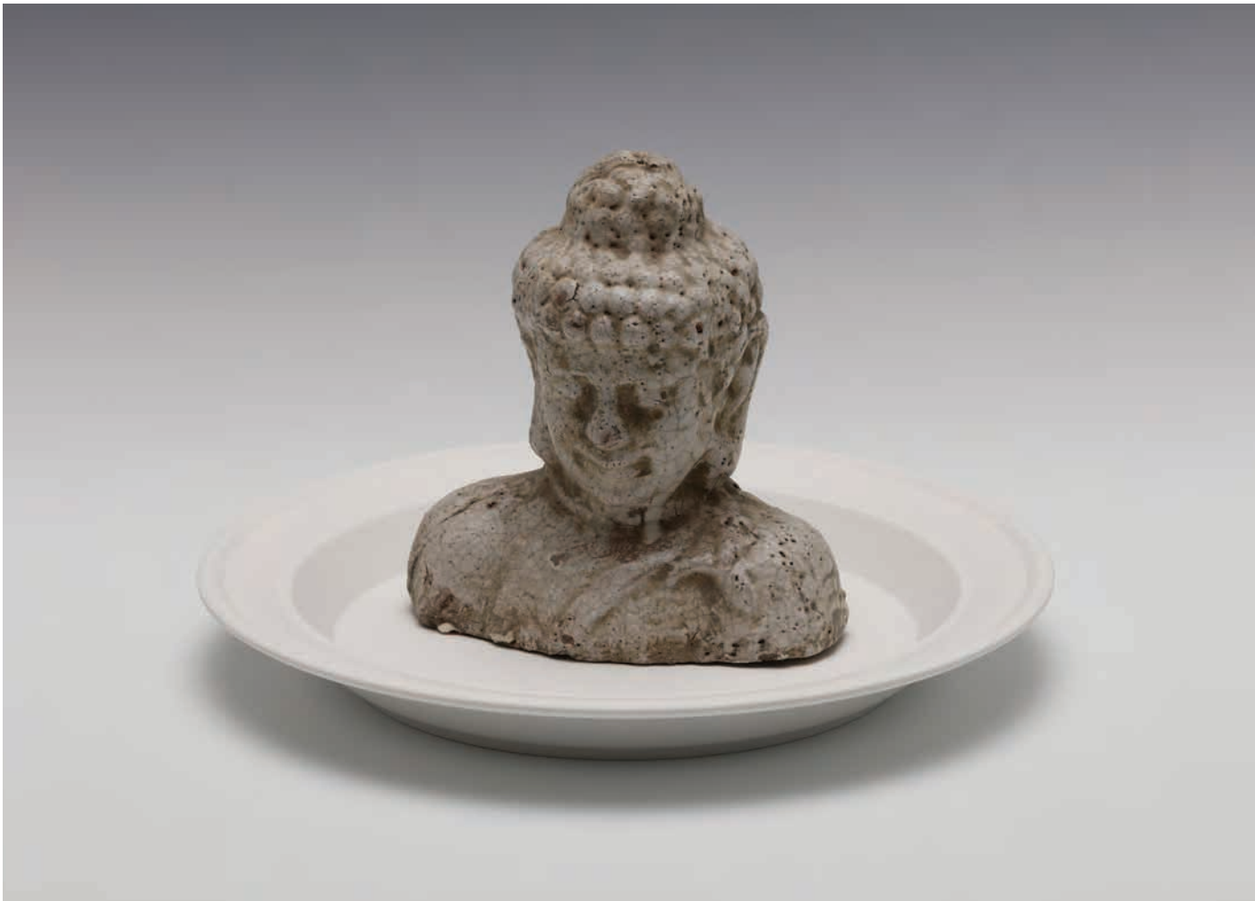
2018 | 도자기 | 14x8x15(h)cm | Treasure Ceramic | (Buddha)