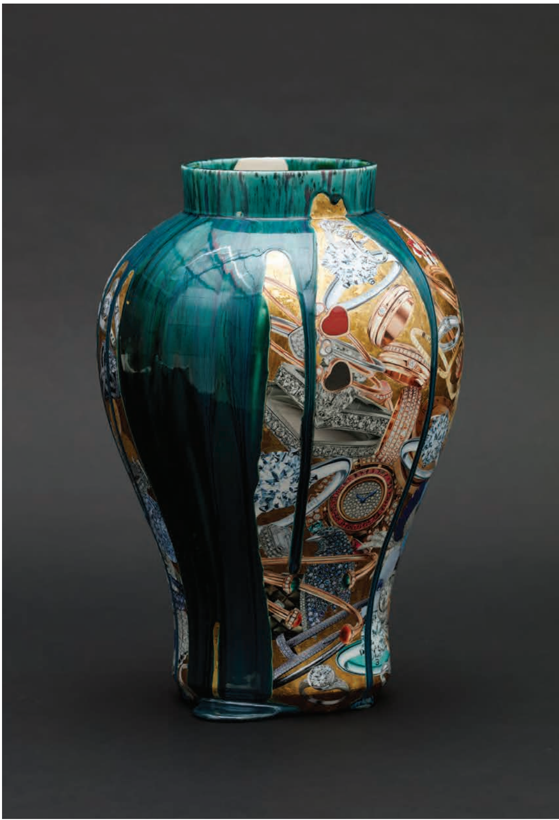
2018 ' 백자 위에 금박, 유약, 사진콜라주 ' Ø25x26(h)cm Gold leaf on blue and white porcelain, glaze, photo collage

2016 ' 백자 위에 금, 유약, 사진콜라주 ' Ø38x47(h)cm White porcelain, glaze, gold