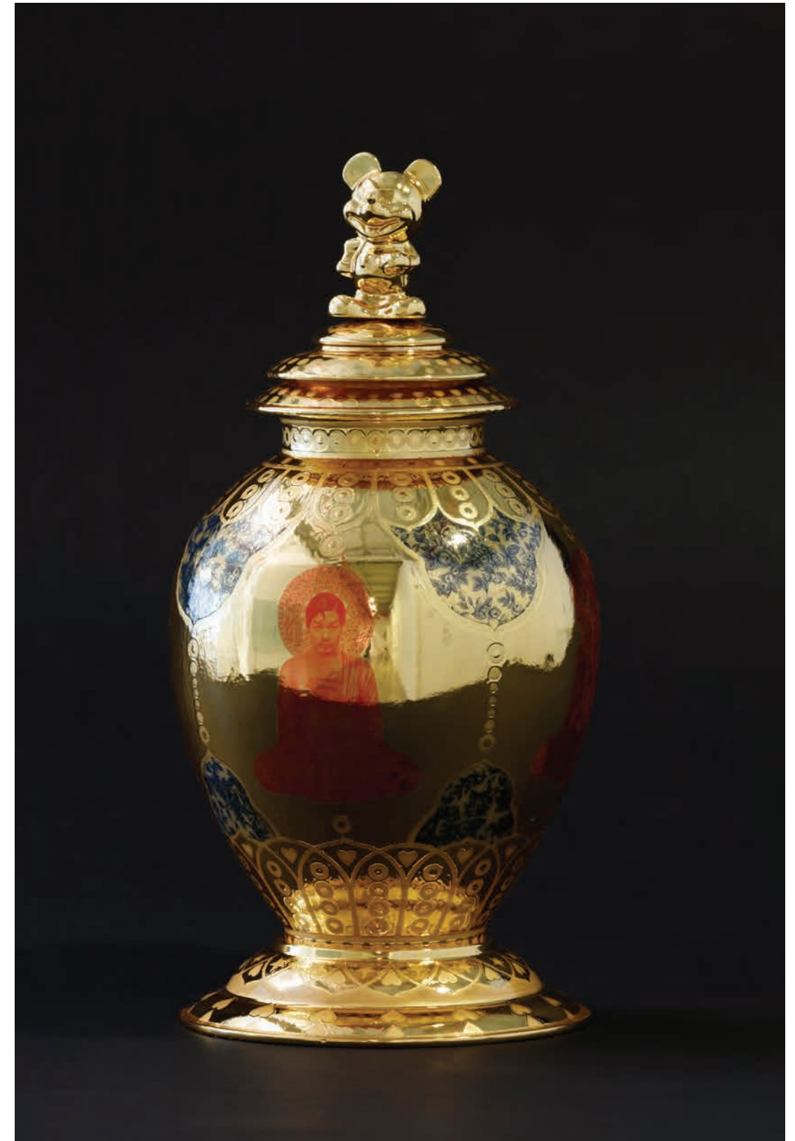
2017 ' 백자 위에 금, 유약, 사진 전사 ' 29x29x58cm | Ego Gold painting on porcelain, glaze, decal | (gold ver.)