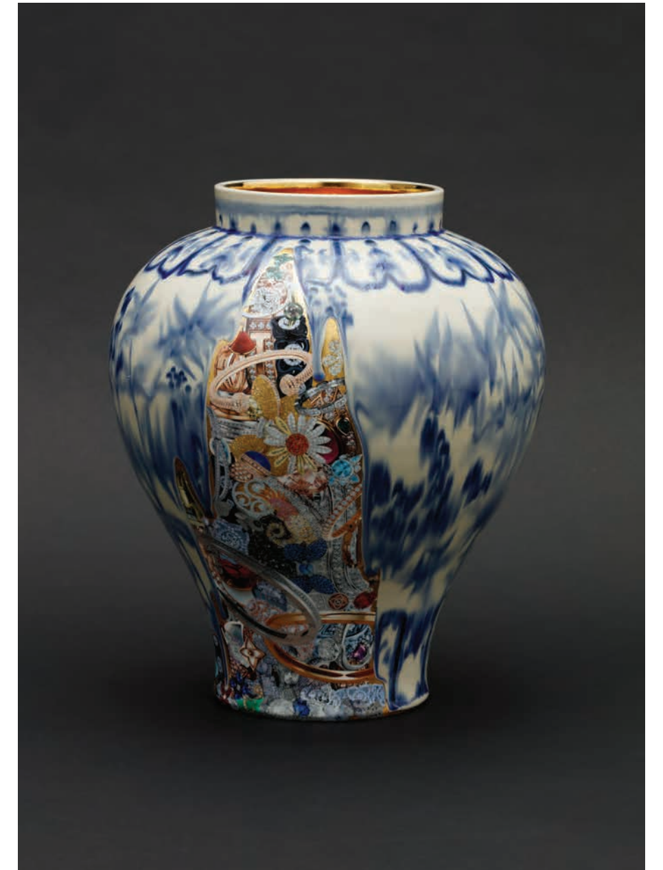
2018 | 백자 위에 금, 유약, 사진콜라주 | Ø35x44cm Gold painting on blue and white porcelain, glaze, photo collage