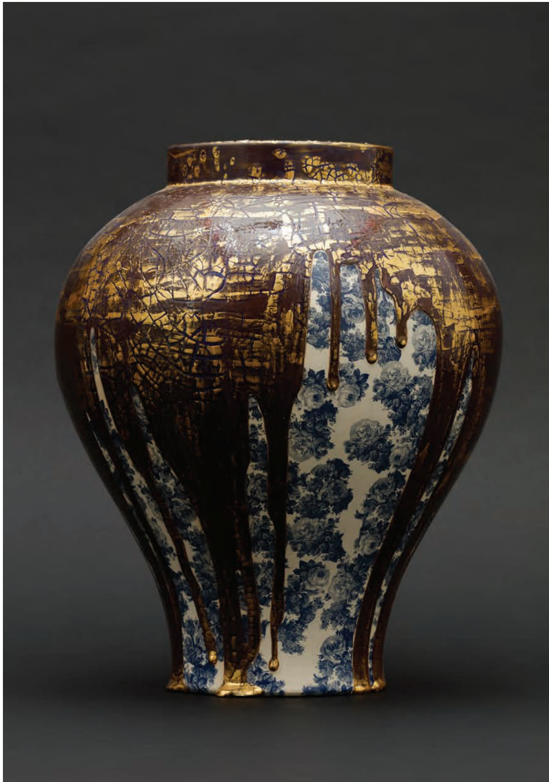
Imagery & Figuration J2 (Blue&Gold)

2016 ' 백자 위에 금, 유약, 사진콜라주 ' Ø38x47(h)cm White porcelain, glaze, gold