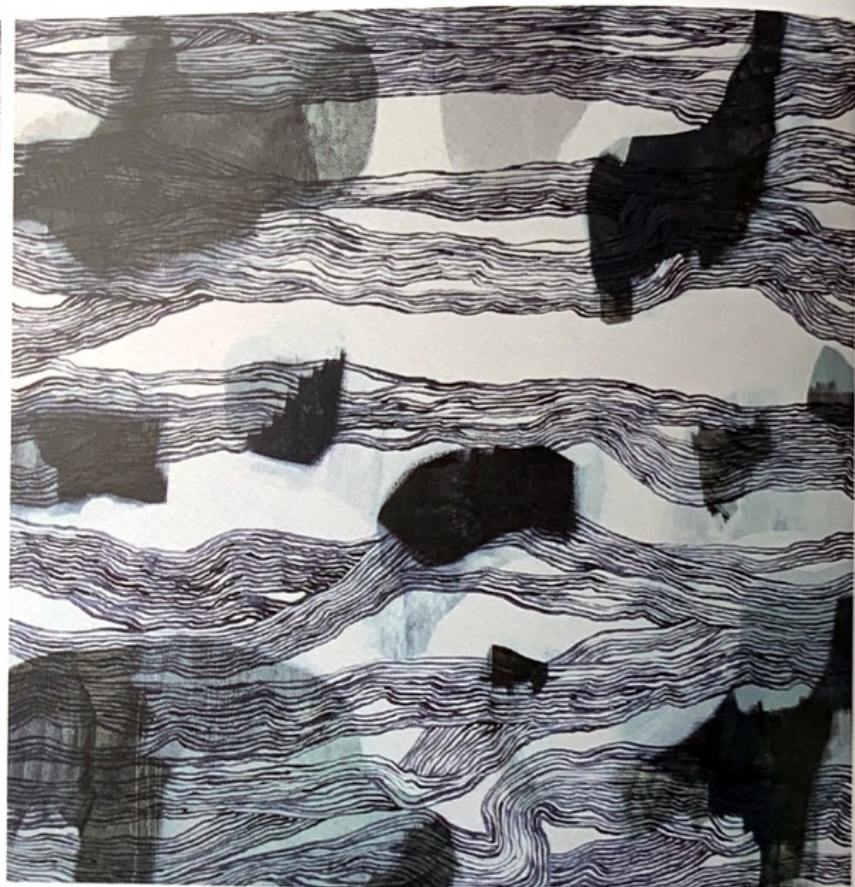
Sin Título , 2014, óleo sobre lienzo, diptico, 100 x 200 cm. Untitled , 2014, oil on canvas, diptych, 39,3 x 78,7 in.