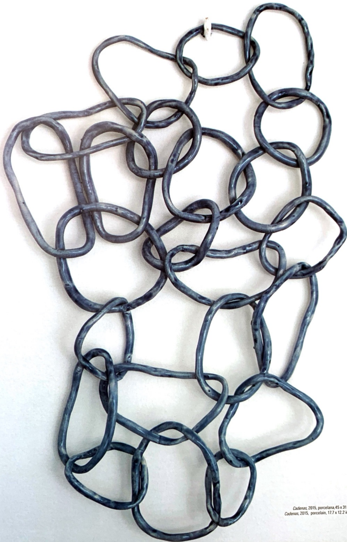
Cadenas , 2015, porcelain, 45 x 31 cm. Cadenas , 2015, porcelain, 17.7 x 12.2 in.