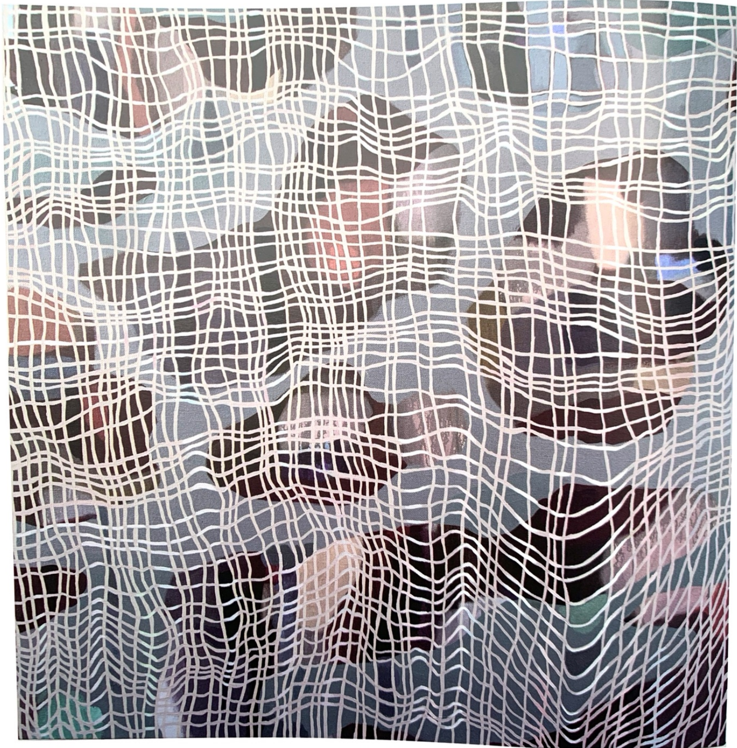
Sin Título , 2015, óleo sobre lienzo, 130 x 130 cm. Untitled , 2015, oil on canvas, 51,1 x 51,1 in.