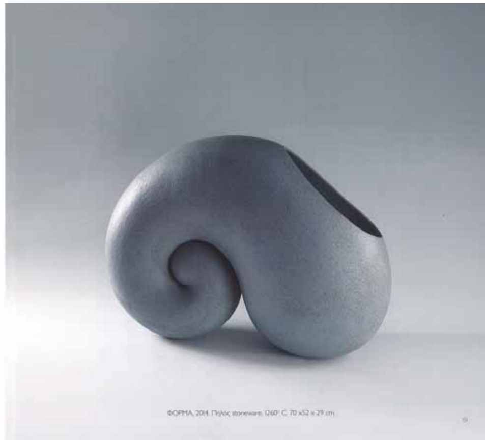
ΦΟΡΜΑ, 2014. Πηλός, stoneware, 1260° C, 70 x 52 x 29 cm

3. ΚΟΥΣ-ΚΟΥΣ, 2004. Πηλός, stoneware, γαλά, 1260o C. Διάμ: 72 cm