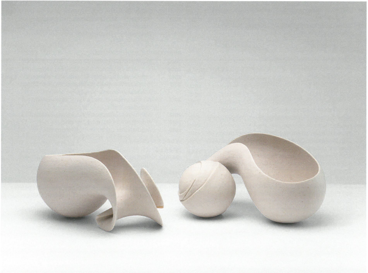
Συνομιλία, πηλός υψηλής θερμοκρασίας, γυαλί 1260°C Dialogue, stoneware clay, glaze 1260°C