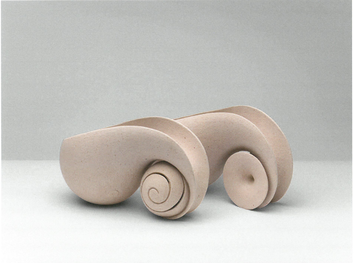
Αντίστιξη, πηλός υψηλής θερμοκρασίας, γυαλί 1260°C Counterpoint, stoneware clay, glaze 1260°C