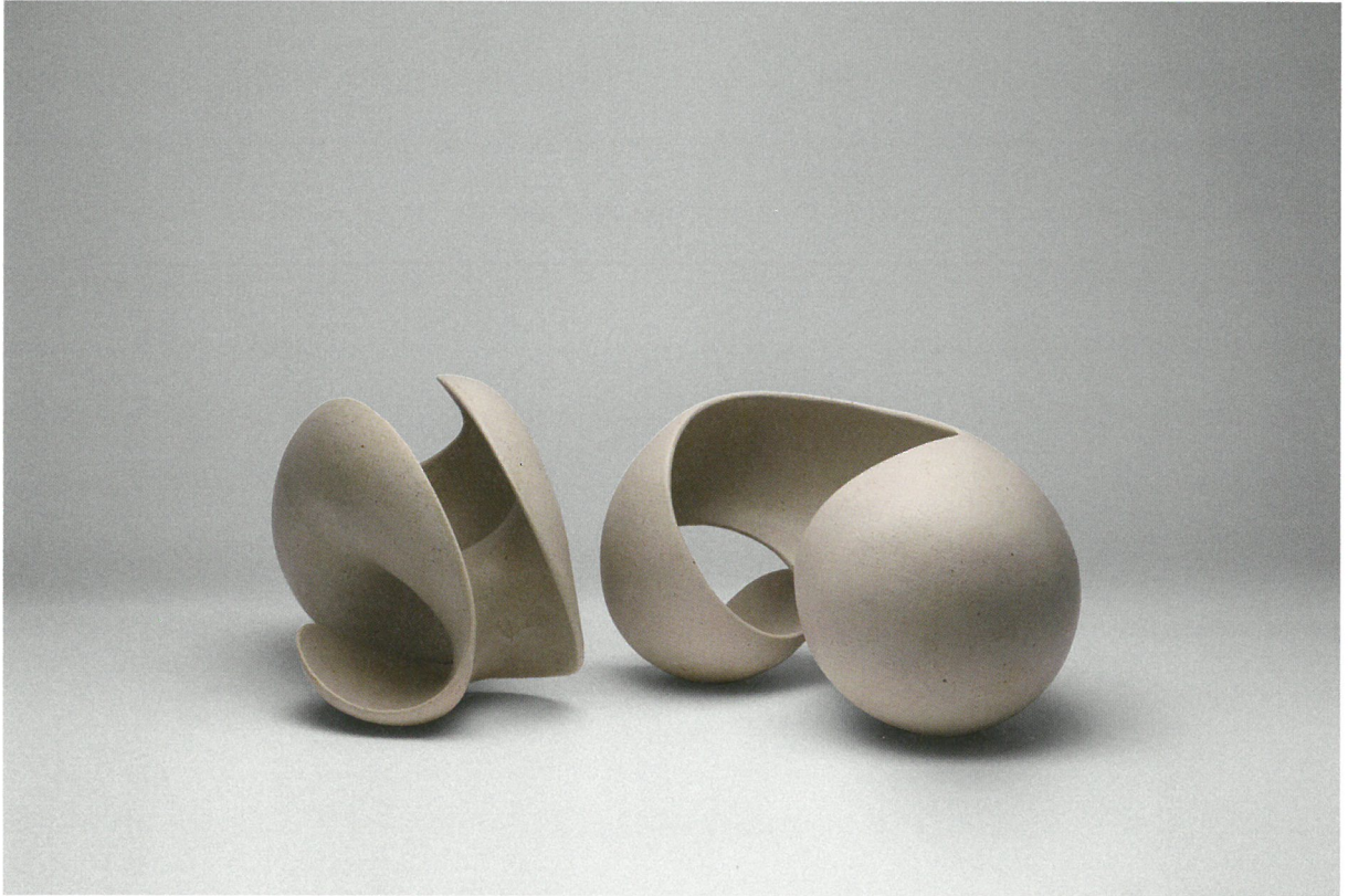
συνομιλία, πηλός υψηλής θερμοκρασίας, γυαλί 1260°C Dialogue, stoneware clay, glaze 1260°C