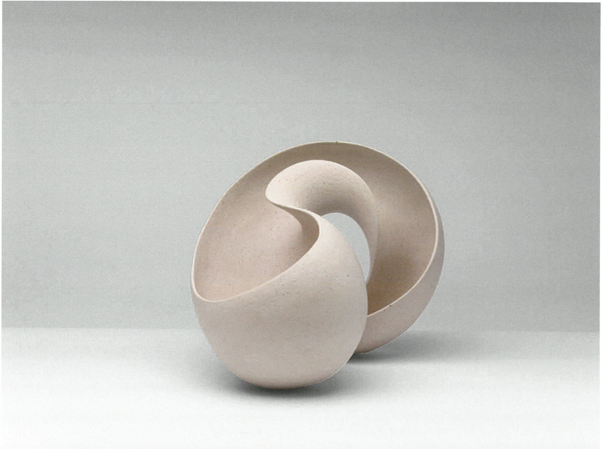
φόρμα, πηλός υψηλής θερμοκρασίας, γυαλί 1260°C, 46x35x33 Form, stoneware clay, glaze 1260°C, 46x35x33