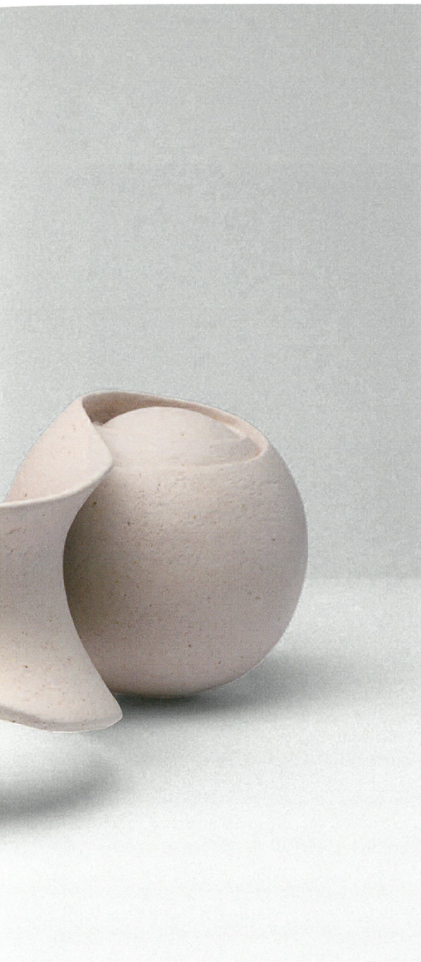
φόρμα, πηλός υψηλής θερμοκρασίας, γυαλί 1260°C, 54x50x23 Form, stoneware clay, glaze 1260°C, 54x50x23