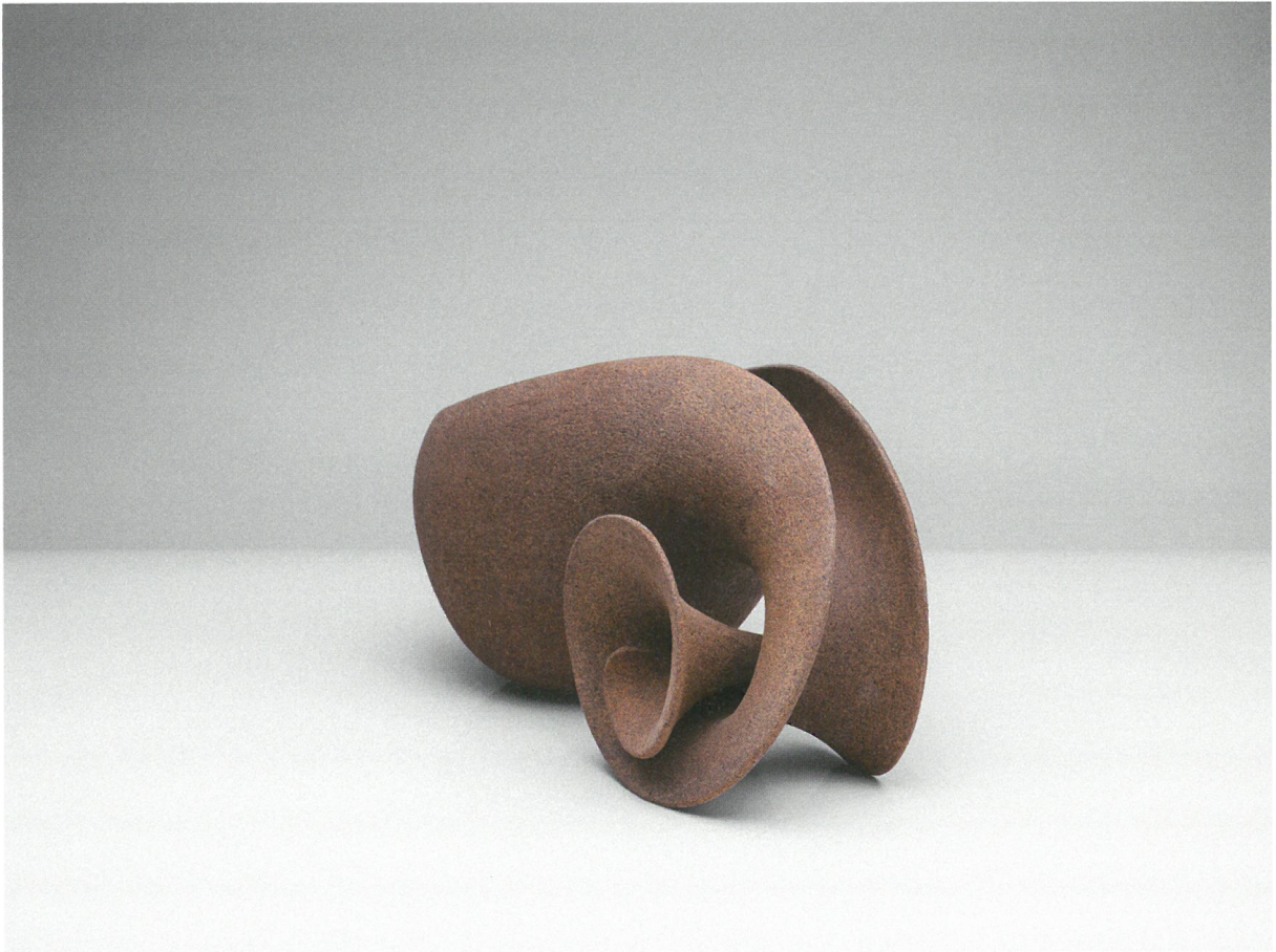
φόρμα, πηλός υψηλής θερμοκρασίας, πατίνα, αναγωγή 1260°C, 35x15x19 Form, stoneware clay, patina, reduction 1260°C, 35x15x19