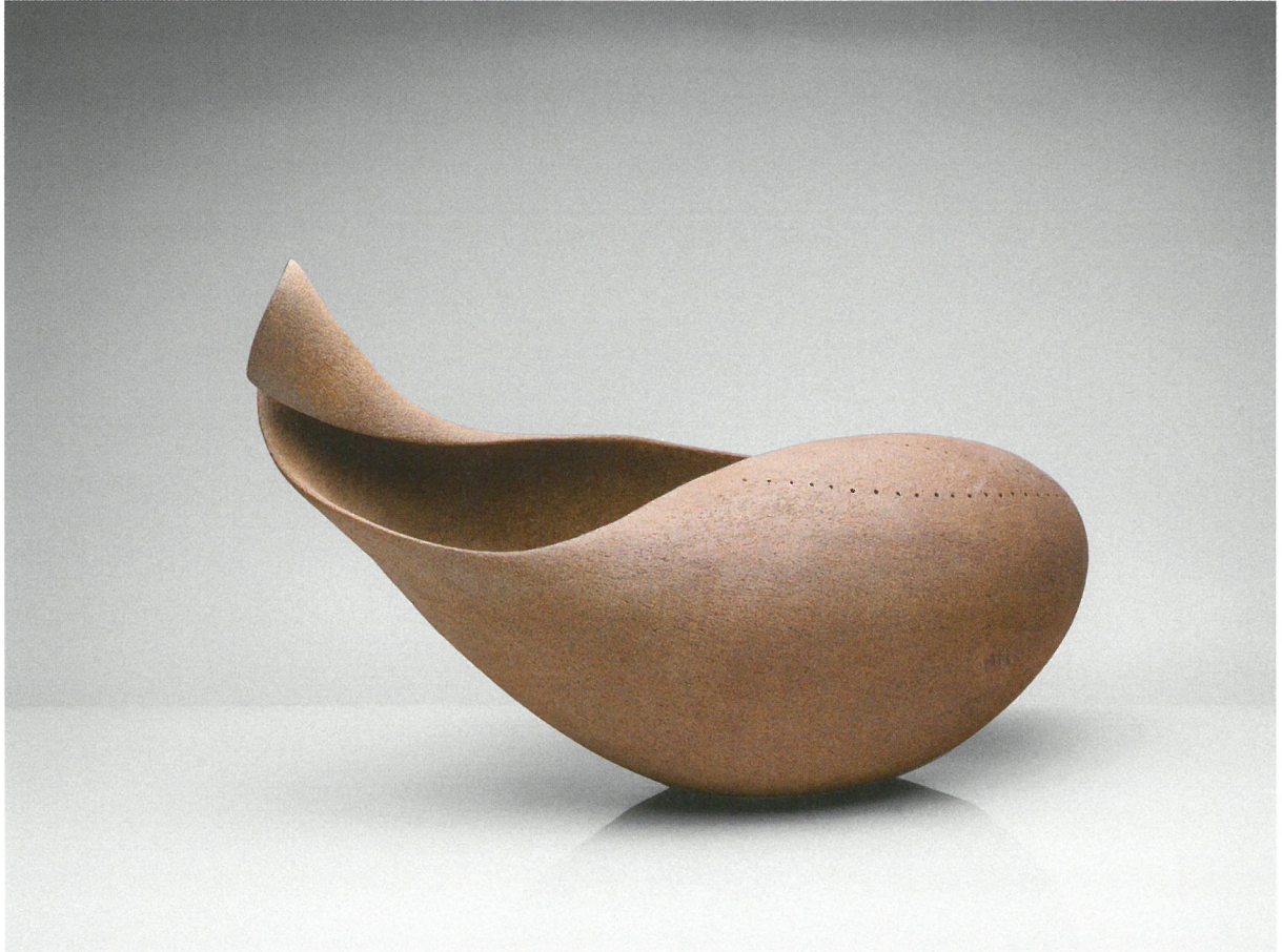
φόρμα, πηλός υψηλής θερμοκρασίας, πατίνα, αναγωγή 1260°C, 60x28x37 Form, stoneware clay, patina, reduction 1260°C, 60x28x37