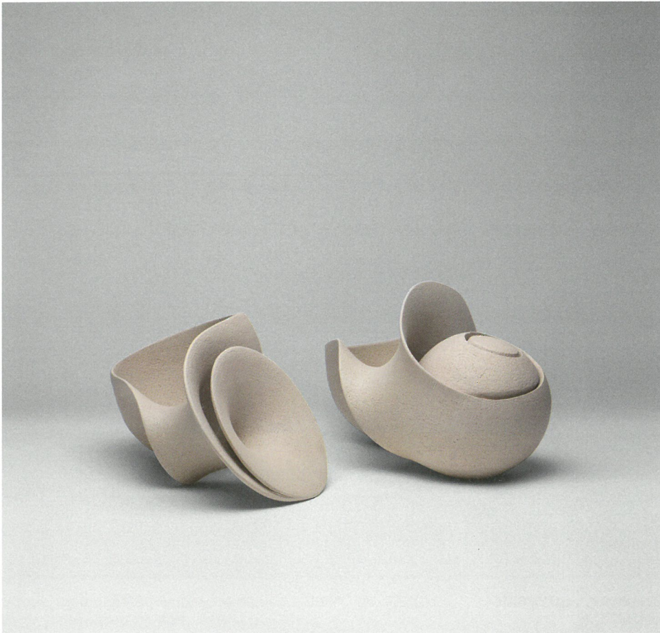
συνύπαρξη, πηλός υψηλής θερμοκρασίας, γυαλί 1260°C Coexistence, stoneware clay, glaze 1260°C