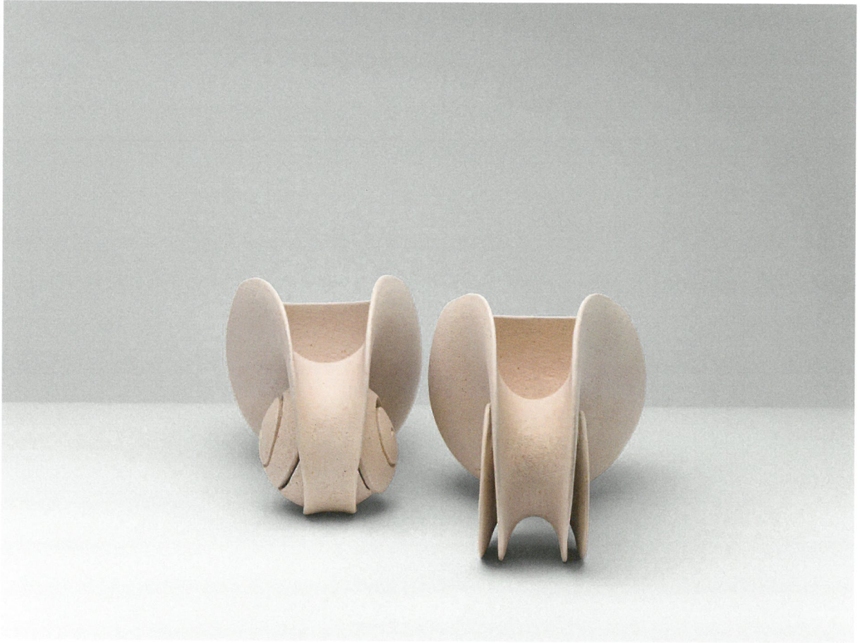
Αντίστιξη, πηλός υψηλής θερμοκρασίας, γυαλί 1260°C Counterpoint, stoneware clay, glaze 1260°C