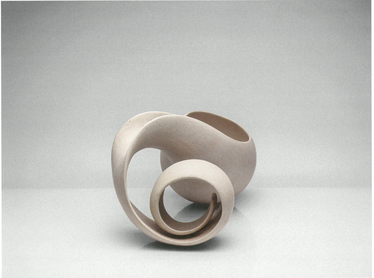
φόρμα, πηλός υψηλής θερμοκρασίας, γυαλί 1260°C, 50x28x24 Form, stoneware clay, glaze 1260°C, 50x28x24