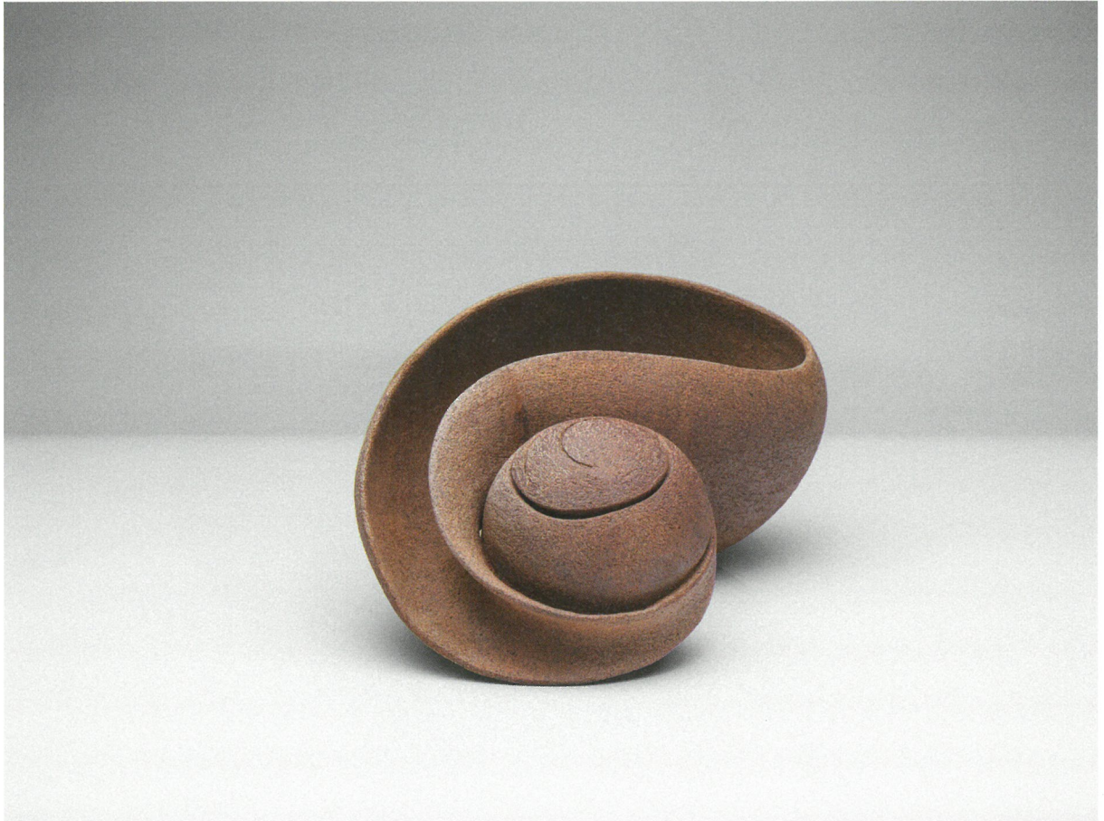
φόρμα, πηλός υψηλής θερμοκρασίας, πατίνα, αναγωγή 1260°C, 33x20x16 Form, stoneware clay, patina, reduction 1260°C, 33x20x16