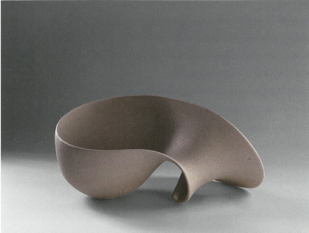
φόρμα, πηλός υψηλής θερμοκρασίας, γυαλί 1260°C, 47x27x22 Form, stoneware clay, glaze 1260°C, 47x27x22