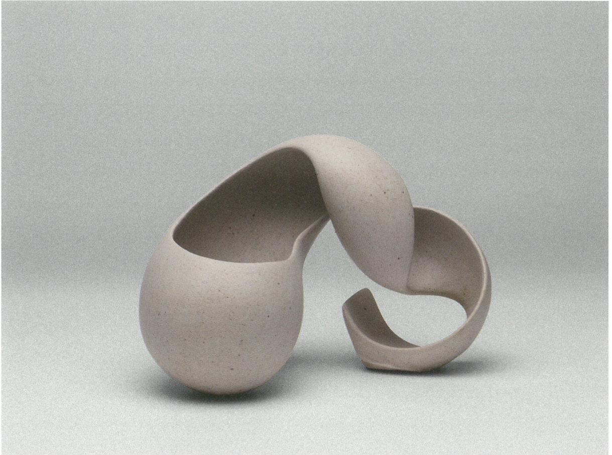
φόρμα, πηλός υψηλής θερμοκρασίας, γυαλί 1260°C, 32x16x21 Form, stoneware clay, glaze 1260°C, 32x16x21