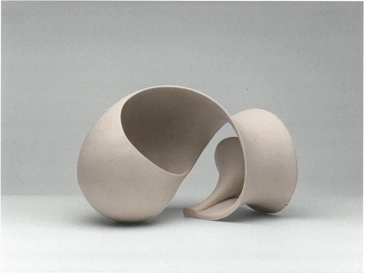
φόρμα, πηλός υψηλής θερμοκρασίας, γυαλί 1260°C, 47x22x30 Form, stoneware clay, glaze 1260°C, 47x22x30