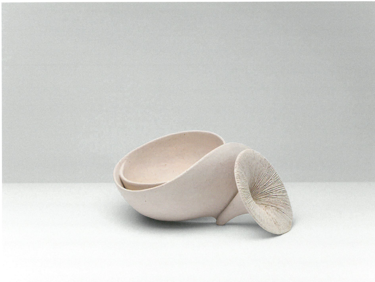
φόρμα, πηλός υψηλής θερμοκρασίας, γυαλί 1260°C, 36x26x21 Form, stoneware clay, glaze 1260°C, 36x26x21