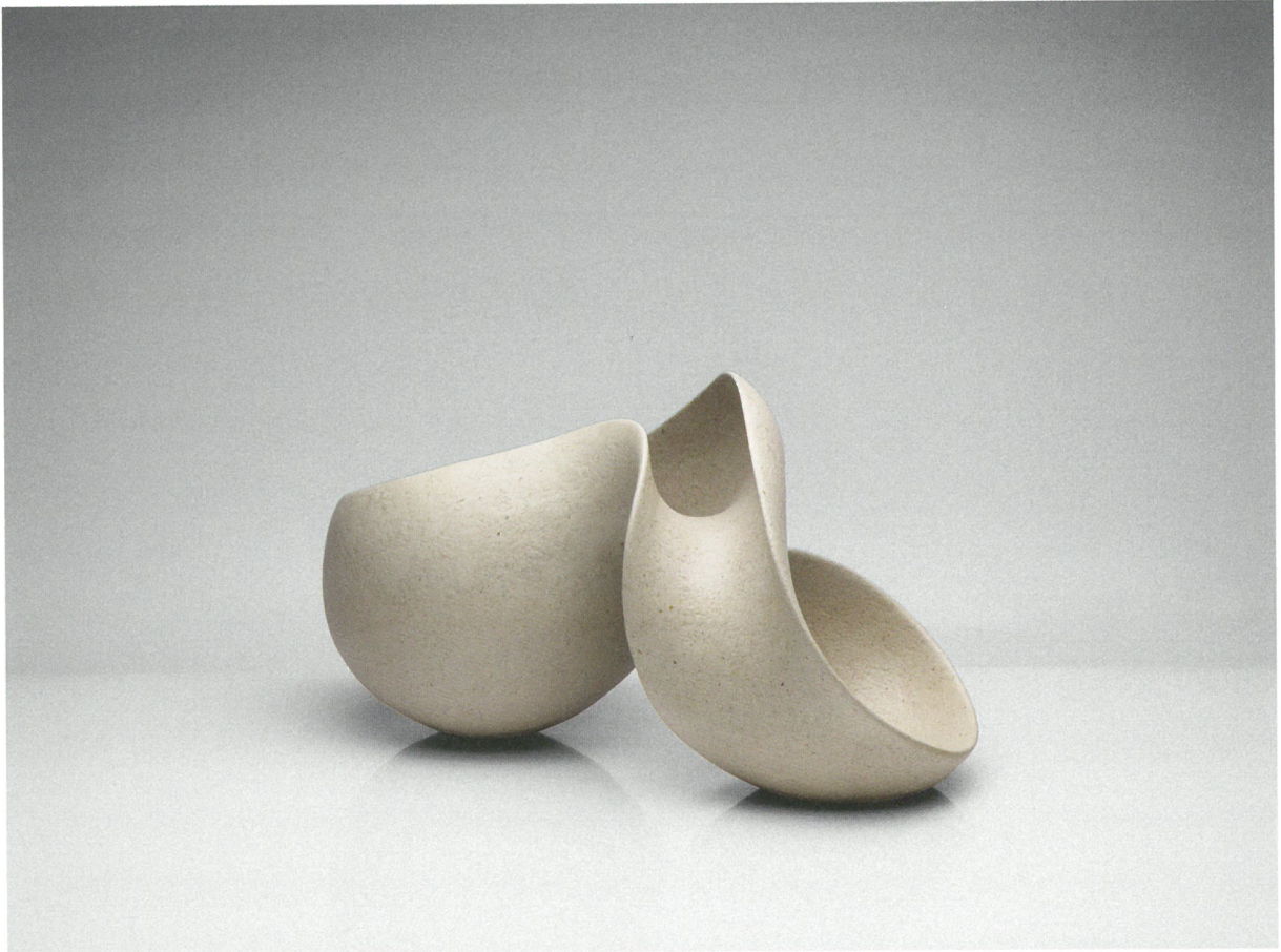
φόρμα, πηλός υψηλής θερμοκρασίας, γυαλί 1260°C, 52x25x30 Form, stoneware clay, glaze 1260°C, 52x25x30