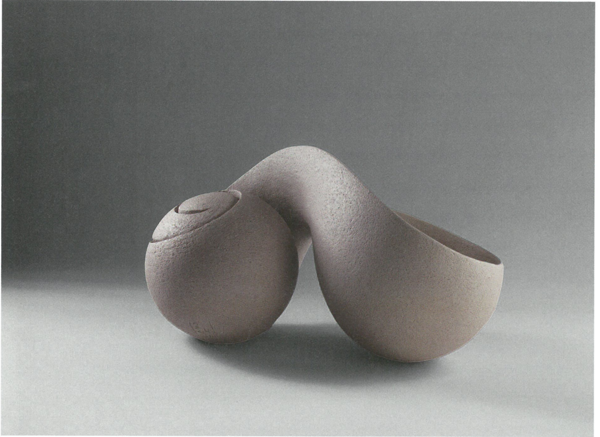
φόρμα, πηλός υψηλής θερμοκρασίας, γυαλί 1260°C, 48x27x26 Form, stoneware clay, glaze 1260°C, 48x27x26