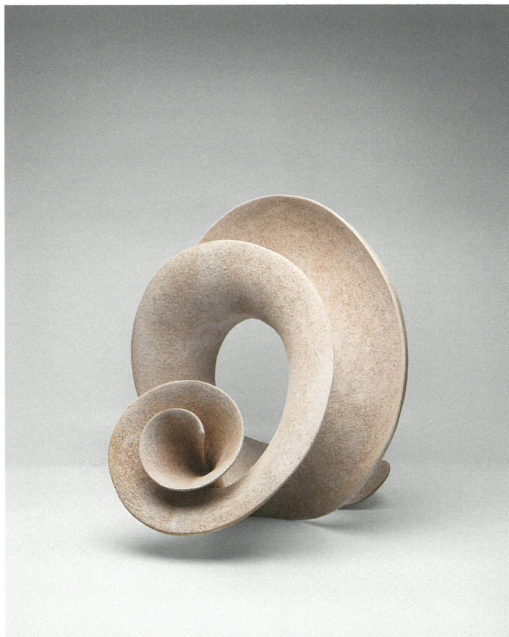
φόρμα, πηλός υψηλής θερμοκρασίας, πατίνα 1260°C, 60x58x58 Form, stoneware clay, patin 1260°C, 60x58x58