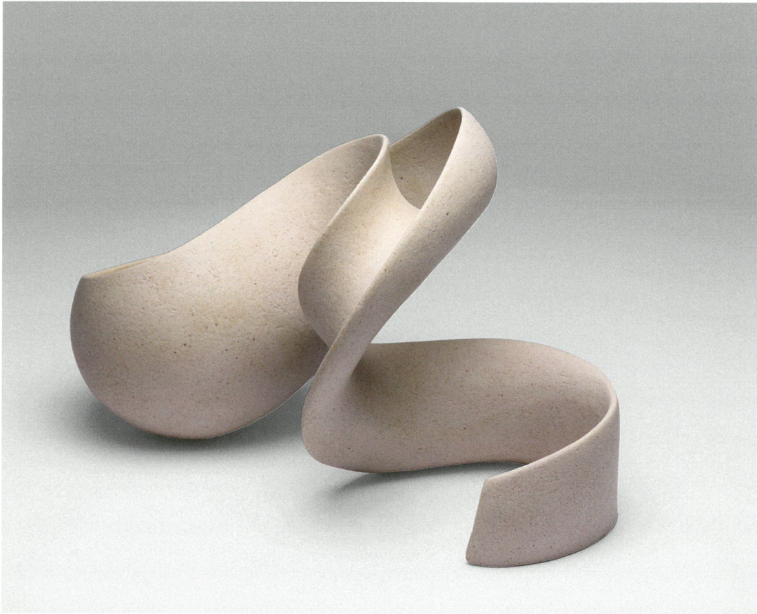
φόρμα, πηλός υψηλής θερμοκρασίας, γυαλί 1260°C, 58x33x37 Form, stoneware clay, glaze 1260°C, 58x33x37