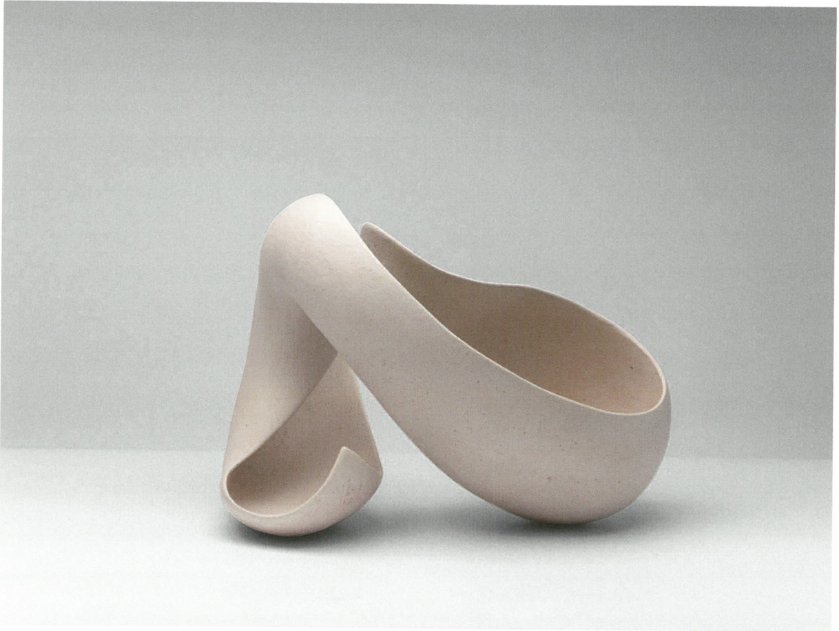
φόρμα, πηλός υψηλής θερμοκρασίας, γυαλί 1260°C, 46x35x33 Form, stoneware clay, glaze 1260°C, 46x35x33