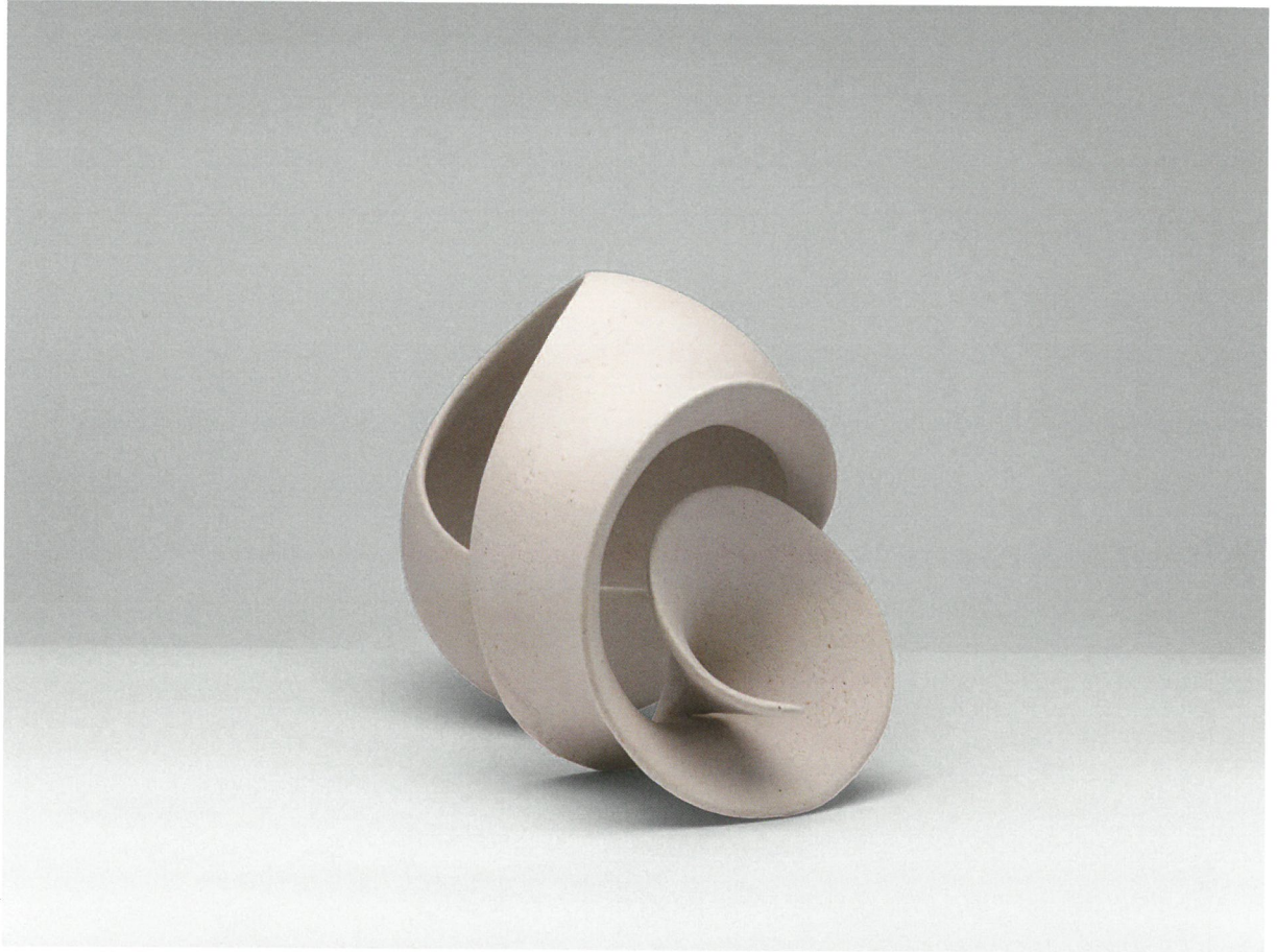
φόρμα, πηλός υψηλής θερμοκρασίας, γυαλί 1260°C, 47x22x30 Form, stoneware clay, glaze 1260°C, 47x22x30