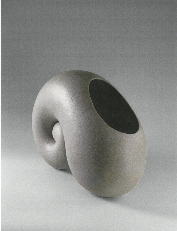
φόρμα, πηλός υψηλής θερμοκρασίας, γυαλί 1260°C, 60x30x52 Form, stoneware clay, glaze 1260°C, 60x30x52