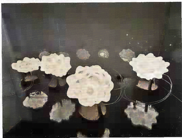
克里斯汀娜·托韦和她的作品《阿米巴虫》 2019年（上图） 克里斯汀娜·托韦《病毒》瓷器及多媒体 2015年（下图）

细致讲述了其艺术创作方法和目的，也为云南艺术学院学子们介绍了她在景德镇的经历和从不同文化碰撞中提取知识的经验。其中所产生的教学意义一方面在于借助艺术家的亲身经历和实践，了解一种新艺术样式的缘起。通过托韦的感知体会，有着古老历史的中国瓷材质、光影和现代多媒体科技在艺术家的转换下，蜕变出让人惊异的形态。另一方面，托韦的创作无疑是从传统中提取新元素来创作个性化艺术的一个典型案例。从中不难看出，传统并不仅仅是一种发生于过去的文化烙印，而是一颗文明的种子，只要遇上适应的土壤和机遇，就能生根发芽，盛开出新的传统之花。