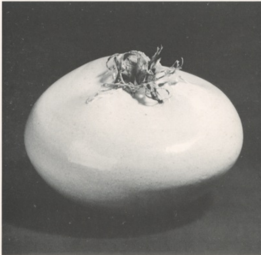
Transparencia de una Anemona.