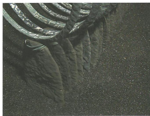
Nathalie Doyen, Topali (details), 2014; grès gekleurd met kobalt en porseleinenogobes, 1200°C; 380 x 47 x 23 cm.