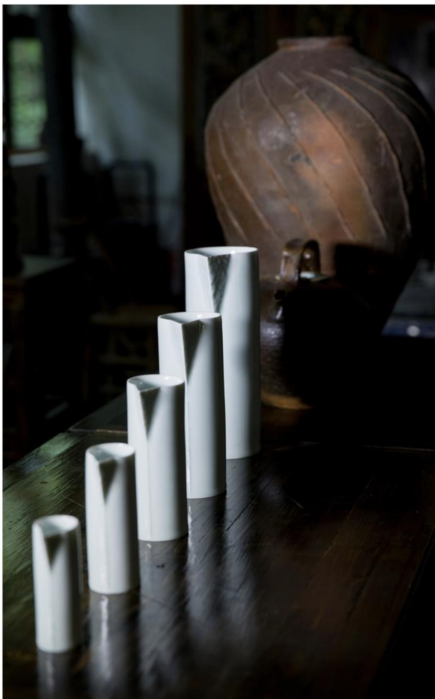
安田猛为红房子创作的产品系列

在景德镇期间，安田先生的创作还有一个变化，那就是他开始使用模具灌浆工艺。在这之前，他的所有作品都是在辘轳车上拉胚制作的。虽然灌浆被人更多地认为是工业设计的技术，但对安田先生而言，这只是一种不同的工具，和之前的手法没有什么不同。的确，为红房子最新设计的一款咖啡杯具，安田先生就动手雕刻了20个不同的模具，每件成品都有着手工的精致质感和细微差别。