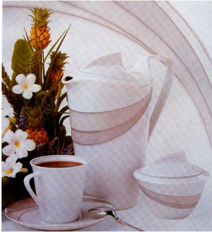
图3 皮尔·卡丹 马克西姆的巴黎餐