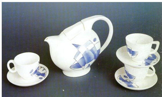
图 1 刘谦 生源咖啡具