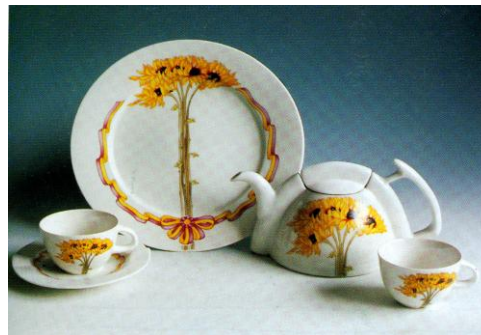
图 2 王耀玲 和谐茶具