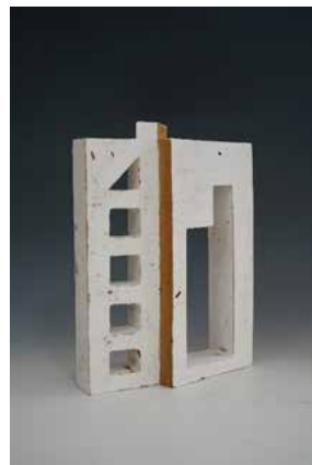
梁凌 《脊·NO2》 8×28×38.5cm