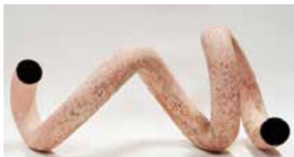
孙奕周 《管系列之八》 80×30×33cm