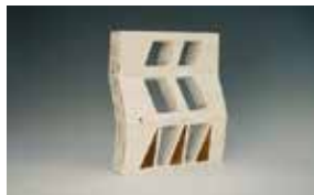
梁凌 《脊·NO1》 5.3×28.5×36cm