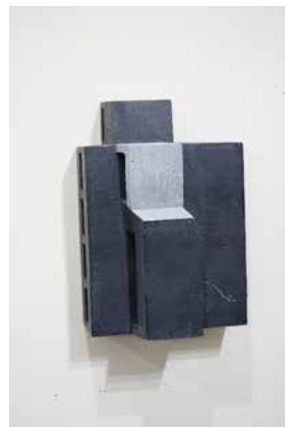
梁凌 《脊·NO7》 37×26×15cm