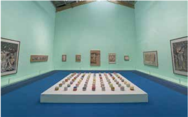
《记忆的备份》 创作时间：2016–2018 年 材料：高温陶瓷 尺寸：4mx4m

1966 生于中国大连市，是位充满创造力的艺术家。作品涉及绘画，雕塑，装置，摄影等不同媒介。他 1989 年毕业于中央美术学院版画系，同年参加中国现代艺术大展， 2002 年获 CCAA 中国当代艺术奖。在柏林，伦敦，上海，北京，佛罗伦萨，热那亚等地均举办过其作品展，其中著名美术馆有波兰华沙国立美术馆，巴黎蓬皮杜中心，德累斯顿艺术中心，今日美术馆，马丁－格罗皮乌斯博物馆，鄂尔多斯美术馆，帕多瓦 VILLA BREDA 博物馆，美第奇·里卡尔第宫殿，其作品受到公共与私人收藏家的追捧，并在 2011 年，作为代表艺术家，参加了第 54 届威尼斯双年展中国馆的展览。