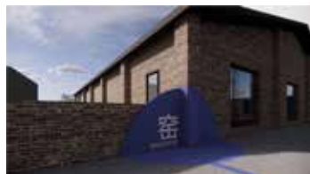
空间作品区 匣钵厂仓库