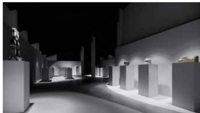
陶瓷艺术作品 (按展览路线)