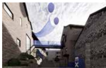
陶艺作品区 匣钵广场