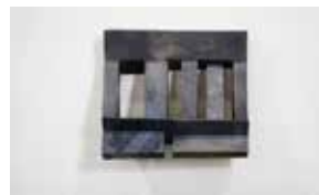
梁凌 《脊·NO3》 5.5×30×30.5cm