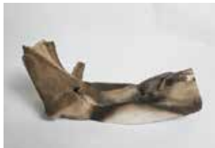
李蕙伦 《山区系列》 31×9×12cm