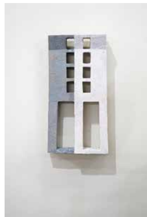
梁凌 《脊·NO8》 45×24×10cm