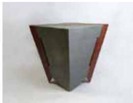
何昕为 《身体系列二》 42×42×57cm