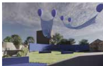
开幕活动区 草坪广场