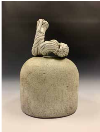
岳立志 《山抹微云》 48×28×23cm