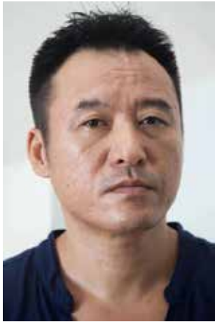
杨茂源 Yang Maoyuan

1966 生于中国大连市，是位充满创造力的艺术家。作品涉及绘画，雕塑，装置，摄影等不同媒介。他 1989 年毕业于中央美术学院版画系，同年参加中国现代艺术大展， 2002 年获 CCAA 中国当代艺术奖。在柏林，伦敦，上海，北京，佛罗伦萨，热那亚等地均举办过其作品展，其中著名美术馆有波兰华沙国立美术馆，巴黎蓬皮杜中心，德累斯顿艺术中心，今日美术馆，马丁－格罗皮乌斯博物馆，鄂尔多斯美术馆，帕多瓦 VILLA BREDA 博物馆，美第奇·里卡尔第宫殿，其作品受到公共与私人收藏家的追捧，并在 2011 年，作为代表艺术家，参加了第 54 届威尼斯双年展中国馆的展览。