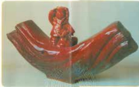
作品名稱: 《盼》 Name of the work: (Expectation)