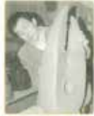
作者姓名: 陳其漢 Name of the artist: Chen Bohan